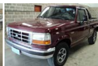
F-1000 XLT MWM ANO 1998