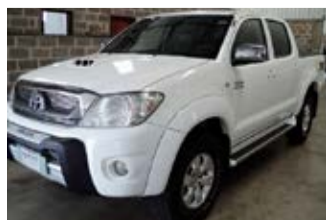
HILUX SRV 3.0 4x4 MECANICA ANO 2011