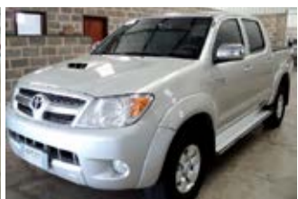
HILUX SRV 3.0 4x4 MECANICA ANO 2006