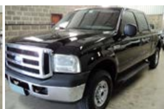
F-250 XLT MAXX POWER 4x4 ANO 2011