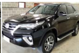
HILUX SW-4 SRX AUTOMATICA ANO 2017