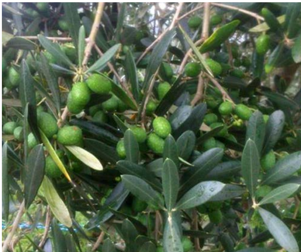
Ao todo, são 137.613 pés de oliveira em todo Estado de São Paulo

A produção paulista de oliveira e a qualidade dos azeites produzidos no Estado têm aumentado com auxílio do trabalho de pesquisa da APTA junto aos olivicultores. Além do encontro, a Agência realizou recentemente um curso sobre análise sensorial de azeite e ainda participou de um concurso para avaliar a qualidade dos azeites importados da América Latina e Europa.