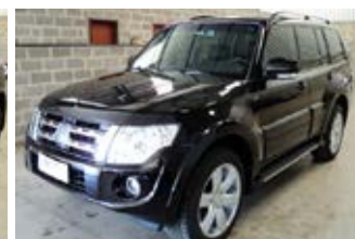
PAJERO FULL AUTOMATICA ANO 2013