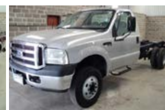
F-4000 CHASSI ANO 2010