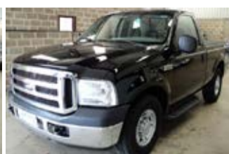
F-250 XLT SUPER DUTY ANO 2008