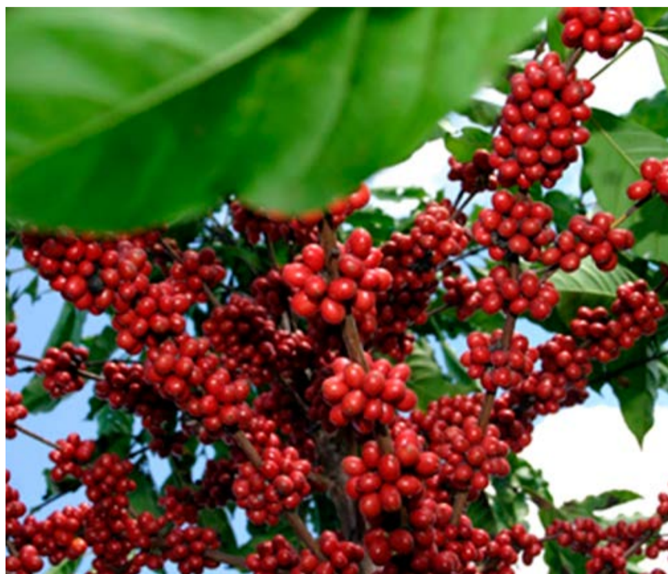
Pés de café estão carregados

A colheita do café em Caconde tem sido realizada durante a noite também. Isso para aproveitar o clima e o período sem chuva. A corrida para colheita tem gerado empregos temporários. Em apenas uma fazenda, há 100 trabalhadores e quase 70 foram contratados para dar conta do serviço.