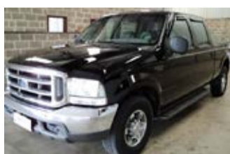
F-250 XLT C.DUPLA 4x2 ANO 2004

www.comercialgomes.com / comercialgomes.cb@bol.com.br