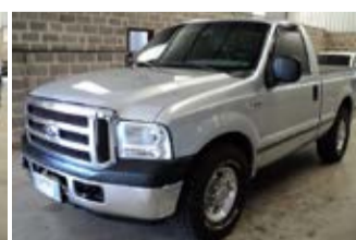
F-250 XLT SUPER DUTY ANO 2010