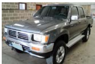
HILUX SRV 2.8 4x4 DIESEL MEC. 1998