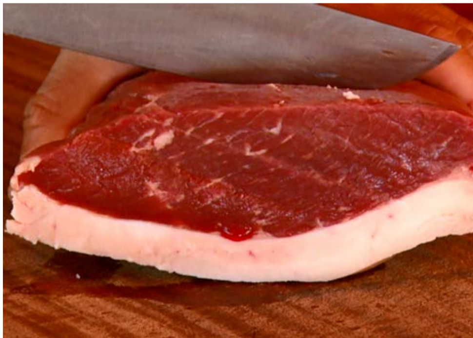
Aumentar o número de animais com grande quantidade de gordura na carne é um desafio para o pecuarista

A carne foi premiada por meio de votação pela internet. Segundo o pecuarista, aumentar o número de animais com grande quantidade de gordura na carne é um desafio a ser atingido. "Muita gente critica a gordura, mas a carne que realmente tem valor no mercado é a carne com gordura de cobertura e com marmoreio", disse.