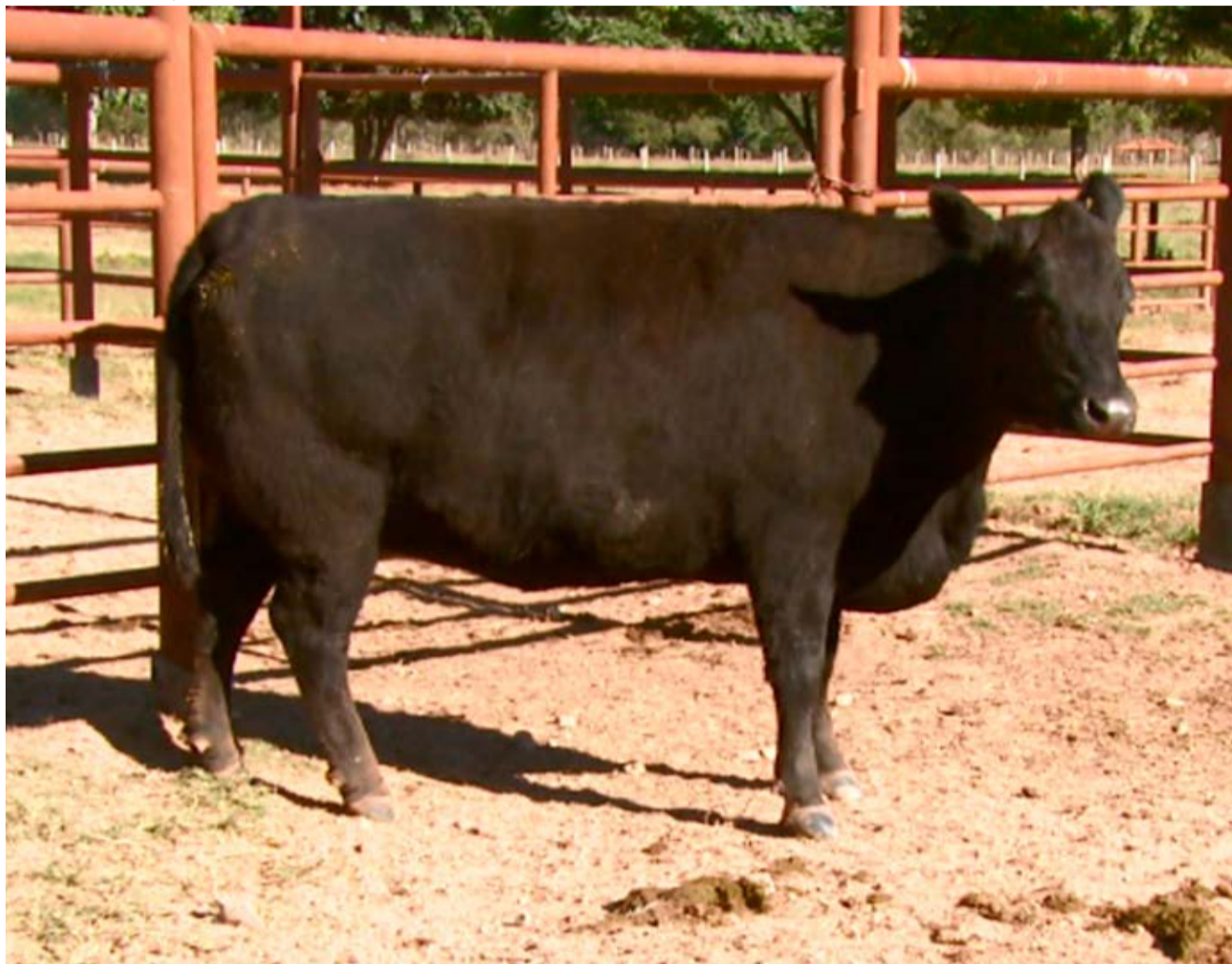
Cruzamento das raças Angus e Zebu resultou em animal com as características para o melhoramento da carne

A carne que sai de uma fazenda de Mococa foi premiada em um concurso na Beef Expo, realizada em São Paulo. Um dos objetivos da feira pecuária é discutir a qualidade das carnes.