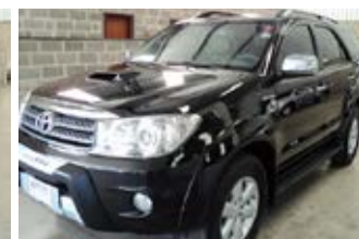
SW-4 AUTOMATICA ANO 2010