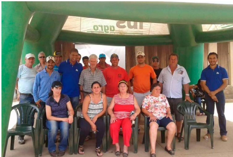
Dia de Campo em Águas da Prata

Instituto BioSistêmico levou assistência técnica e extensão rural para cerca de 600 famílias de agricultores familiares no Estado de São Paulo