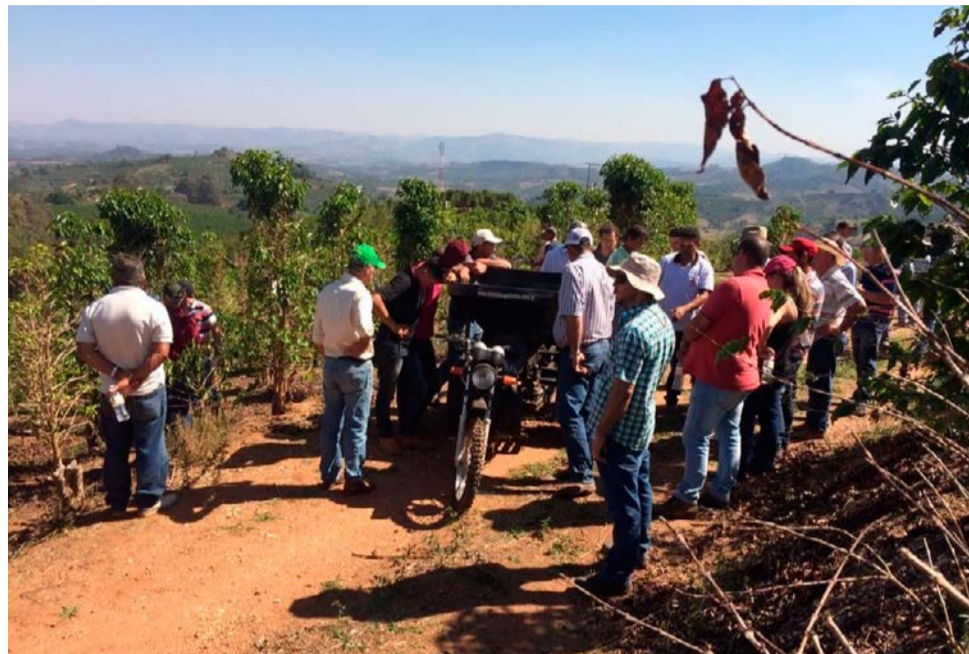
Dia de Campo em Caconde

“Os produtores perceberam que conseguiram alcançar melhores resultados depois de começarem a fazer análise de