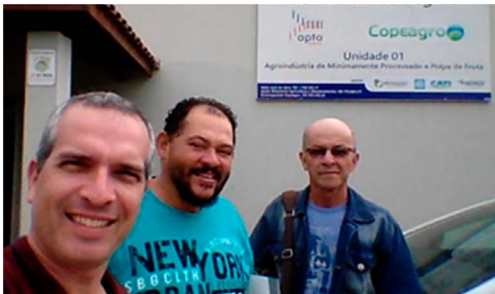
As visitas técnicas promovidas pelos técnicos da CATI têm o objetivo de auxiliar os produtores em tomada de decisões

Representantes da Casa da Agricultura de Nova Odessa estiveram na Copeagro para obter novos conhecimentos e trocar informações