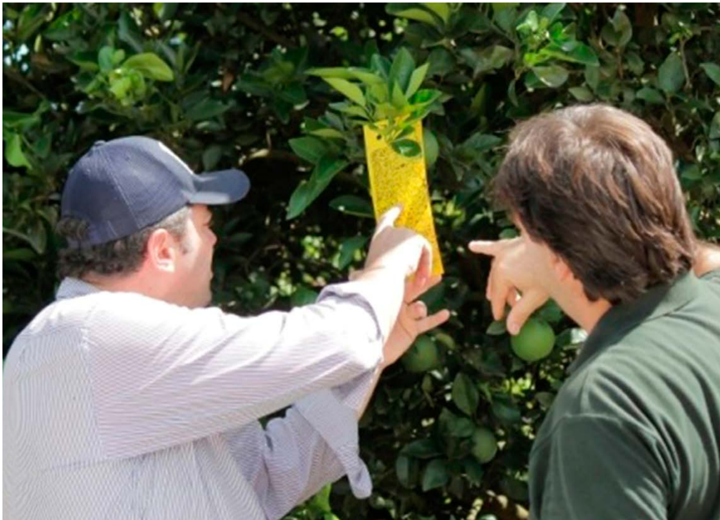
Armadilhas adesivas amarelas georreferenciadas são instaladas nas áreas monitoradas

Desde abril de 2017 a ferramenta cobre 61,9% do parque citrícola no Brasil – que engloba municípios de São Paulo e Minas Gerais; principal área produtora de citros do país. Com medidas mais efetivas e aplicadas de maneira conjunta e coordenada pelos citricultores, o manejo regional se tornou uma eficiente arma no combate à doença.