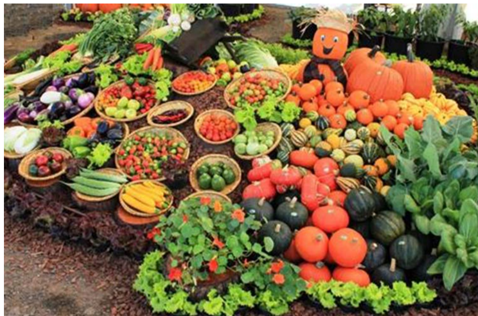
Em 2016, Hortitec contou com cerca de 400 empresas e atraiu mais de 29 mil visitantes