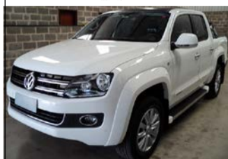
AMAROK H. 4X4 AUTOM. ANO 2015