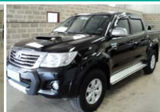
HILLLUX SRV 3.0 4X 4 AUTOM. ANO 2013