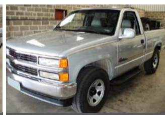
SILVERADO 4CC DIESEL ANO 1999