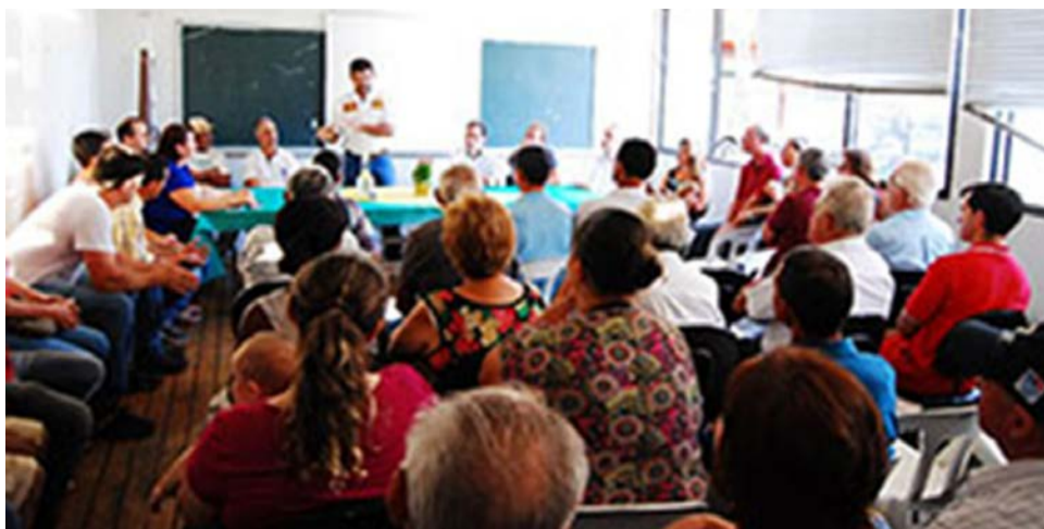
Feirantes se reuniram para discutir propostas de melhoria

O projeto contempla o consumidor final e também os pequenos produtores rurais, que