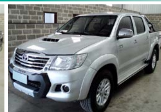
HILLLUX SRV 3.0 TOP. 4X 4 AUT. ANO 2014