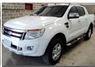
RANGER LIMITED 4X4 AUTOM. ANO 2014