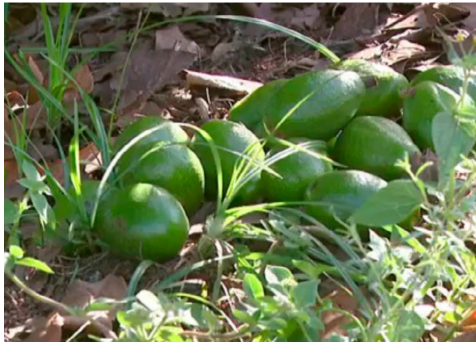
Frutos caem antes de alcançarem o ponto da colheita

O calor que ocorreu no início deste ano, com temperaturas que passam dos 35 graus, prejudicou a produção de abacate em Aguaí. Com a falta de chuva, a planta desidrata e os nutrientes não circulam. Os frutos enfraquecem, param de crescer e caem.