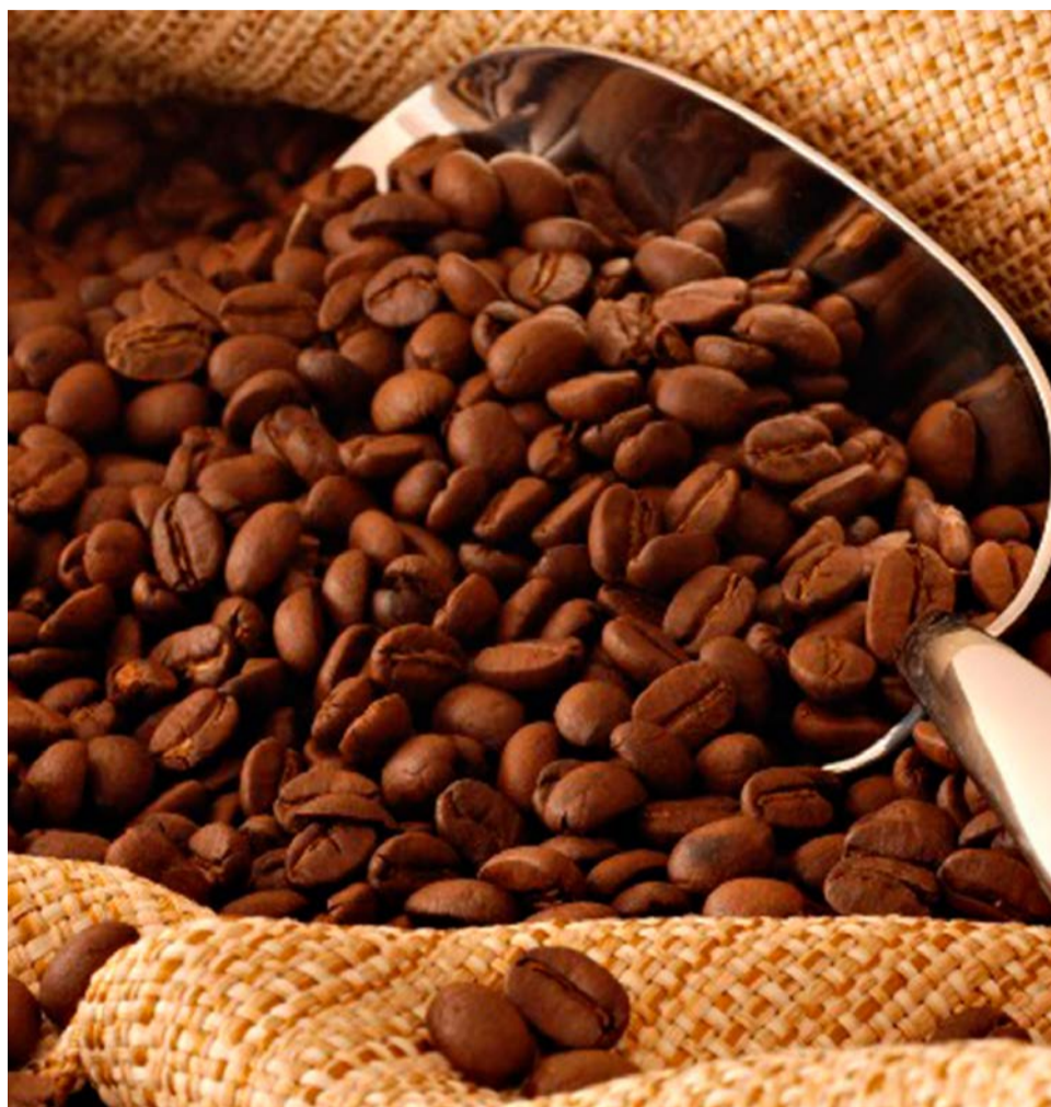
Café é destaque na economia de Espírito Santo do Pinhal

O Levantamento Censitário das Unidades de Produção Agropecuária do Estado de São Paulo (LUPA) também foi lembrado na reunião como uma