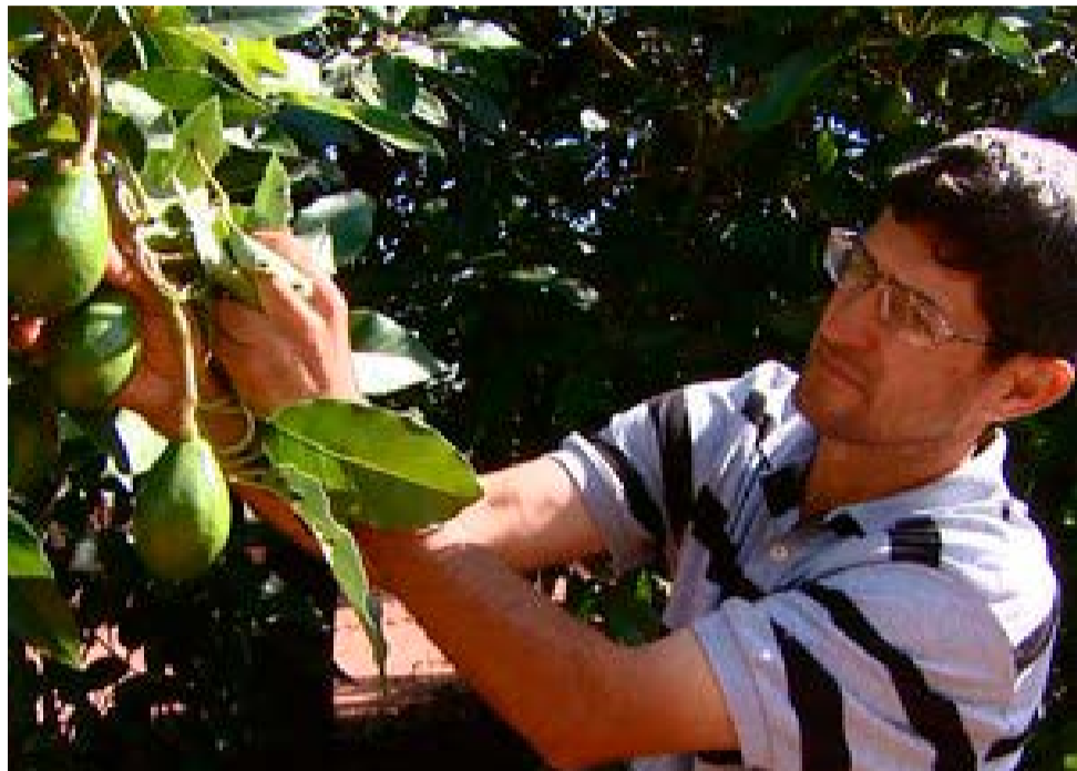
Calor excessivo e falta de chuva afeta produção