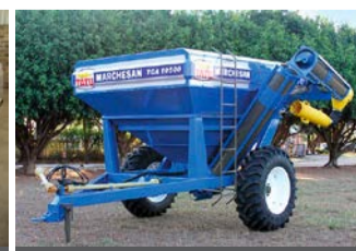
TRANSBORDO TCA-10500 ANO 2016