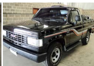
D-20 CUSTON ANO 1989