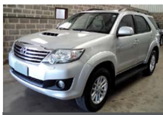
HILLLUX SW-3 4x4 AUTOM. ANO 2012