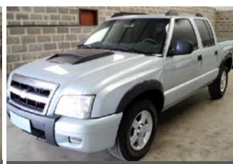
S-10 TORNADO 4x4 MECANICA ANO 2011