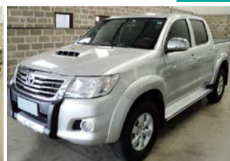
HILLLUX SRV 3.0 4X 4 AUTOM. ANO 2012