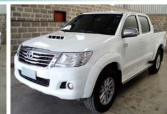
HILLLUX SRV 3.0 TOP. 4X 4 AUT. ANO 2015