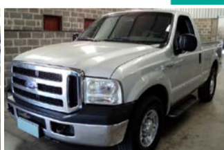
F-250 XLT SUPER DUTY DIESEL ANO 2011