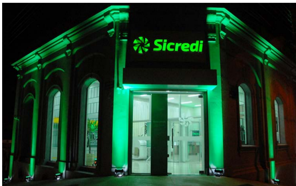
Agência oferece estrutura completa com todos os produtos e serviços da instituição financeira