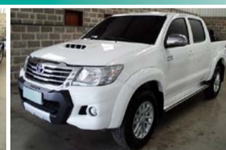
HILLUX TOP SRV AUTOMATICA ANO 2015