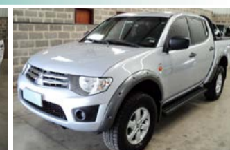
L200 TRITON MECANICA 4X4 ANO 2013