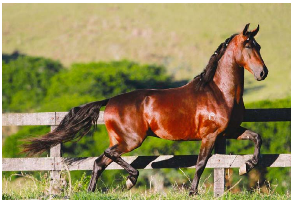
Mangalarga é um cavalo extremamente dócil e funcional

É a mais importante e maior mostra do cavalo Mangalarga, momento de avaliar e selecionar os melhores cavalos da raça do país em competições acirradas, de alto nível técnico e qualidade funcional indiscutível. Estão programados três leilões durante o evento, com animais para quem quer iniciar a criação