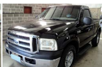
F-250 XLT L DIESEL ANO 1999