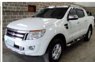
RANGER XLT LIMITED AUTOM. 2014