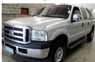
F-250 XLT C. DUPLA MAXX POWER 4.4 2009