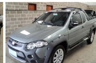
STRADA ADVENTURE C. EST. ANO 2016