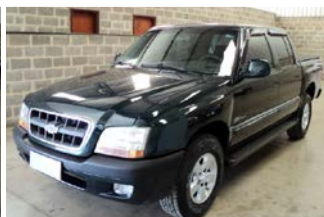
S-10 DELUXE 4X4 ANO 2001