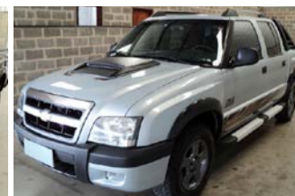
S-10 RODEIO FLEX ANO 2011