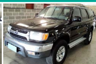
HILLUX SW-4 3.0 4X4 MEC. ANO 1998