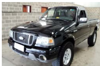
RANGER XL 3.0 4X4 ANO 2007