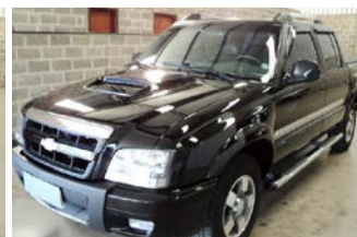
S-10 DELUXE 4X4 DIESEL ANO 2011