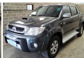
HILLUX SRV 3.0 4X4 AUTOM. ANO 2010