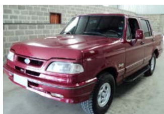
F-1000 XK DIESEL ANO 95