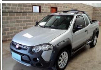
STRADA ADVENTURA ANO 2014