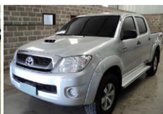
HILLUX SR 3.0 MECANICA ANO 2011