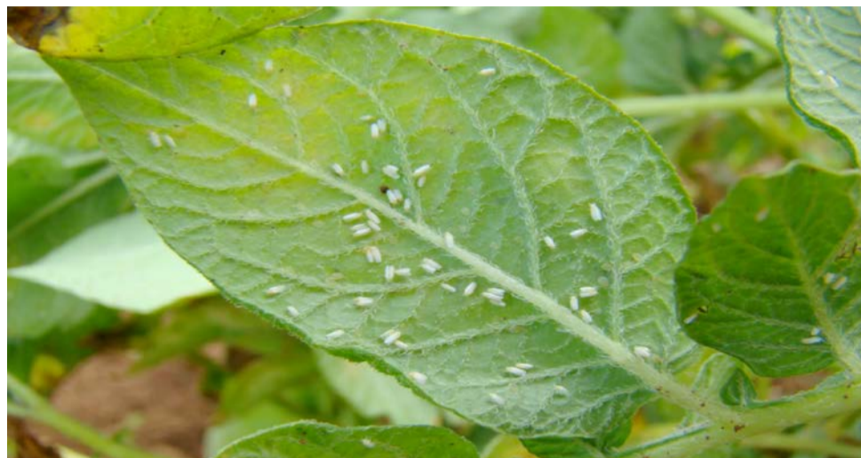
Alta infestação do pequeno inseto é facilmente visto sob as folhas.

com os vírus que ele transmite. A Associação dos Bataticultores da Região de Vargem Grande do Sul (ABVGS) e a Associação Brasileira da Batata (ABBA) já deram um passo colaborando