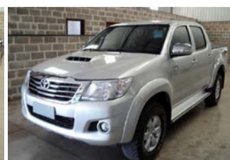
HILLUX SRV 3.0 4X4 AUTOM. ANO 2013