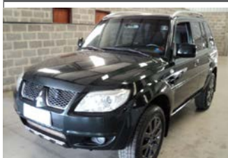
PAJERO TR-4 4X4 FLEX ANO 2011