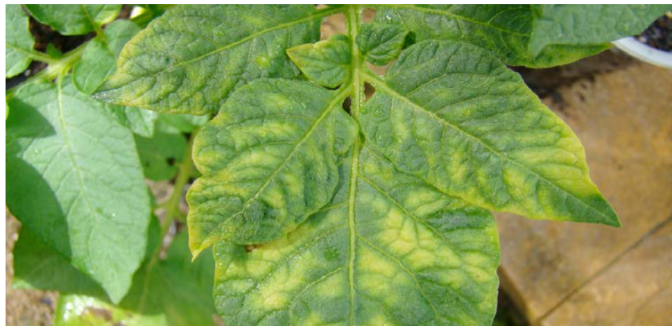
Sintomas de mosaico deformante ( Geminivirus ) em variedade Atlantic

No momento temos mais perguntas que respostas, por isto, é importante o papel das associações estabelecer contato com pesquisadores que estão trabalhando com o inseto e