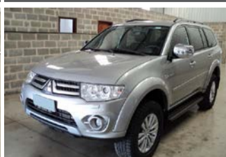
PAJERO FULL AUTOMATIC 2016