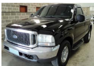
F-250 XLT DIESEL 2005