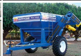
TRANSBORDO TCA-10500 ANO 2016