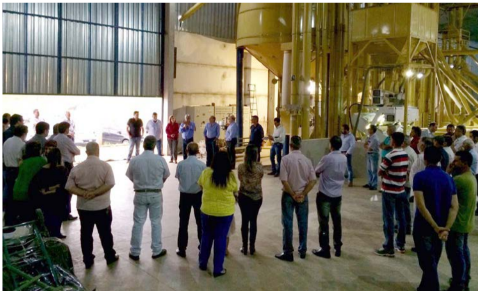
Os novos equipamentos adquiridos com verba do Projeto Microbacias II irão garantir maior qualidade no café produzido

alcançado por eles. Os maiores são mais valiosos. Essa separação é feita pelo equipamento entregue via Microbacias II e resulta em diferentes fileiras de sacas no chão do galpão. Se não houvesse essa diferenciação dos grãos mais caros, o café seria vendido a um preço abaixo do que pode ser alcançado. Isso significa menos lucro para o homem do campo.