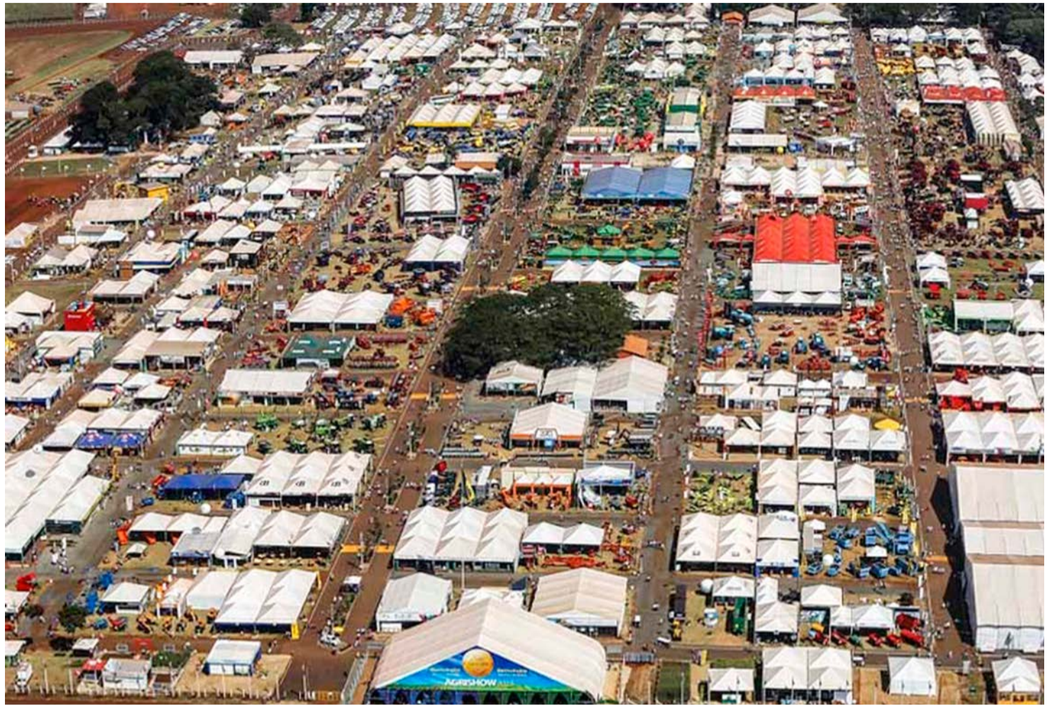
Agrishow é considerada uma "vitrine tecnológica" para o agronegócio brasileiro

Conhecida como uma das maiores e mais completas feiras deste segmento no mundo, a Agrishow já tem 90% de seus contratos assinados. Além de contar com marcas nacionais, estarão também presentes empresas da China, Turquia, Alemanha, Estados Unidos, Finlândia, Itália e Espanha. Assim, será possível conhecer novidades exclusivas em termos de máquinas, implementos agrícolas, sistemas de