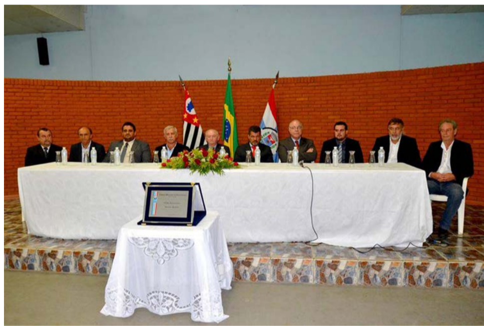
Autoridades de Divinolândia e região acompanharam entrega da homenagem

em poder colaborar com recursos e ostentar este título. Espero estar a altura da confiança dos vereadores e cidadãos divinolandenses", disse, emocionado com a homenagem.