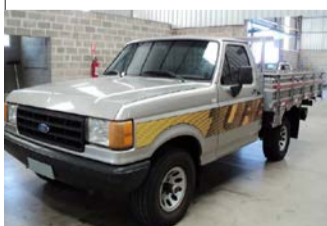
F-1000 TURBO 4X4 ANO 95