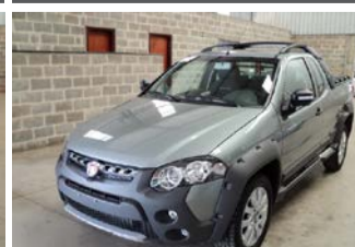
STRADA ADVENTURE C.EST ANO 2016