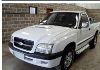
S-10 COLINA 4X4 ANO 2008