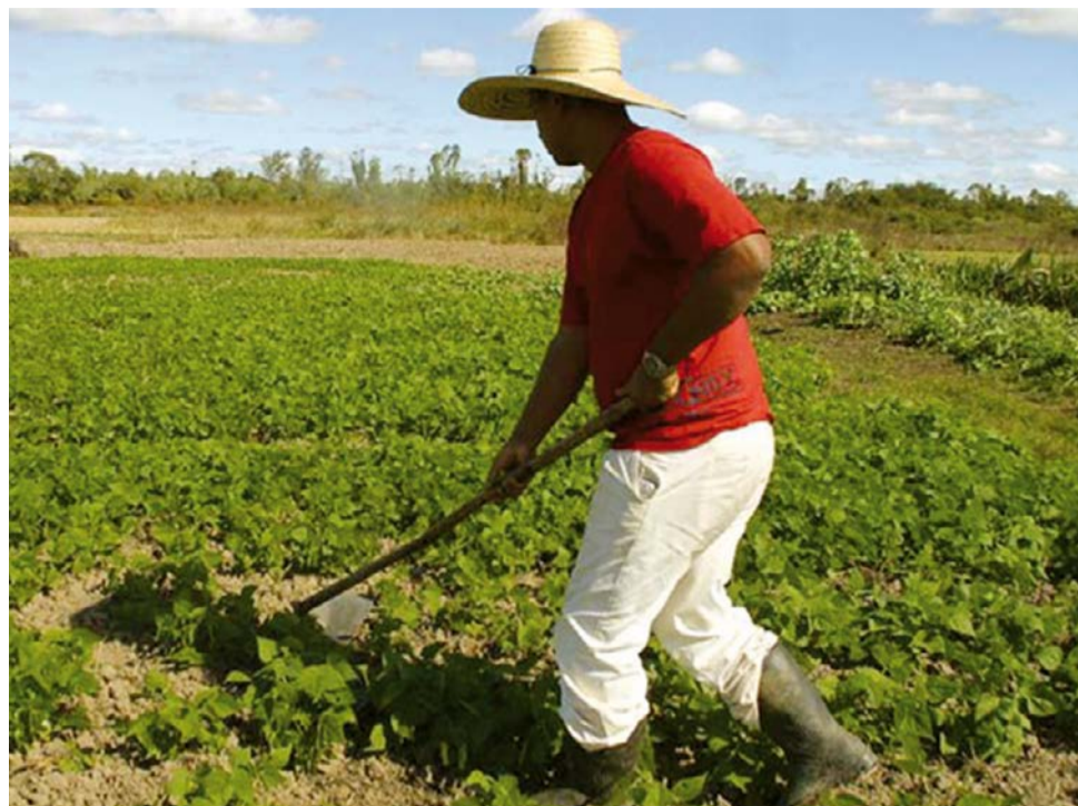
No Estado de São Paulo, 61,7% de áreas rurais já estão regulares

De acordo com o Levantamento Censitário das Unidades de Produção Agropecuária do Estado de São Paulo (Lupa), da Secretaria de Agricultura, a área cadastrável paulista é de 20.5045.107 hectares. Para o secretário de Agricultura e Abastecimento do Estado de São Paulo, Arnaldo Jardim, a ferramenta é importante para auxiliar no planejamento do imóvel rural e na recuperação de áreas degradadas no Estado.