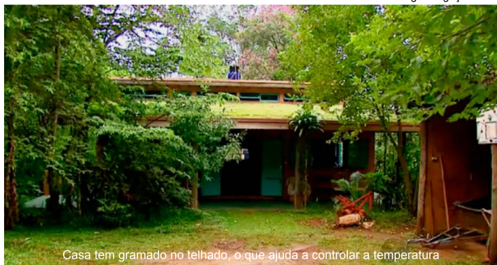
Casa tem gramado no telhado, o que ajuda a controlar a temperatura

Um sítio de Caconde é exemplo de sustentabilidade e preservação do meio ambiente. O proprietário, um agrônomo, mantém o equilíbrio reaproveitando o que a natureza oferece sem agredi-la. O local tem telhado de grama e as paredes pintadas com terra.