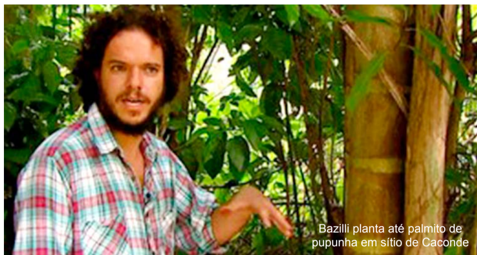
Bazilli planta até palmito de pupunha em sítio de Caconde