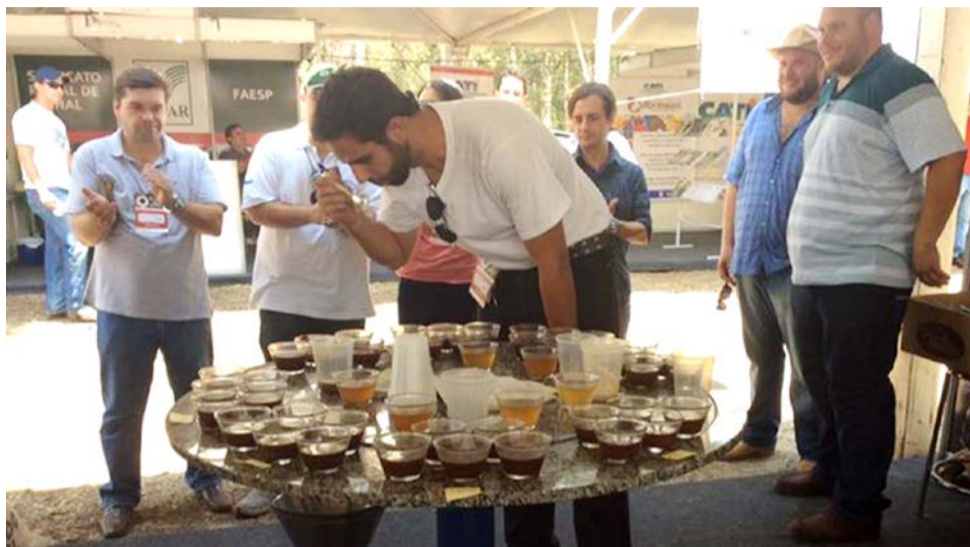
Amostras de café foram rigorosamente analisadas

Evento marcou o encerramento da Feira. Amostras foram analisadas e cafeicultores receberam certificados