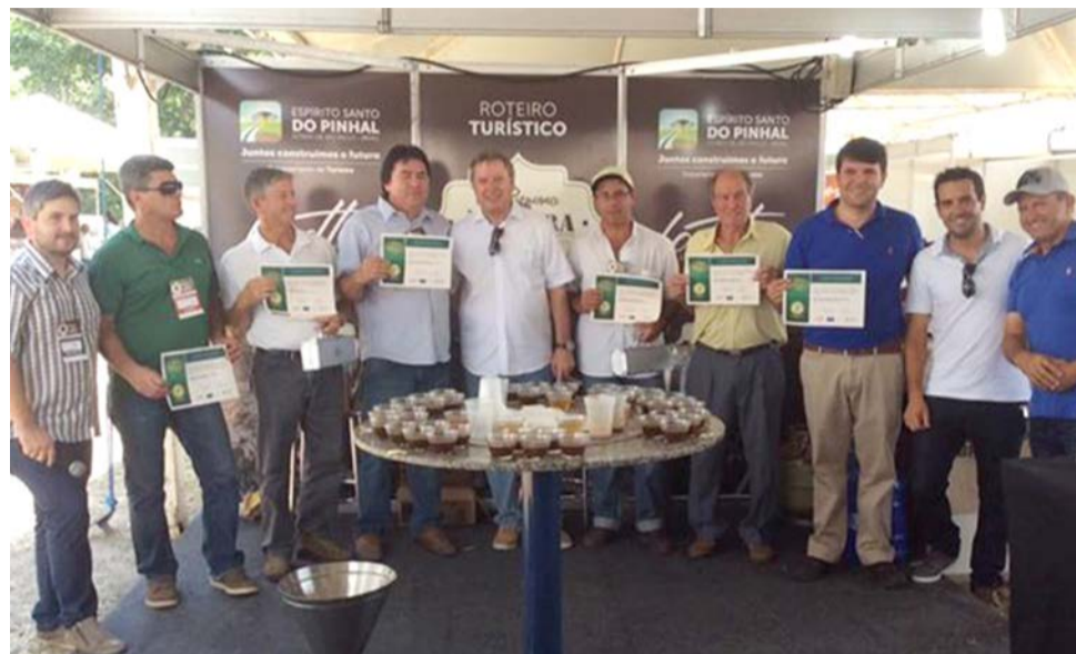
Cafeicultores têm se destacado pela qualidade de sua produção

A 3ª Feira do Agronegócio Café terminou no sábado, dia 17 de outubro, com a final do Concurso de Qualidade do Café Santa Luzia e Região. Na ocasião foram apurados os resultados e, em seguida, entregue o certificado aos produtores ganhadores.