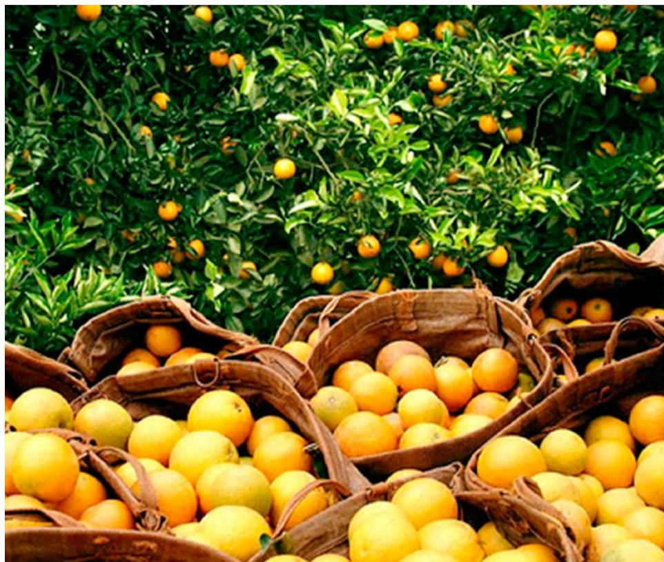
Estado de São Paulo tem um pomar de 183.783.180 plantas cítricas

Para a doença greening ainda não existe tratamento curativo, nem variedade resistente. Quando contaminadas, as plantas novas não chegam a produzir e as plantas adultas tornam-se improdutivas dentro de 2 a 5 anos. Como informa o engenheiro