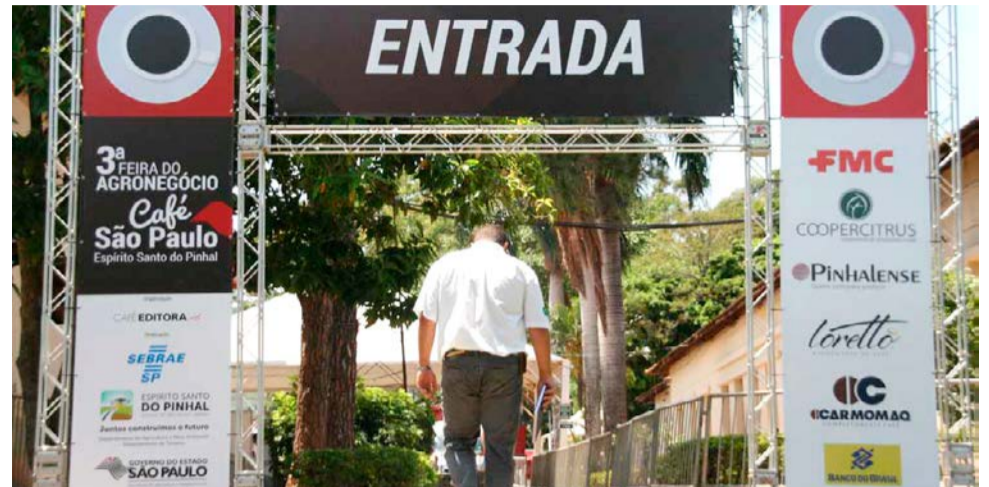
3ª Feira do Agronegócio Café foi realizada entre dias 15 a 17 de outubro