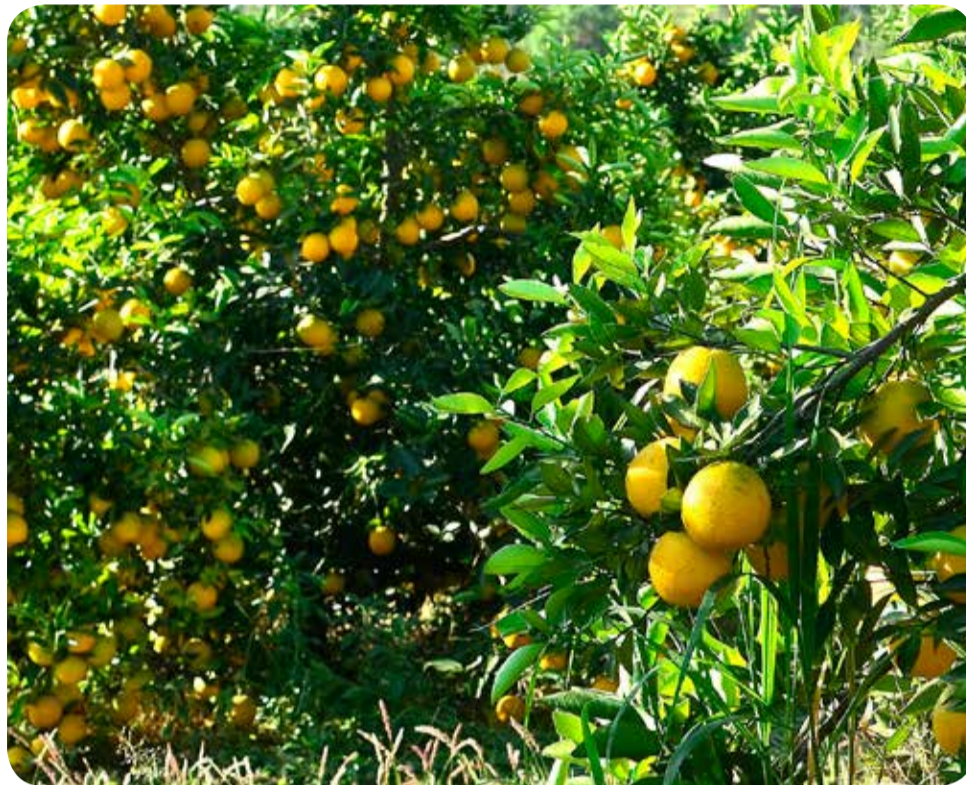
Alto custo da produção, a dificuldade para comercializar a safra e as pragas que vêm prejudicando as lavouras têm influenciado produtores a mudar de atividade

Os produtores são obrigados a encaminhar à Defesa Agropecuária documentos com informações sobre as lavouras. Foram recebidos 12.592 relatórios de greening e cancro cítrico, dando conta de que no Estado foram inspecionadas 198,2 milhões de plantas cítricas. Mesmo