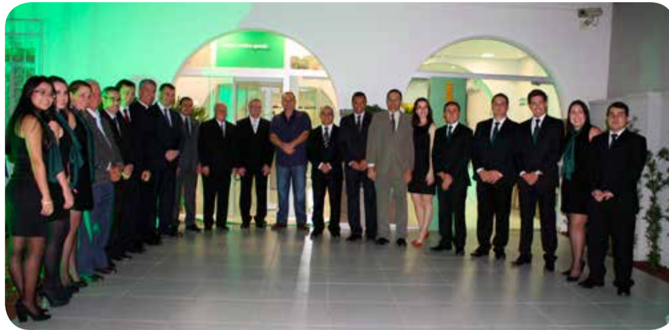
Representantes da Sicredi União PR/SP e autoridades locais marcaram presença na inauguração da unidade

"Portanto, aqui em Vargem Grande do Sul não será diferente. Como uma instituição cooperativa, feita de pessoas, o resultado do trabalho aqui realizado será dos nossos associados", completou emocionado.