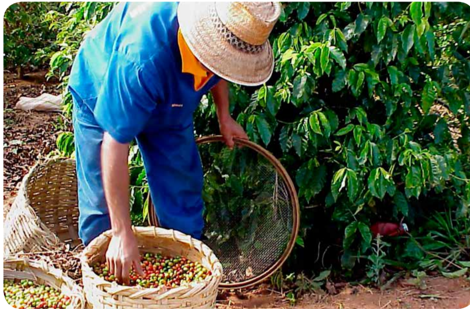
Os produtores começam a se planejar para a safra de 2016

A colheita do café na região de Espírito Santo do Pinhal, divisa de São Paulo com Minas Ge-