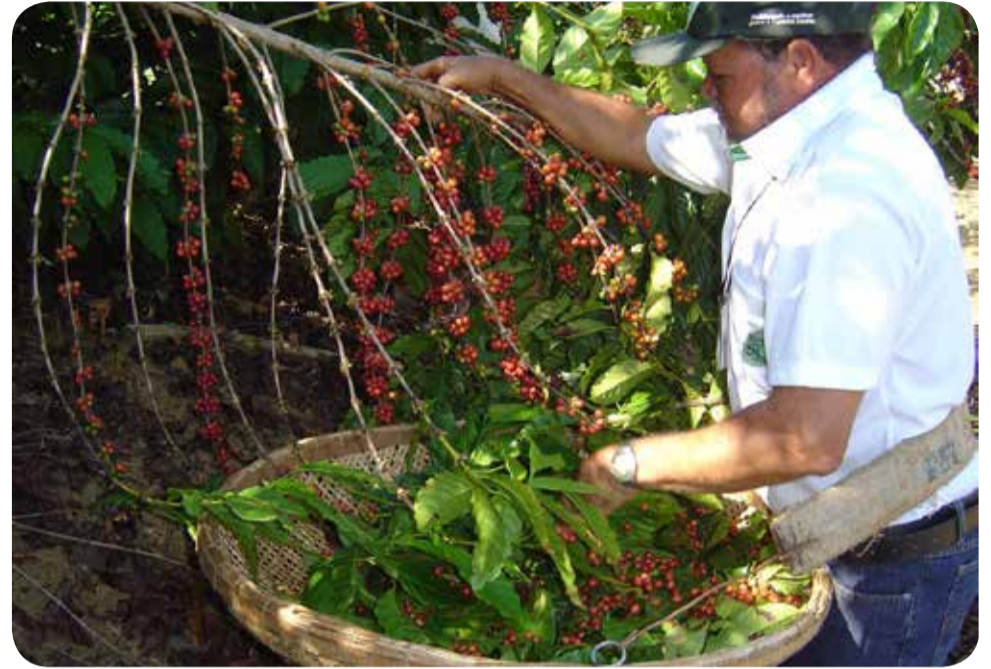
Feira trará palestras visando expandir as perspectivas dos cafeicultores para a comercialização de sua produção

As palestras "Produção de Café de Qualidade", "Mercado