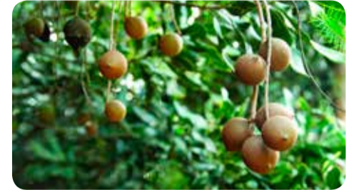
Estiagem retardou o desenvolvimento das árvores

Com o tempo seco, a planta precisa de mais nutrientes, por isso, a adubação está sendo reforçada durante a florada. O processo precisa ser feito antes da época das chuvas para ga-