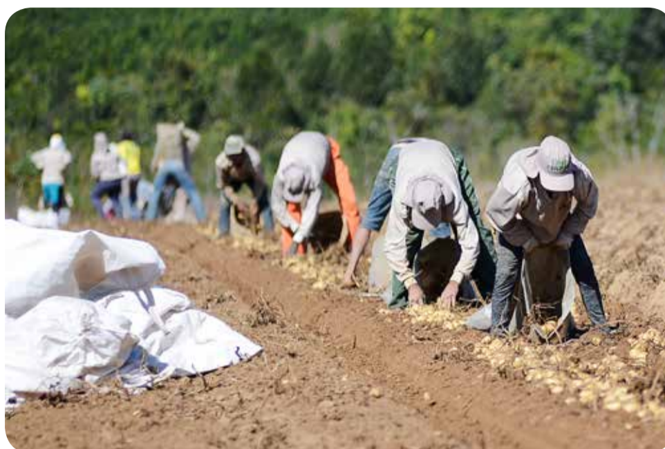
Aproximadamente 60% da área plantada nesta safra já foi colhida

Lenoir explica que esta baixa nos valores se deve a grande oferta de batata no mercado.