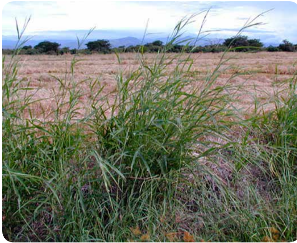
Além de prejudicar o canavial, a planta adulta do camalote tem micro agulhas em suas folhas, o que pode ferir trabalhadores rurais

Em outros estados produtores de cana, como Mato Grosso, Mato Grosso do Sul e Paraná, essa espécie também tem cau-