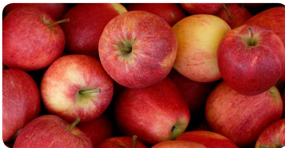
Objetivo é estabelecer normas comuns de boas práticas agrícolas e qualidade do produto in natura

Para receber essa chance, os produtores passaram por uma intensa capacitação que teve início em junho de 2011 e que, ao todo, contempla 57 propriedades. Outras 34 proprieda-