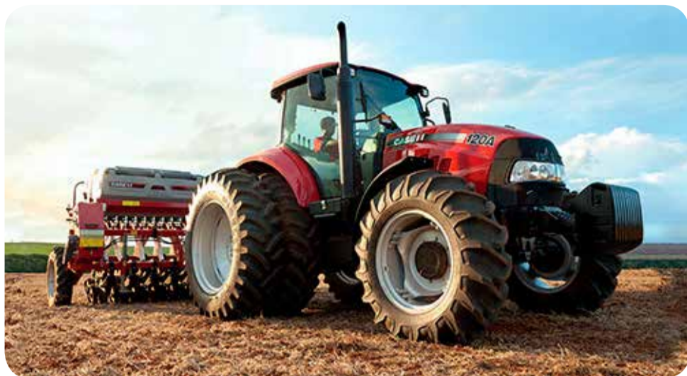
Empresa trabalhará com revenda de máquinas agrícolas novas e usadas, além de peças, prestando ainda serviços de manutenção

Trator Soluções Agrícolas atuará na venda de maquinários e peças, além de prestar os serviços de manutenção