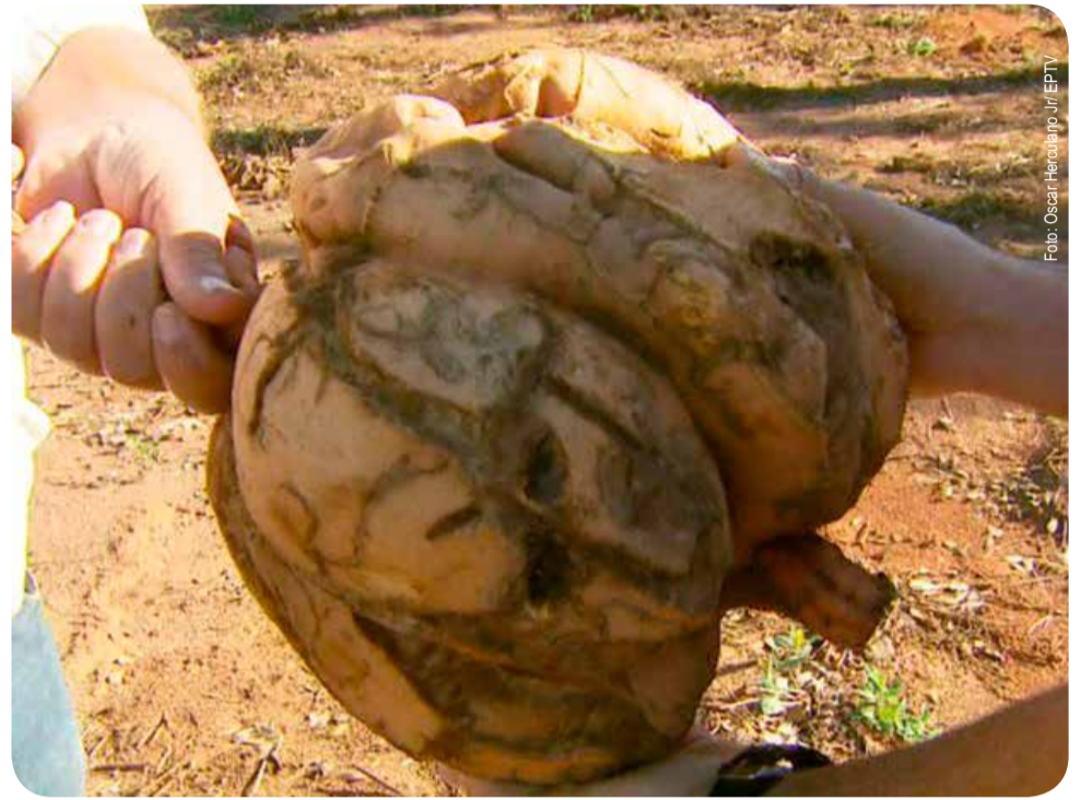
Batata-doce com 9 quilos ganhou destaque na cidade

A batata foi exposta em uma praça da cidade e primeiro despertou a curiosidade das pessoas depois ganhou status de estrela. “Se fosse minha eu ia cozinhar várias vezes ia chamar