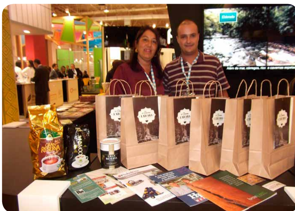
Departamento de Turismo apresentou roteiro turístico para visitantes da feira

Durante o evento, a Prefeitura de Espírito Santo do Pinhal lançou oficialmente o roteiro "Do Genoma à Xícara". A Coopinhal esteve junto ao estande Café com Leite, servindo seus melhores cafés a todos os visitantes e aproveitando a oportunidade para