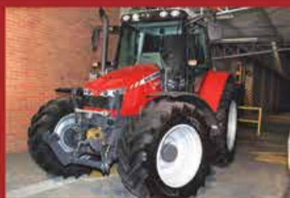
Lançamento | Série Dyna 4