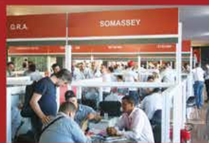
Equipe Somassey na Agrishow 2014

A Somassey participou da 21ª Agrishow - Feira Internacional de Tecnologia Agrícola em Ação, realizada em Ribeirão Preto/SP entre os dias 28 de abril a 02 de maio. Como de costume, a Somassey esteve presente nos stands da Massey Ferguson e Jacto, proporcionando ótimas soluções, condições diferenciadas de negócios e apresentação de novos produtos para aumentar a produtividade no campo.