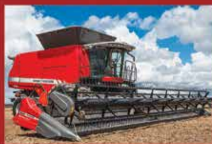
Colheitadeira MF 9895