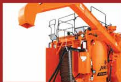
Colhedora de Café - Jacto | KTR 3500