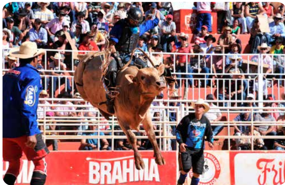
Festa da Batata 2014 traz rodeio e provas de montaria

Para esta edição, a Festa da Batata terá sua abertura com a noite gospel na terça-feira, 22, onde se apresentará o padre Agnaldo José e ainda a banda Oficina G3. Na quarta-feira, 23, se apresentará o cantor Psirico, com seu sucesso "Lepo Lepo". Na quinta-feira, 24, é a vez da dupla Humberto e Ronaldo animar o evento. Na sexta-feira, 25, se apresentará o cantor Gustavo Lima e no sábado, 26, a dupla Guilherme e Santiago. Além destes, ainda há outras atrações que a Comissão Orga-