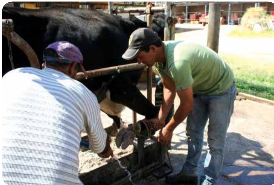
Aula Prática de casqueamento em bovinos ministrada pelo SENAR

Os cursos que serão oferecidos em Vargem são voltados para os seguintes temas: aproveitamento de alimentos; artefatos artesanais para datas comemorativas; bovinocultura de corte (produção de silagem) e de leite (aplicação de medicamentos e vacinas, casqueamento e produção