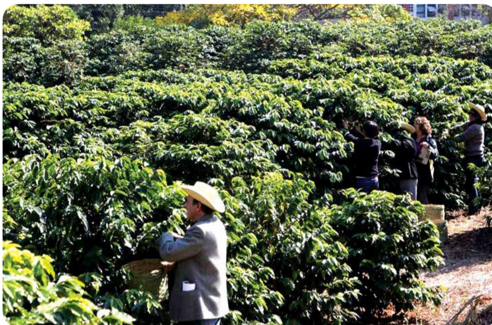
Perspectiva de safra menor já mexeu com os preços

Empresas e consultorias especializadas já realizaram levantamentos e acreditam em uma safra menor do que as previsões iniciais. A exportadora Terra Forte projeta perda de 11%, com uma safra de 47 milhões de sacas. A consultoria Safras&Mercado