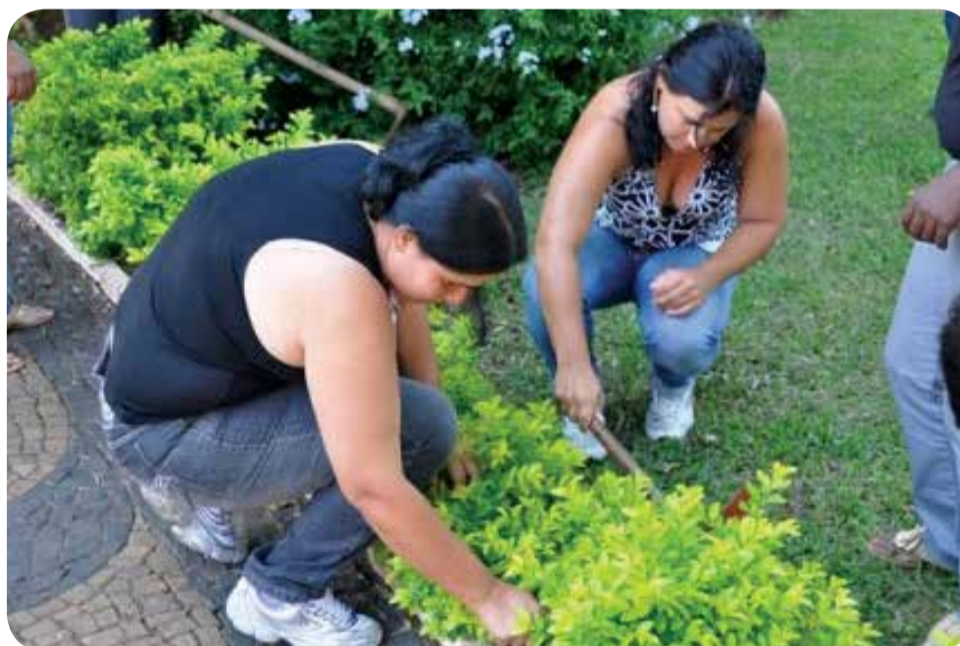
Também serão oferecidos cursos na área de jardinagem

de feno); café na gastronomia; caminhada campestre; cavalgada rural; cerqueiro (cerca elétrica); culinária regional; doma racional; equideocultura (aplicação de medicamentos e vacinas, casqueamento e ferrageamento); higiene, manipulação e produção de alimentos minimamente processados; jardineiro (implantação de jardins, condução, manutenção e reforma); monitoria na propriedade de turismo no meio rural; passeio ciclístico; prevenção e combate a incêndios no campo (noções básicas); processamento artesanal de produtos de higiene e limpeza; promoção e comercialização de turismo no meio rural; resgate das tradições culturais no meio rural; rédeas e turismo pedagógico no meio rural.