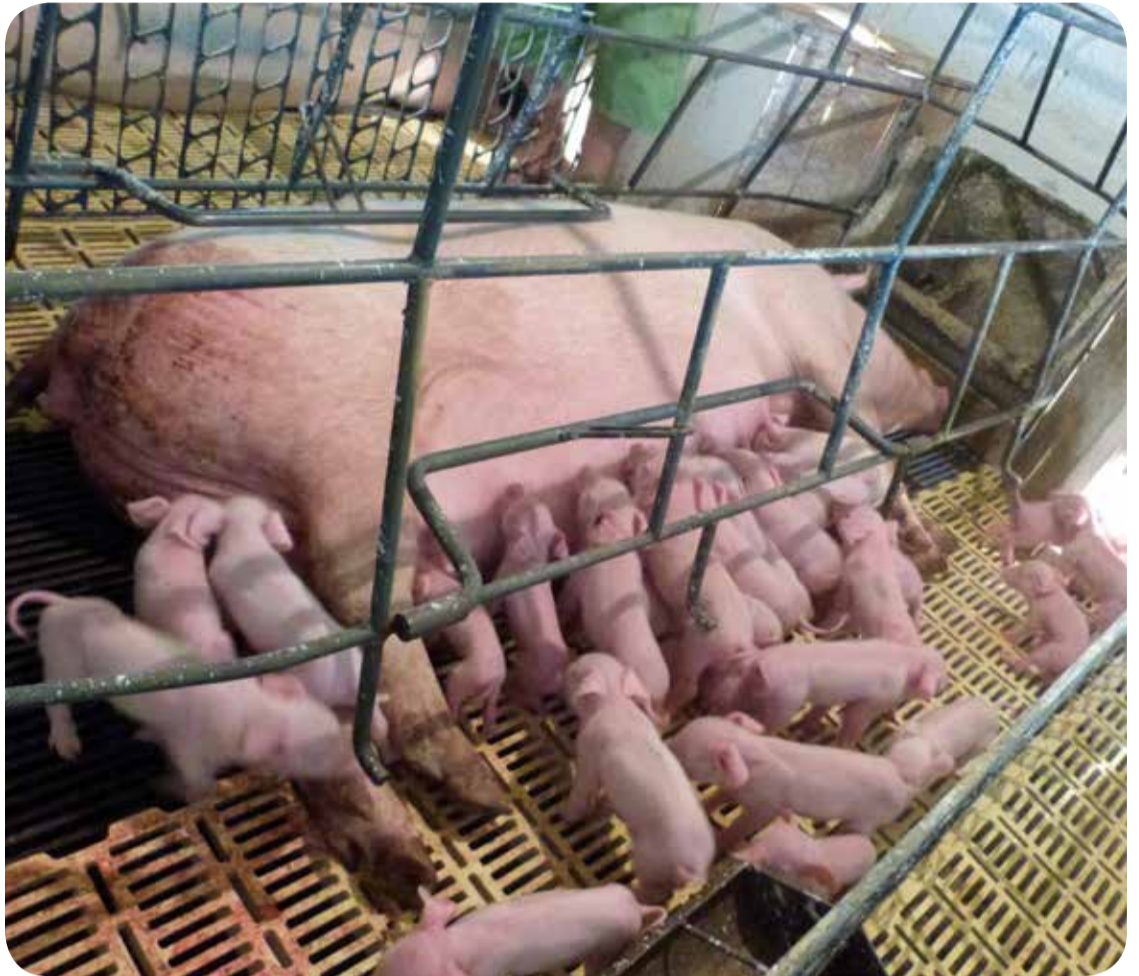
Ao nascerem, os leitões estão totalmente desprotegidos e suscetíveis aos agentes causadores de doenças como a diarreia neonatal