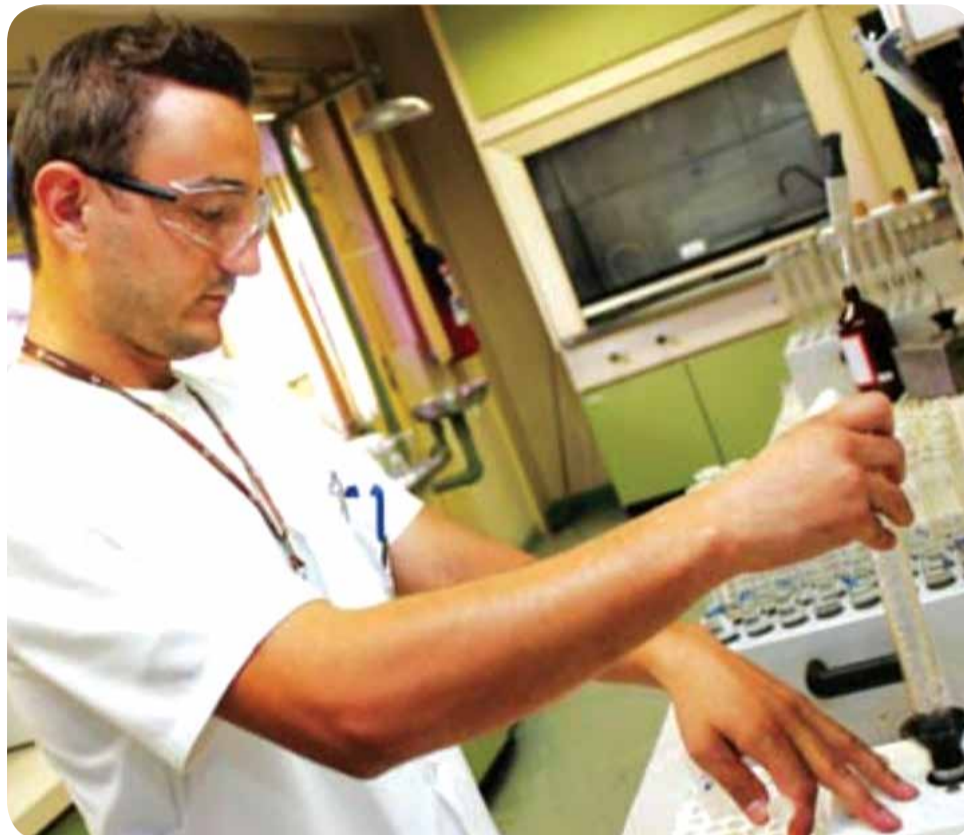
Laboratório da cooperativa foi o único a conquistar 100% de assertividade entre os 135 avaliados