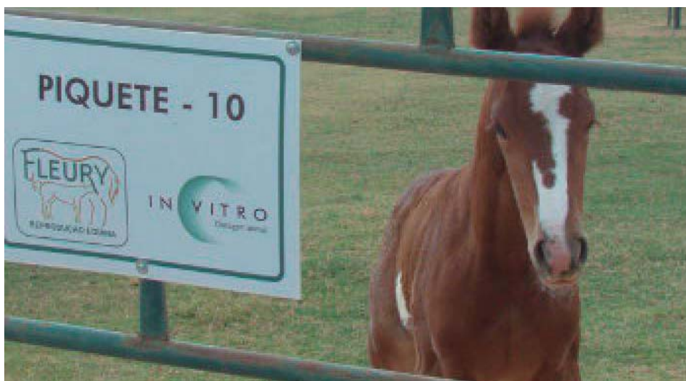
In Vitro do Brasil foi a responsável pela clonagem

mundo a realizar clones de bovinos e, a partir de agora, de equinos.