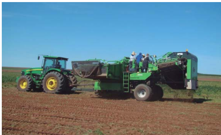
Colheita mecanizada em Vargem Grande do Sul em 2012

No início da safra, mesmo com as produções baixas, o preço permaneceu bem abaixo do custo de produção. Talvez os atacadistas não acreditassem que a safra da nossa região fosse tão ruim conforme foi e exerciam uma forte pressão para que os preços mantivessem baixo. Felizmente a pequena oferta fez com que os preços reagissem e o suficiente para remunerar o produtor, mesmo com quebra da produção.