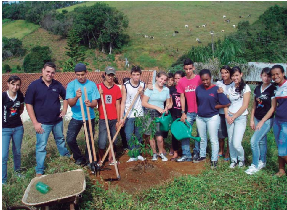
Equipe de alunos do programa Jovem Aprendiz Rural

Quando se aposta no desenvolvimento do associativismo e no fortalecimento da agricultura de produção familiar muita coisa pode ser mudada