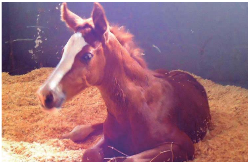
Animal nasceu no dia 10 de setembro na sede a empresa

A In Vitro do Brasil contou com o trabalho de uma equipe de 15 pessoas e hoje é a terceira empresa comercial no