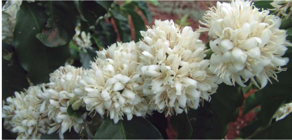
"Até o momento, as condições meteorológicas e o armazenamento de água no solo estão mais favoráveis para a florada do que nos anos de 2011 e 2012", avalia Éder Ribeiro dos Santos

Apesar das boas condições, Ribeiro dos Santos alerta que a produção do café tem o fator da bialidade, ou seja, carga alta e carga baixa alternadas. Por ser