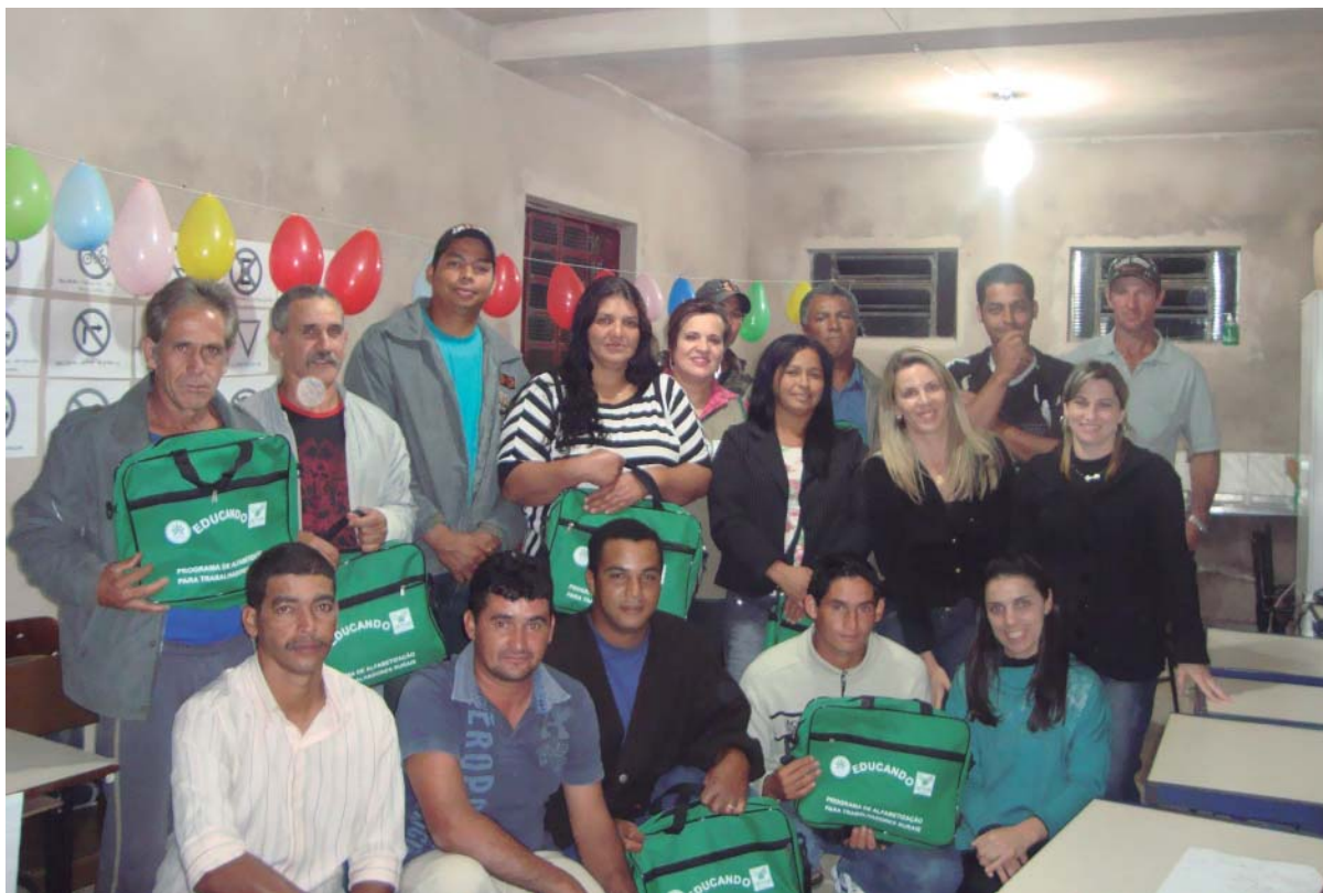
Alunos do programa de alfabetização