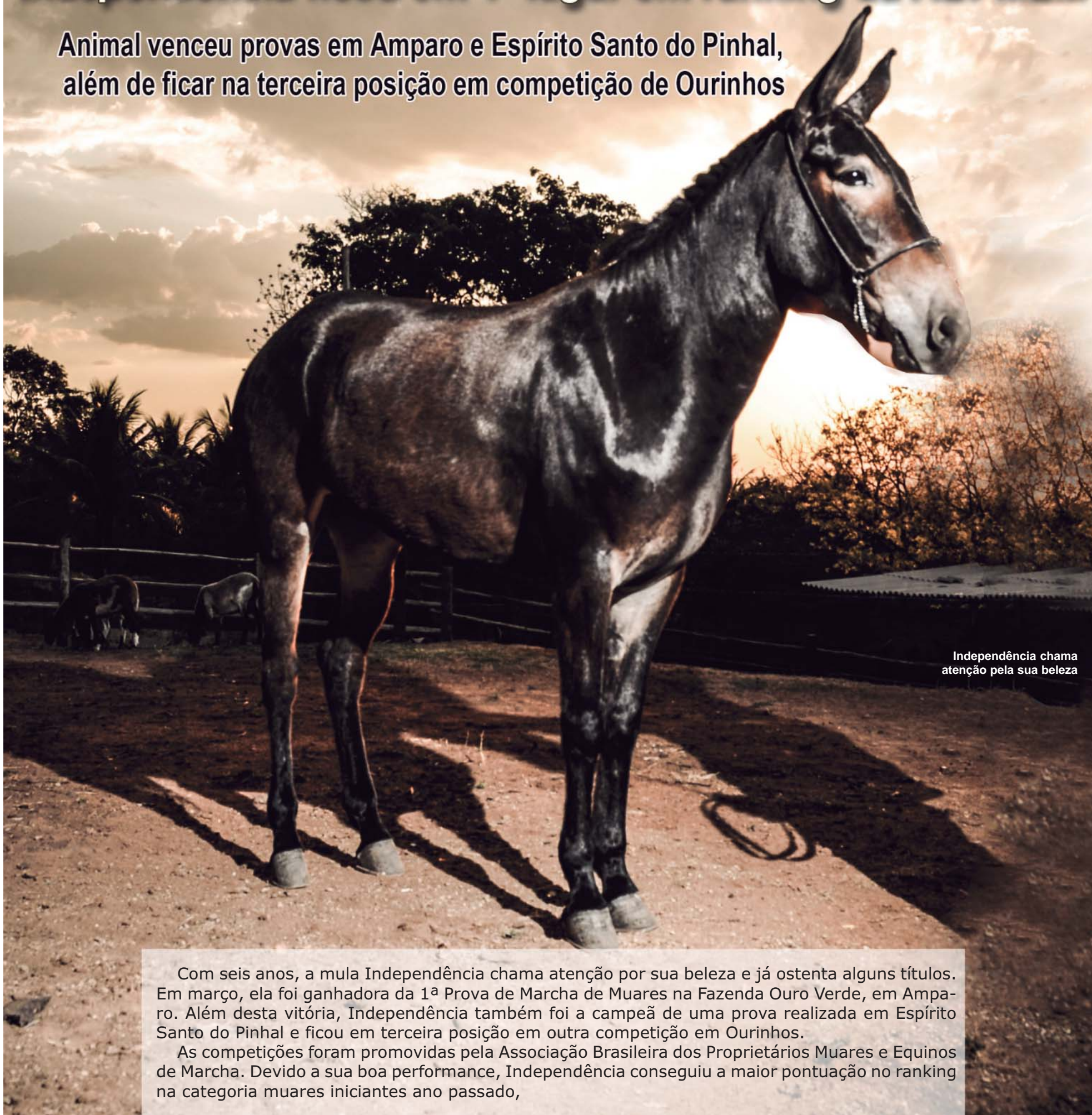
Independência chama atenção pela sua beleza

Animal venceu provas em Amparo e Espírito Santo do Pinhal, além de ficar na terceira posição em competição de Ourinhos