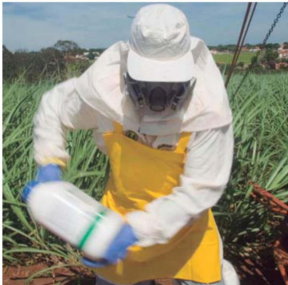
Daher prevê o crescimento de até 8% para o mercado de agrotóxicos

Daher prevê crescimento de até 8% para o mercado de agrotóxicos, que faturou US$ 8,4 bilhões em 2011 no Brasil. As quatorze empresas associadas à Andef trabalham com perspectiva de 6%. De qualquer forma, há uma re- visão sobre as expectativas iniciais de 2012, que eram de 3% a 5% - o Sindicato Nacional da Indústria de Produtos para Defesa Agrícola (Sindag) ainda considera estes números. "Mesmo com perda de 20% no câmbio, vamos ter um ano fácil", regozija-se Daher.