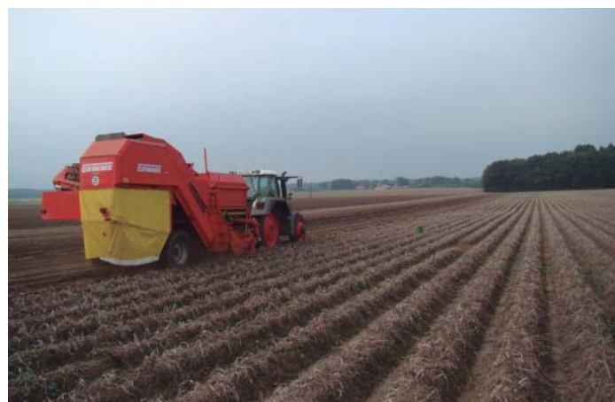
Colheita mecanizada em 2006 na Alemanha

sem a produção do básico, o alimento. Infelizmente, o bom resultado desta safra foi devido a eventualidade climática, ou seja, não foi nenhuma ação dos produtores. O cenário previsto era de preços baixos, pois nossa região aumentou a área plantada em mais de 10% em relação a 2011. Pelas condições desfavoráveis do clima, a produtividade caiu cerca de 35% se compararmos com o ano anterior. Isto significa que não há garantia de que o preço da batata se mantenha nestes patamares que proporciona o produtor um resultado positivo.