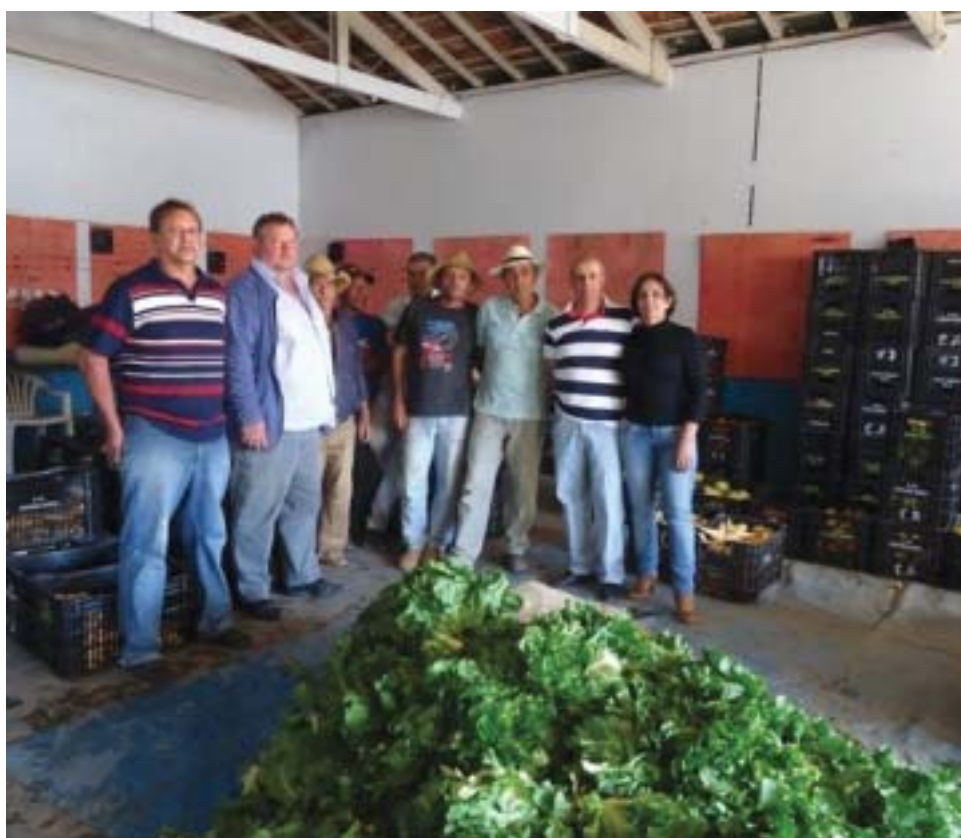
Alimentos produzidos são repassados a várias entidades