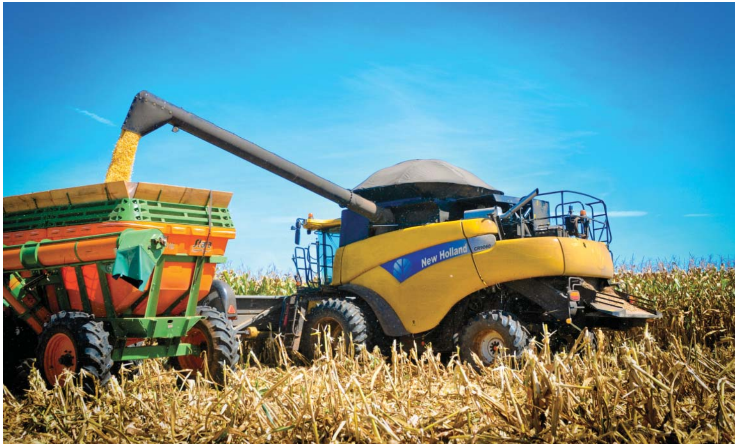
De acordo com MAPA, Brasil tem o maior e mais confortável estoque de milho da história

Diante desse cenário favorável, o governo vem gerenciando ações para escoar os grãos das regiões produtoras para as deficitárias