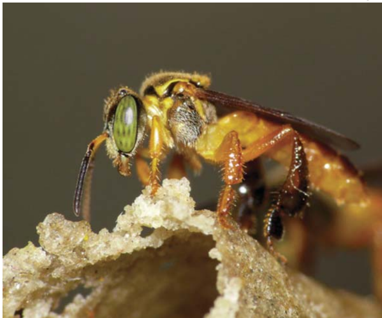
Estudos científicos têm apontado substâncias como causadoras da morte de abelhas em diferentes regiões do país