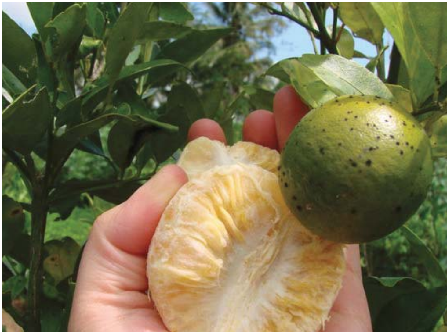
Entre os meses de janeiro a junho, a Secretaria inspecionou 234,4 milhões de plantas. Destas 13,8 milhões precisaram ser arrancadas