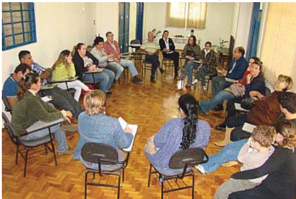
Expositores da II Feira Agroindustrial se reuniram em julho

Considerado um dos maiores eventos da região, a Festa da Jabuticaba recebeu no ano passado cerca de 40 mil pessoas