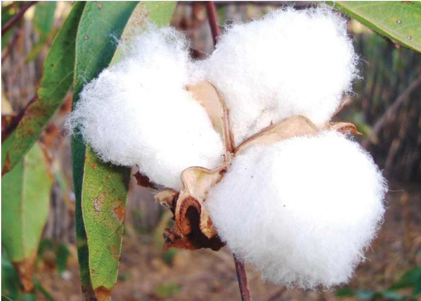
70% da safra que será colhida daqui a dois meses, já foi comercializada a um preço 33% menor

Área plantada no país teve crescimento de 64% de uma safra para outra