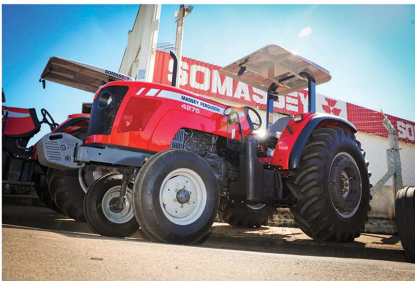
Trator MF 4275 (4x2), o mais vendido da história no Brasil.

A Somassey consolida cada vez mais a liderança de mercado da marca Massey Ferguson e preza pela excelência no fornecimento e atendimento, trazendo toda a tecnologia de tratores, colheitadeiras e implementos agrícolas ao alcance do produtor.