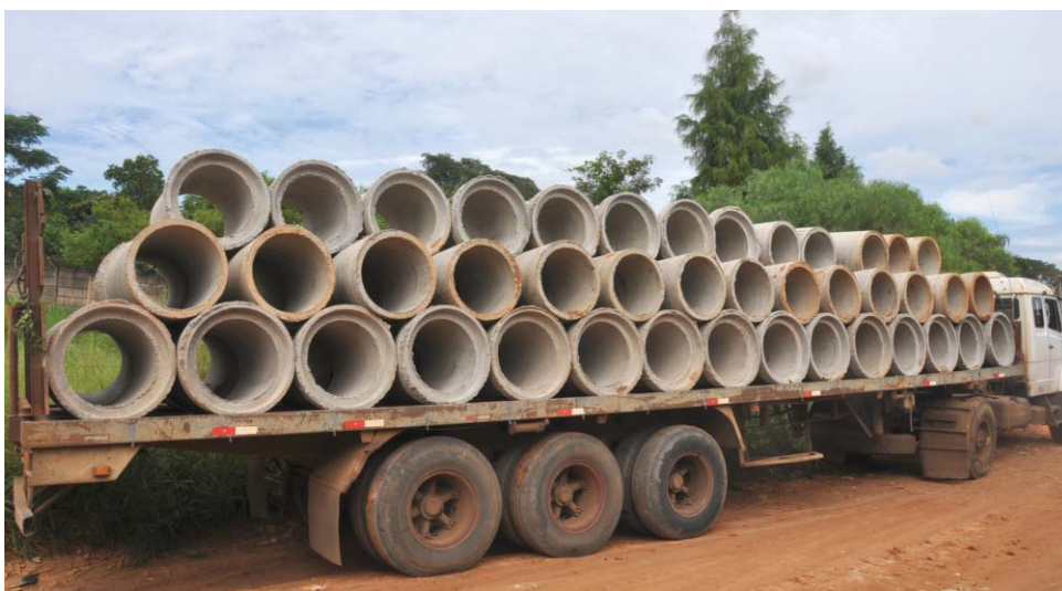
Prefeitura pretende acabar com a erosão que atinge a Estrada das Perobeiras