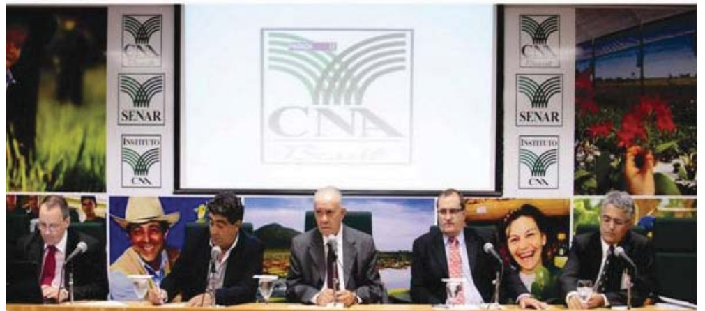
ABCS se reuniu com entidades estaduais de suinocultores e avicultores, além de representantes das Federações de Agricultura e Pecuária para discutir apoio ao projeto de lei

Nova série de tratores 7J John Deere. Mais completa, mais potente e com a confiabilidade da tecnologia John Deere.