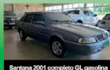
Santana 2001 completo GL gasolina