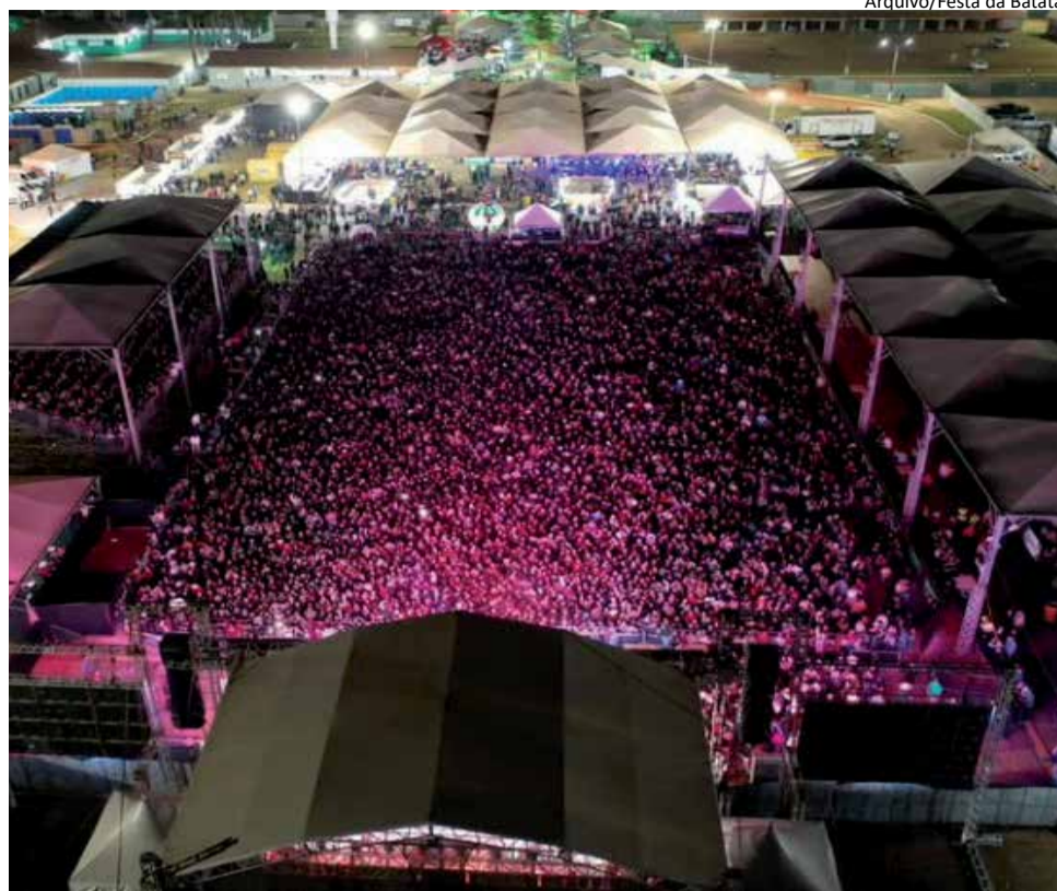
Festa da Batata: evento é uma das festividades mais tradicionais de Vargem Grande do Sul