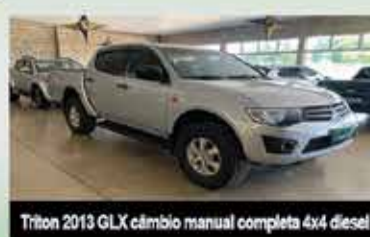
Triton 2013 GLX câmbio manual completa 4x4 diesel