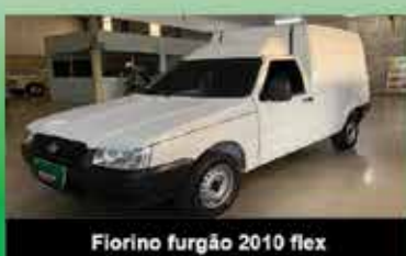
Fiorino furgão 2010 flex