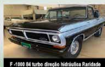
F-1000 84 turbo direção hidráulica Raridade