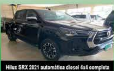
Hilux SRX 2021 automática diesel 4x4 completa