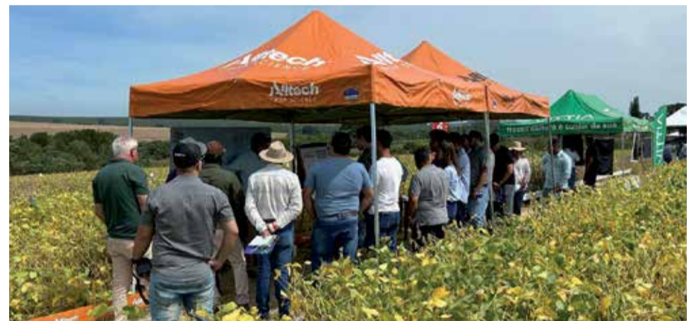
Programação: produtores rurais conheceram produtos aplicados nas áreas de testagem de soja

Nesta edição, a III Vitrine Tecnológica teve a participação das empresas Alltech Crop Science, Corteva Agriscience, Agro Life Bio, Vittia e Green Has Group. Além das apresentações nas áreas de testagem, o público presente ainda teve a chance de conferir as palestras com pesquisadores reno-