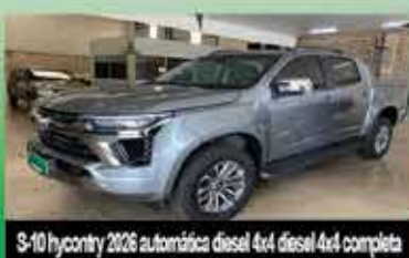
3-10 hycontry 2026 automática diesel 4x4 diesel 4x4 completa