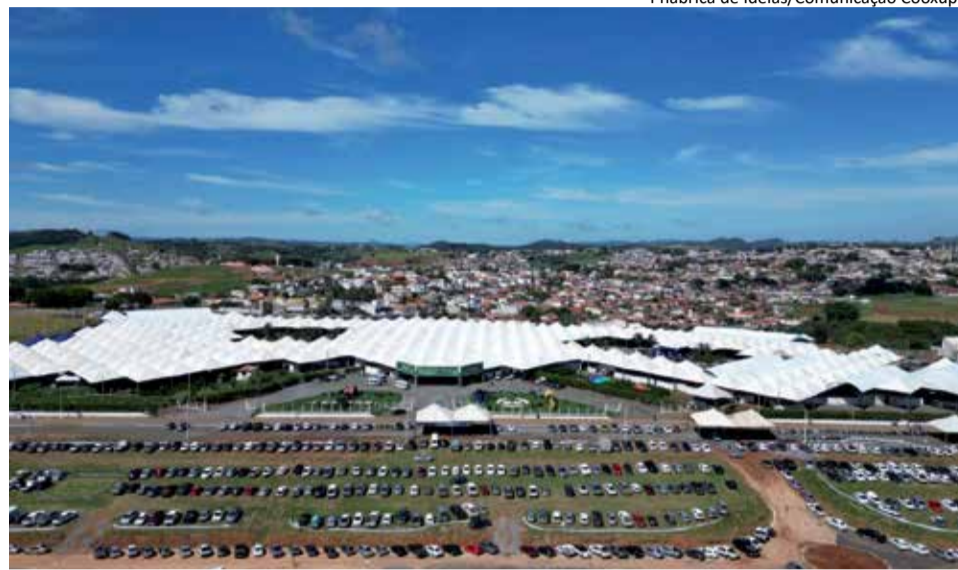
Femagri: evento será realizado de 18 a 20 de março, das 8h às 18h, na Avenida Vereador Nelson Elias, no bairro Japy, em Guaxupé

Com o tema “Tradição e Inovação: Gestão Responsável, Cooperativismo Forte, Futuro de Oportunidades” e com foco em inovação, tecnologia e geração de negócios no campo, a Femagri chega com uma série de novidades voltadas à produtividade e à eficiência das propriedades rurais. Entre os desta-