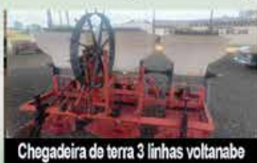
Chegadeira de terra 3 linhas voltanabe