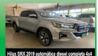
Hilux SRX 2019 automática diesel completa 4x4