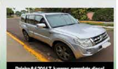
Pajero 2014 7 lugares completa diesel