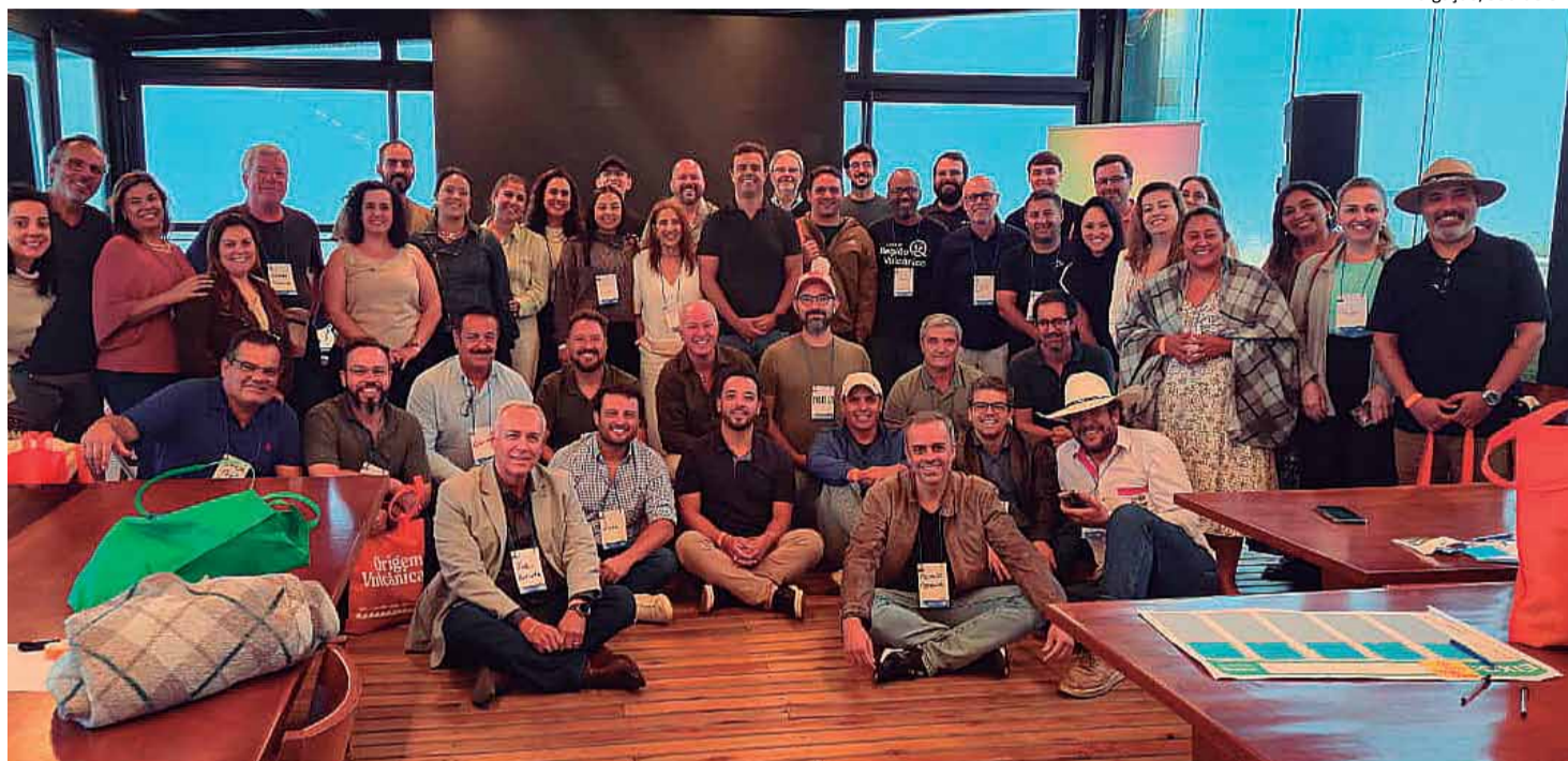
União: encontro reuniu representantes de 14 municípios dos estados de São Paulo e Minas Gerais

Os municípios paulistas que participam são: Águas da Prata, Caconde, Divinolândia, São Sebastião da Gramma e São João da Boa Vista. Já as cidades mineiras: Andradas, Bandeira do Sul, Botelhos, Poços de Caldas, Ibitiúra de Minas, Cabo Verde, Campestre, Caldas e Santa Rita de Caldas.