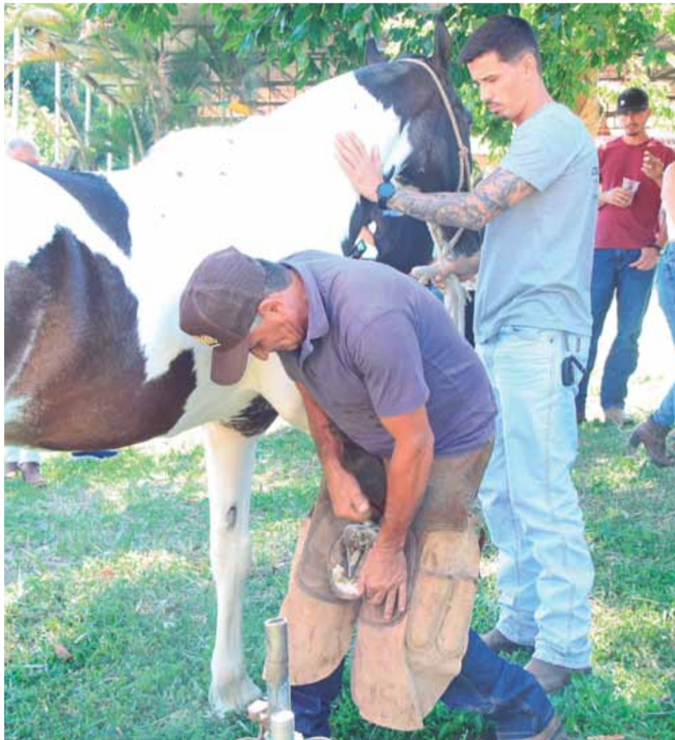
Workshop: programação trouxe demonstrações práticas de casqueamento e ferrageamento, focadas nas técnicas corretas de manejo e cuidados com os cascos

rias. Na ocasião, a Defesa Agropecuária explicou os procedimentos de cadastros e emissão da Guia de Transporte Animal (GTA) para participação em eventos equestres.