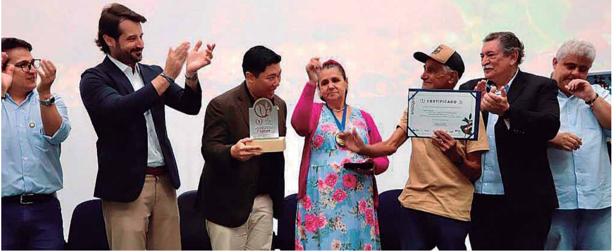
Solenidade: SAA premiou as 50 melhores produções paulistas durante a cerimônia oficial do 24º Concurso Estadual Qualidade do Café de São Paulo