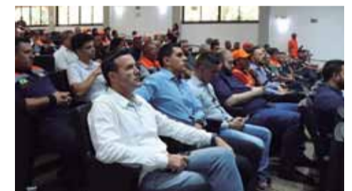
Mobilização: encontro teve a participação de coordenadores municipais da Defesa Civil de 32 cidades, além de autoridades e representantes de órgãos integrantes da Operação SP Sem Fogo

No período da tarde foi realizada uma reunião técnica com produtores rurais e representantes das instituições parceiras, com o objetivo de alinhar estratégias conjuntas de enfrentamento aos incêndios florestais. O encontro contou