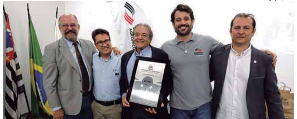
Certificação: Fazenda Colorado, de Araras, foi a primeira a receber o novo selo lançado pela Secretaria de Agricultura e Abastecimento