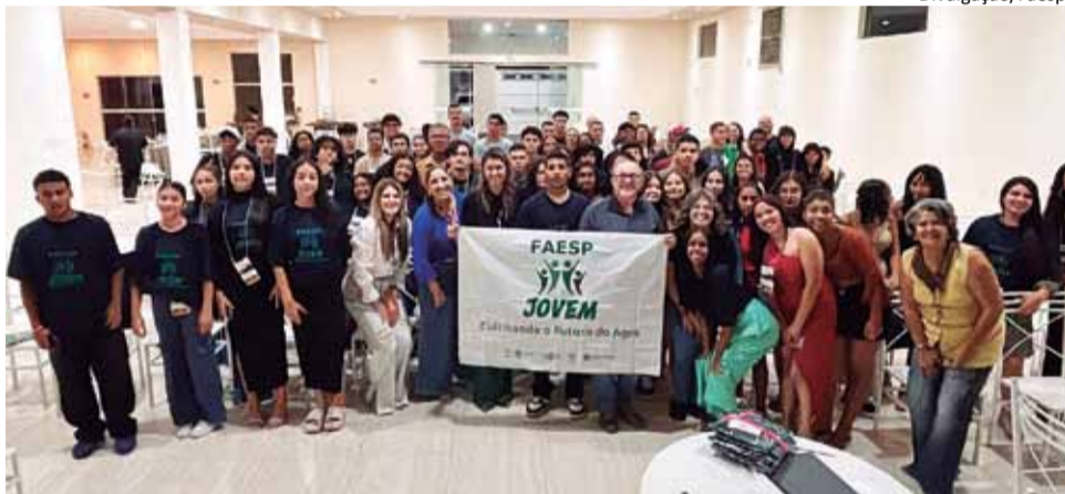
Atividade: encontro reuniu mais de 50 jovens em uma noite marcada por troca de experiências, inspiração e reflexões sobre o futuro do agronegócio