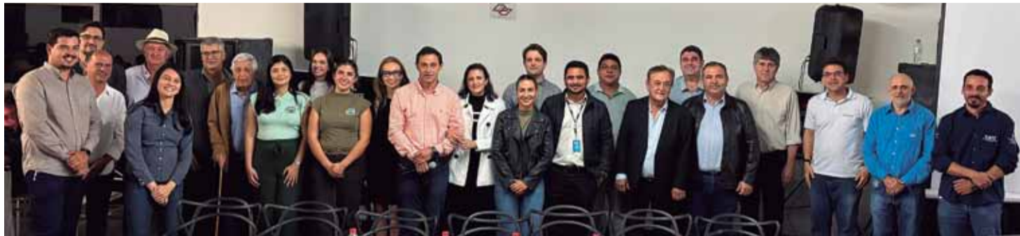
Encontro: conquistas obtidas no setor da cafeicultura em Caconde foram acompanhadas por lideranças locais e regionais

O Sindicato Rural de Caconde, entidade gestora do programa na região, foi contemplado no edital de fomento, recebendo recursos destinados à compra dos equipamentos. O uso coletivo das máquinas permitirá reduzir custos, fa-