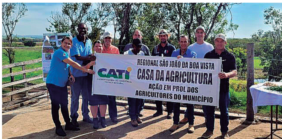
Dedicação: encontro foi promovido pela CATI Regional São João da Boa Vista

A programação teve início com um café da manhã oferecido pelos Laticínios Coqueiros e Leite Fazenda Bela Vista, durante o qual os produtores puderam entregar amostras de leite e volumosos para análise no trailer da Caravana do Giro do Leite, que contou