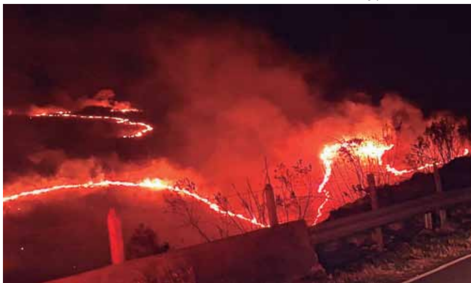
Queimada: fogo atingiu grandes proporções e se espalhou rapidamente pela Serra da Paulista

Em meio ao encontro, coronel Henguel frisou os avanços alcançados no atual governo estadual em relação à segurança dos brigadistas e ao uso de novas tecnologias no combate ao