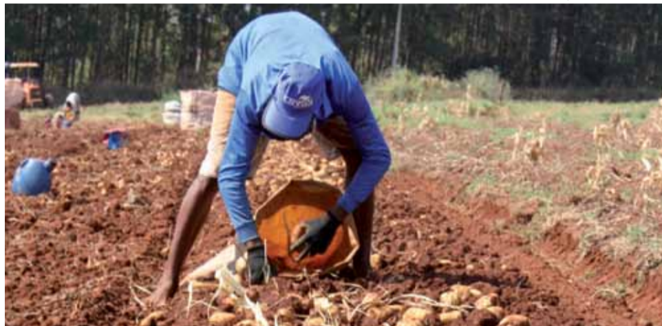
Colheita: batata é o carro-chefe da geração de empregos no mês de julho

No comparativo com julho do ano passado, quando a região havia registrado 1.984 vagas, Vargem Grande do Sul e São José do Rio Pardo continuam se conso-