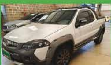
Strada Adventure Ano 2018