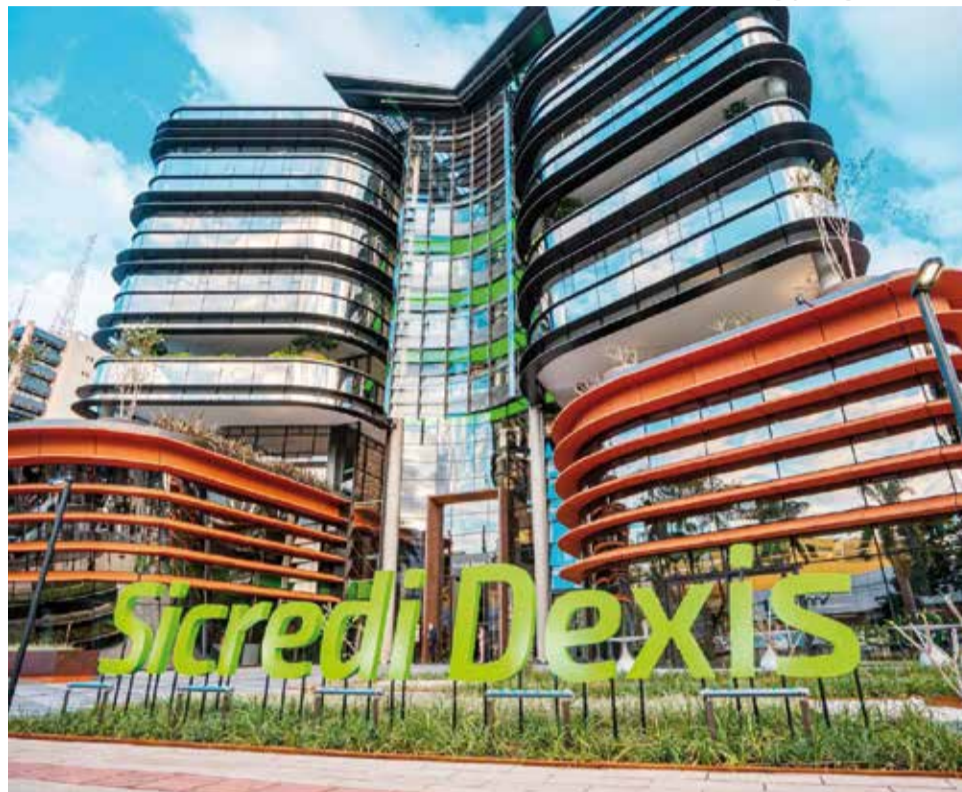
Crédito rural: recursos estão disponíveis para produtores do Paraná e São Paulo, onde a Sicredi atua

Para Pronamp e demais produtores, o governo elevou as taxas de juros,