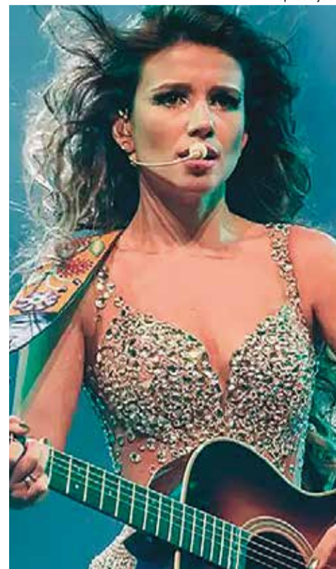
Paula Fernandes: cantora sertaneja pode estar entre as atrações do evento este ano