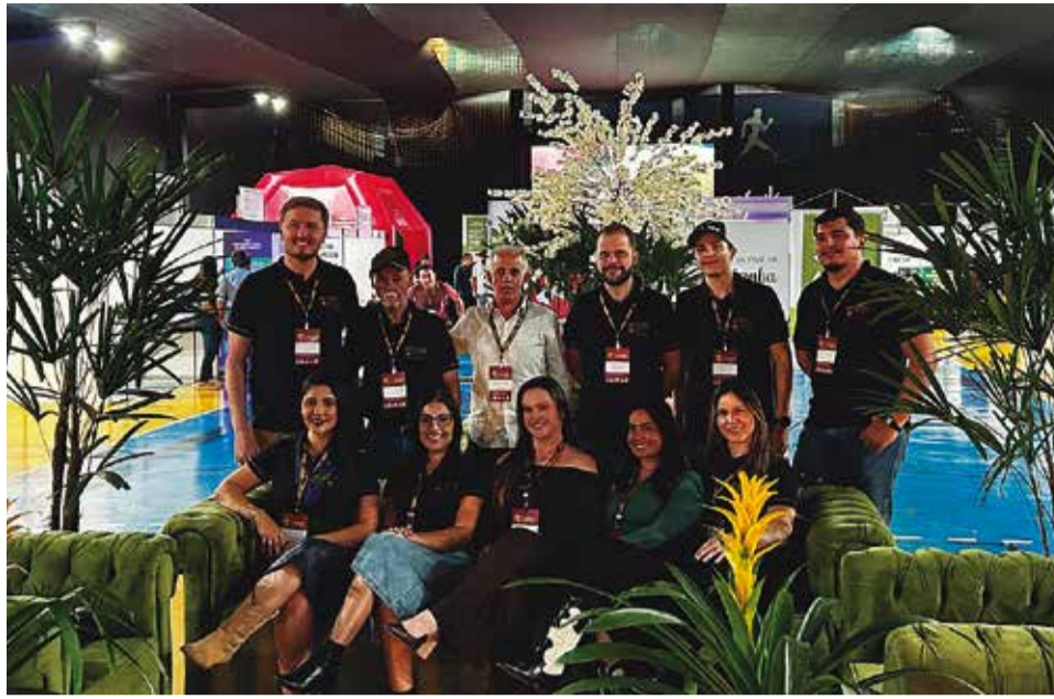
Dedicação: equipe do Sindicato Rural esteve à frente da organização do Senabe

Outro diferencial do Senabe foi a filantropia. A praça de alimentação do evento teve a participação de entidades como a ONG Mapear, Obra Deus Proverá, Escola de Educação Especial Cáritas, Sociedade Lar da Infância, Projeto Renascer, Fundo Social Municipal e Recanto Pastorinho que comercializam, além de sabores tradicionais, di-