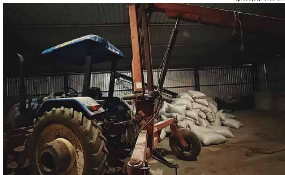
Apreensão: trator e carga de café foram localizados em barracão situado em Vargem Grande do Sul