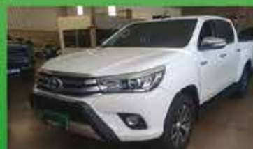
Hilux SRX Automática Ano 2016