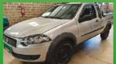
Strada trekking Ano 2011