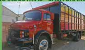
Caminhão 1613 Toco Ano 77 com gaiola boiadeiro