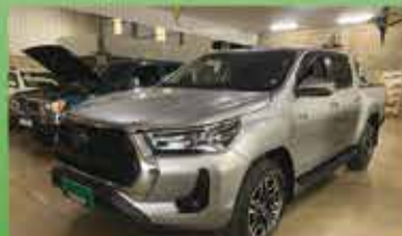
Hilux SRX Automática Ano 2022

ROD. SP 340 S/N KM 237 - BAIRRO INDUSTRIAL - CASA BRANCA-SP