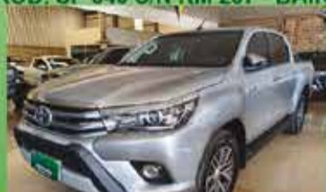
Hilux SRX Automática Ano 2017