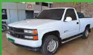
Silverado DLX Ano 97