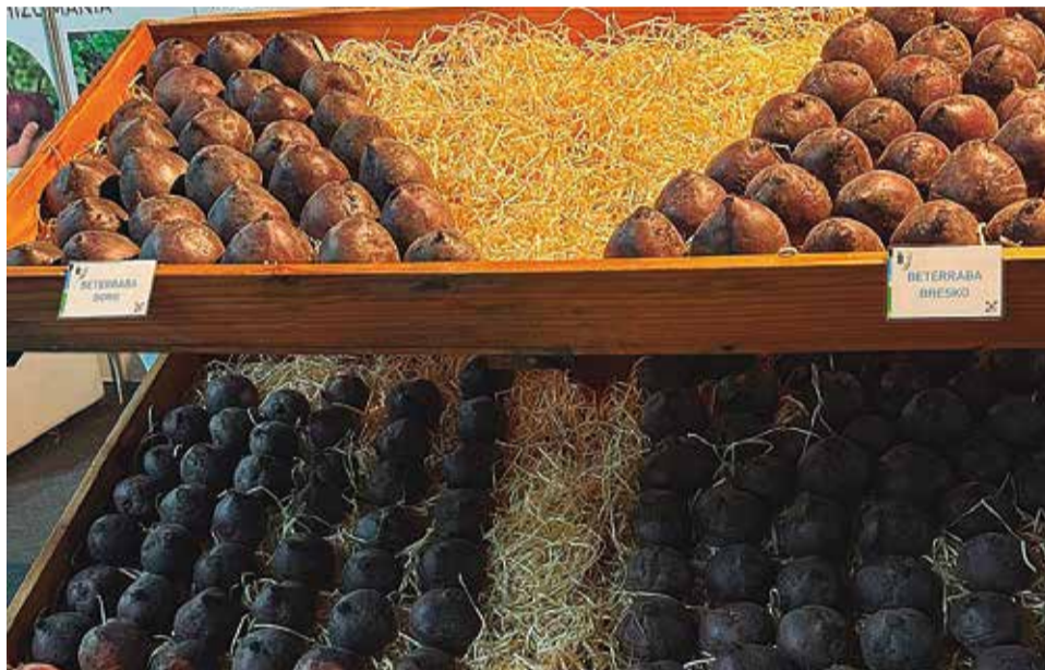
Beterraba: público conheceu as inovações para obter uma boa produção