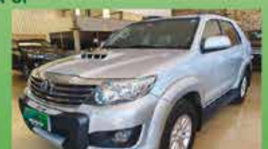
SW4 SRV Automática Ano 2012