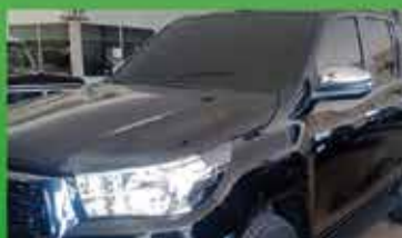
Hilux SRX Automática Ano 2017