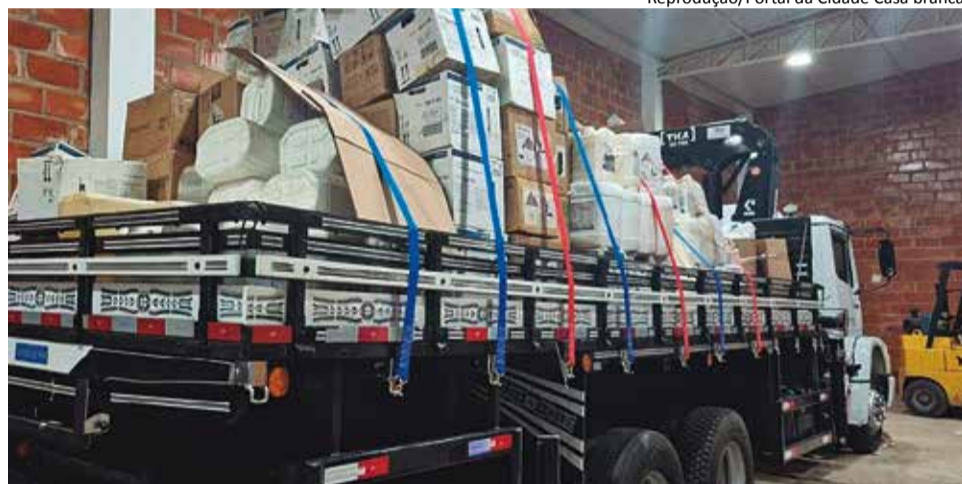
Operação: carga estava armazenada em um galpão localizado no Jardim Boa Esperança