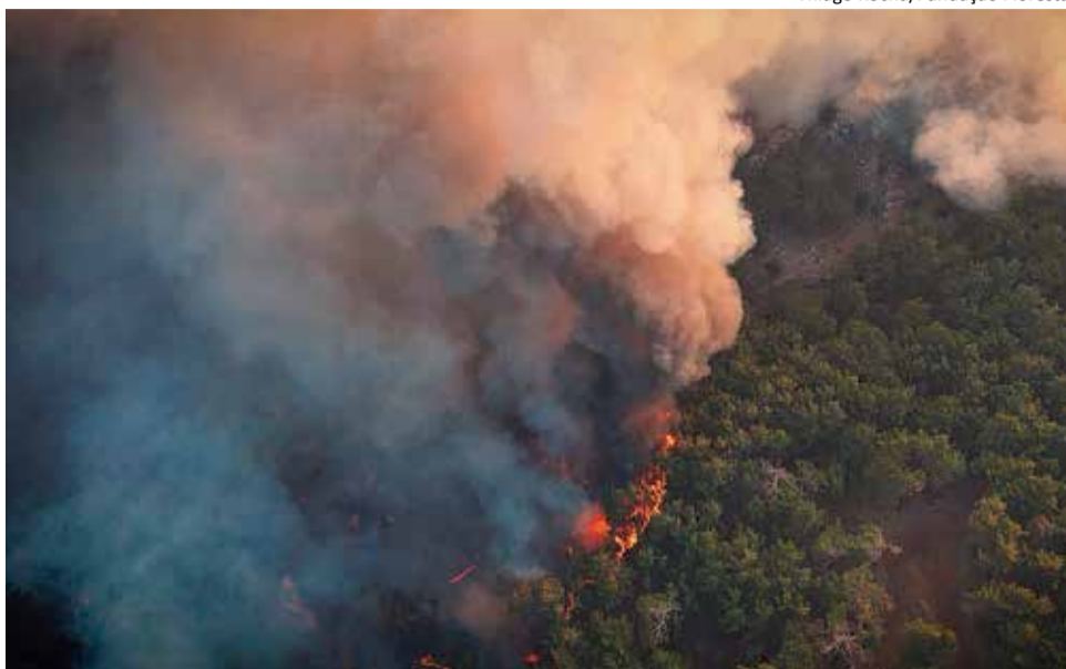
Thiago Rocha/Fundação Florestal

Ainda como parte da preparação, agentes do Departamento de Estradas e Rodagem (DER) foram capacitados para identificar focos de incêndio nas rodovias, evitando que o fogo se alastre para o interior. A parceria conta com o uso de aeronaves de asa fixa, que ajudam no combate às chamas de forma rápida e eficaz, principalmente