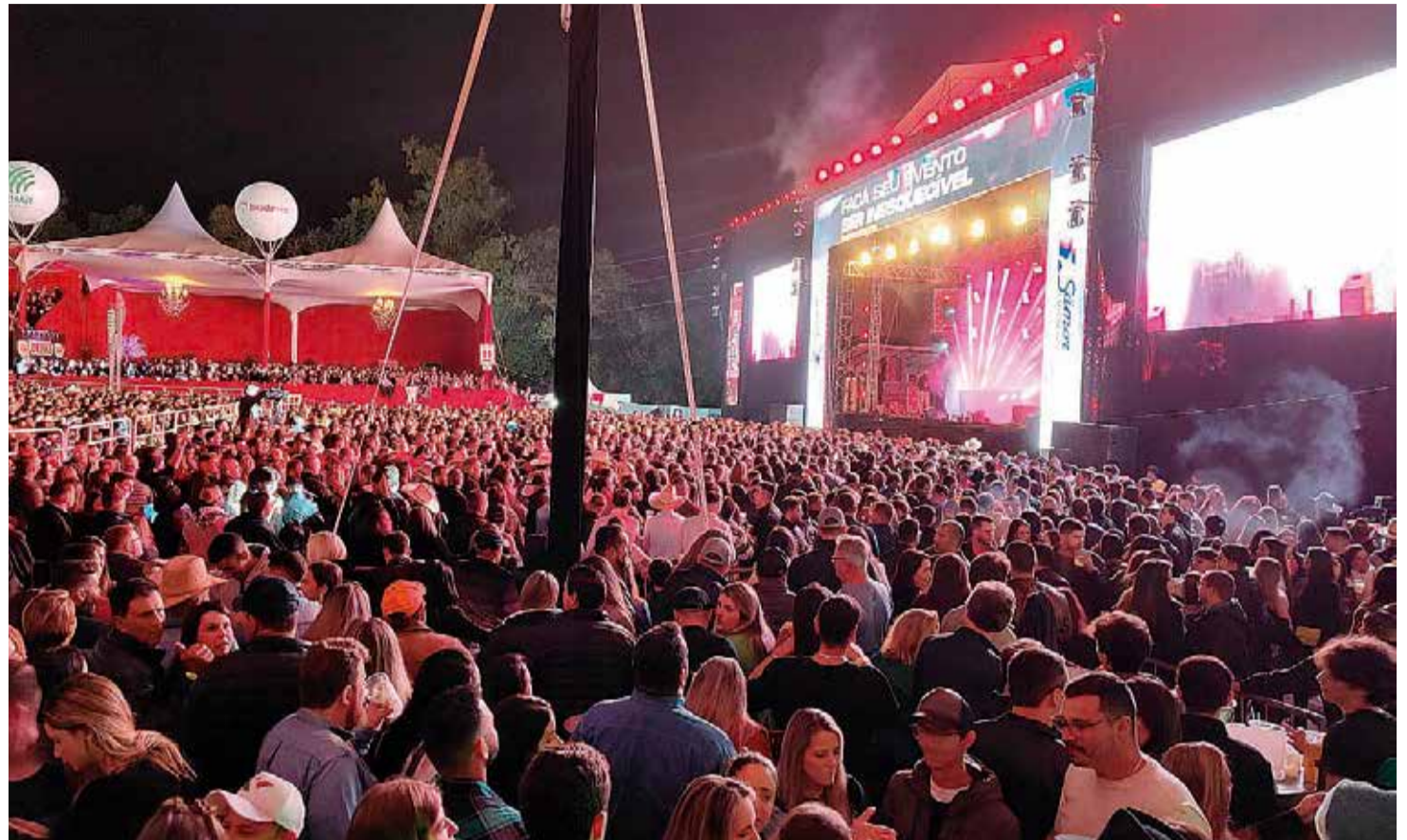
Gigante: Eapic é considerada a maior festividade agropecuária da região

tura sanjoanense confirmou que o certame foi reaberto, com o objetivo de viabilizar o processo e assegurar tempo hábil para a organização. “A