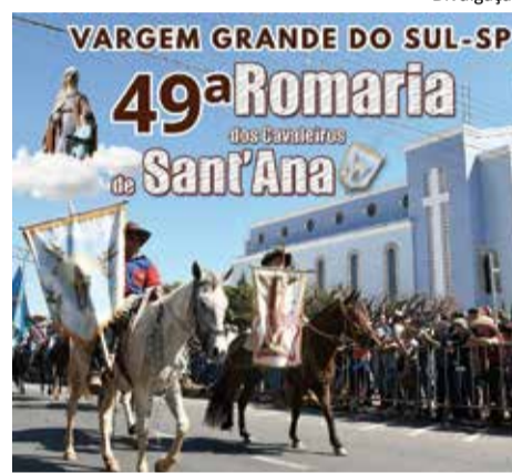
Tradição: romaria é realizada em homenagem à Sant'Ana, a padroeira da cidade

dos participantes às 10h30 no largo da Igreja São Joaquim, no Jardim Dolores. Após as bênçãos, o desfile segue pelas principais ruas e avenidas do município, com destino à Igreja Matriz de Sant'Ana, no Centro. Além dos cavaleiros e amazonas, o evento também contará com a apresentação de carros de boi, charretes e comitivas de várias cidades paulistas e também de Minas Gerais.