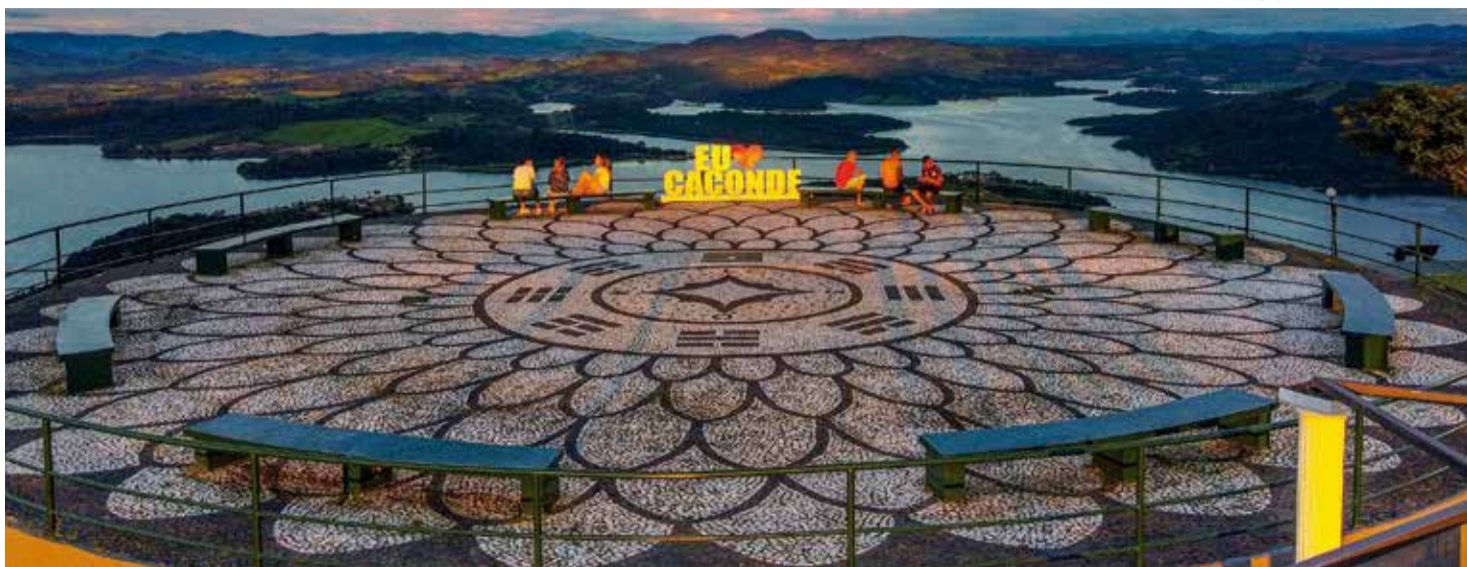
Caconde: cidade tem um forte potencial turístico e oferece várias alternativas para serem desenvolvidas

A Estância Turística de Caconde, integrante da Região Turística Entre Rios, Serras e Cafés, foi palco da 12ª edição do EmpreendaTur. O evento itinerante ocorreu no dia 28 de junho e tem como objetivo promover o turismo e o empreendedorismo em cidades do interior paulista, contribuindo para o desenvolvimento econômico sustentável.