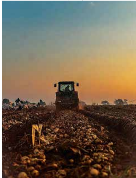
Batata: safra impulsiona a economia em Vargem Grande do Sul

em Vargem Grande do Sul tem pressionado as cotações nos atacados.