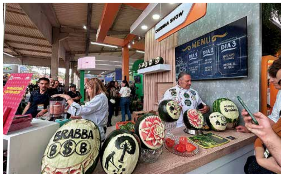
Referência mundial: Hortitec é considerada a maior exposição de horticultura da América Latina, reunindo conhecimento, inovação e oportunidades de negócios em um só lugar