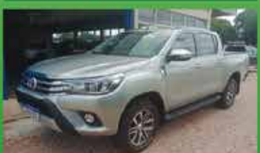
Hilux SRX Automática Ano 2016