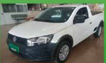
Saveiro Robust Ano 2022