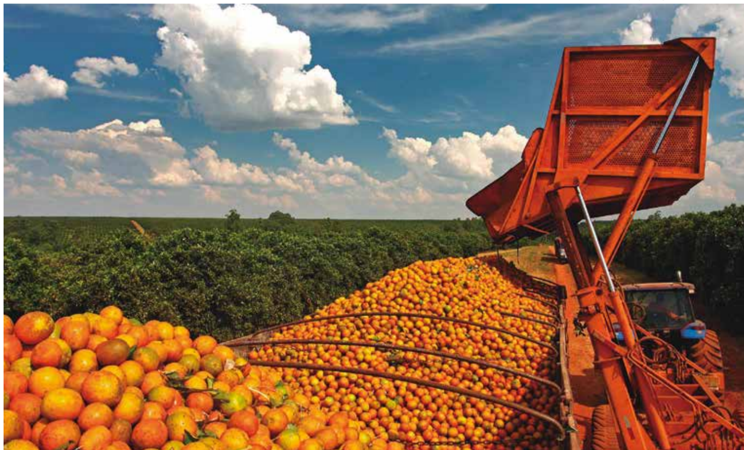
Gigante: citricultura paulista é responsável por cerca de 80% da produção nacional de laranja e por 90% do suco de laranja processado no país

Para fortalecer ainda mais o setor, a Secretaria de Agricultura e Abastecimento do Estado de São Paulo lançou, em 2024, a linha de crédito Combate ao Greening, com o objetivo de apoiar os produtores na adoção de medidas