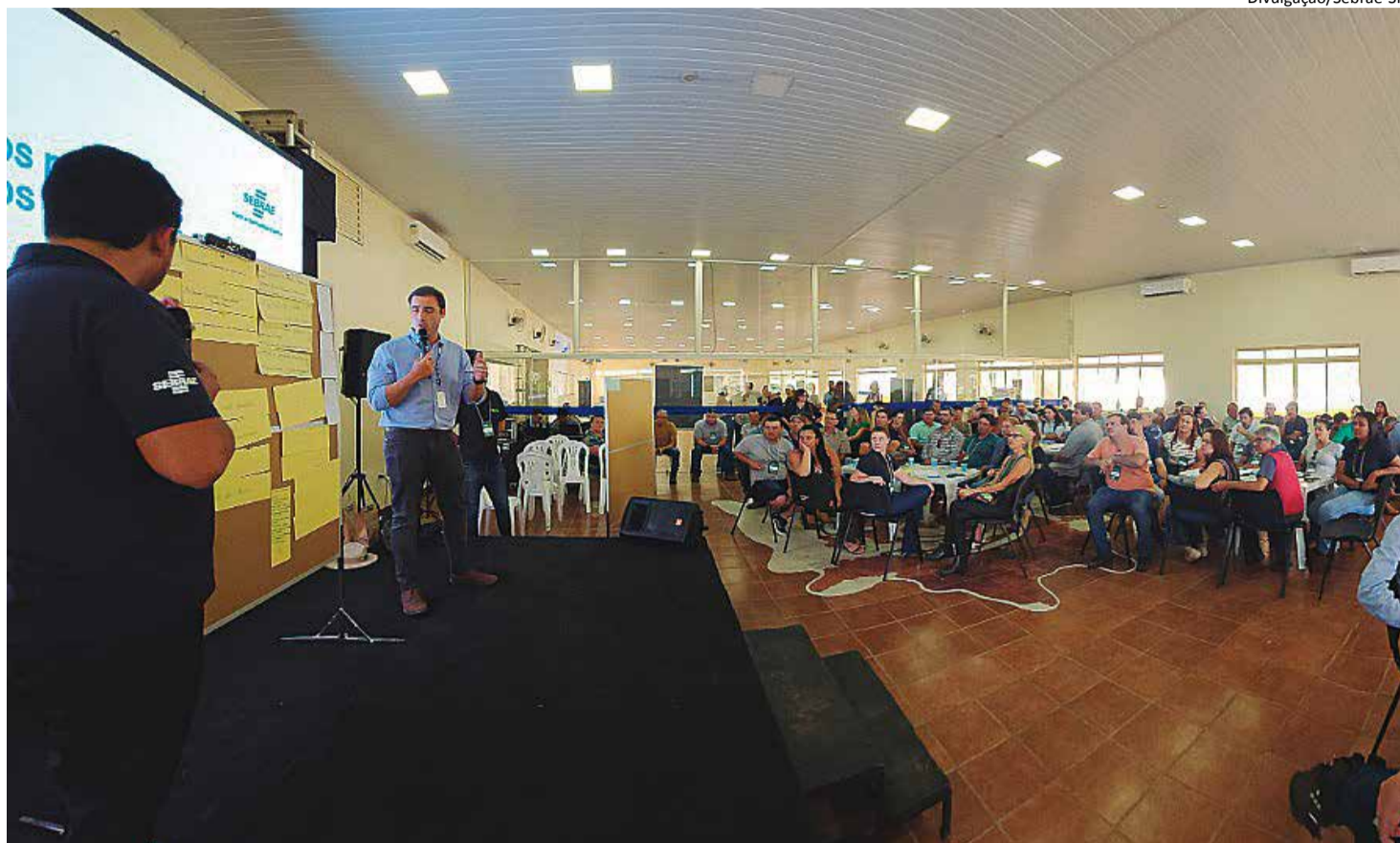
Agro Conexões: programação reuniu mais de 120 produtores rurais e empresários do segmento de leite e derivados e pecuária bovina

"O Encontro Regional de Produtores de Leite e Derivados foi uma iniciativa inédita na região, que colocou o empreendedor rural no centro do debate. Ouvimos di-