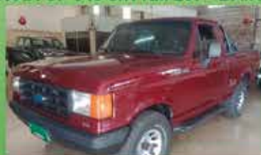
F1000 4x4 Ano 94