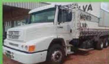
Caminhão 1620 Camoceria Ano 2009

ROD. SP 340 S/N KM 237 - BAIRRO INDUSTRIAL - CASA BRANCA-SP