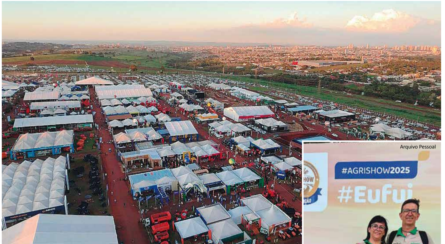
Agrishow: feira movimentou o volume recorde de R$ 14,6 bilhões em intenções de negócios nesta edição

ção em uma área de 520 mil metros quadrados – o que supera 50 campos de futebol –, onde 800 expositores do Brasil e do mundo apresentaram tec-