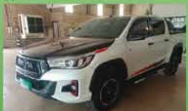
Hilux GR Automática Ano 2020