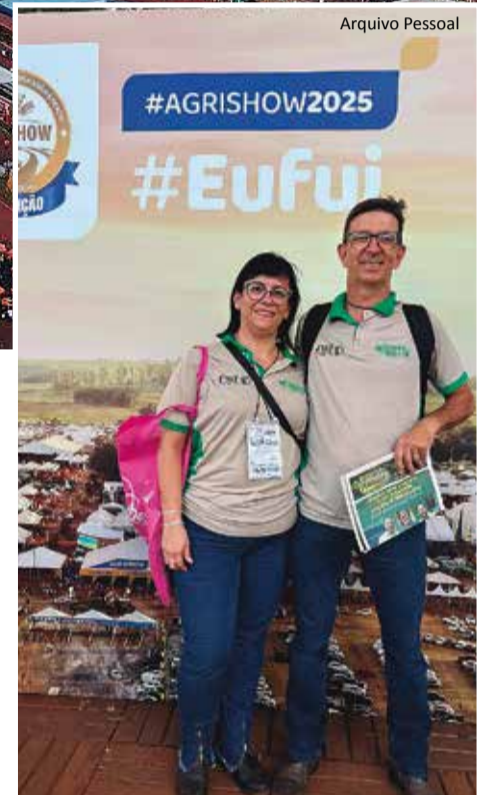
Cobertura: Jornal do Produtor marcou presença na Agrishow

Em 2026, a Agrishow está prevista para acontecer entre 27 de abril e 1º de maio. “A área da Agrishow já ficou pequena, vamos ter que expandir para receber mais pessoas que querem ex-