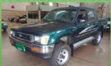
Hilux SR Mecânica Ano 94