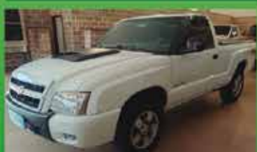
S10 C Simples 4x4 Ano 2011