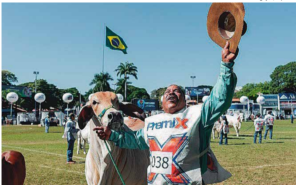
Conquista: apresentador comemora vitória da Fazenda Terra Verde durante a 90ª ExpoZebu