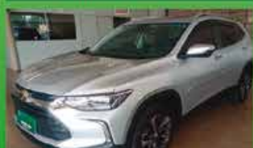
Traker Premier Automática Ano 2022