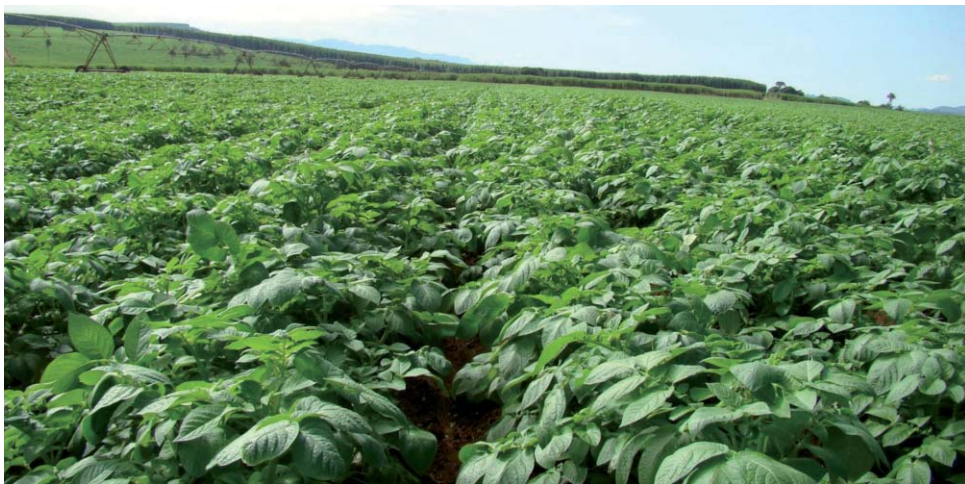
Plantação no campo de primeira multiplicação