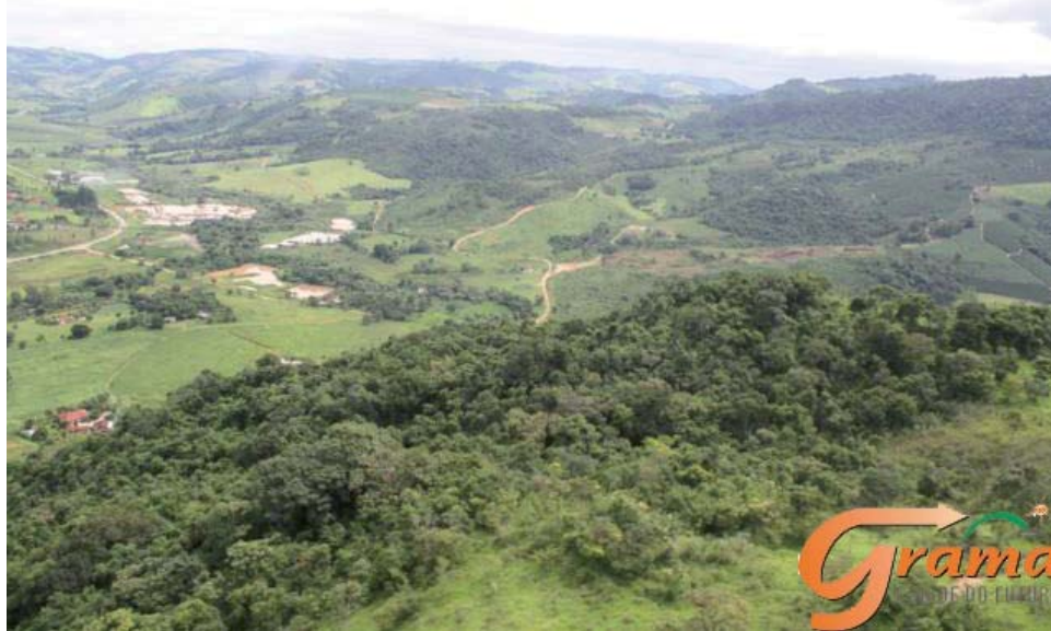
O Vale da Grama será um dos maiores beneficiados com o projeto

quada, consequentemente teremos novos empregos e novas oportunidades para as famílias de Grama", explica.