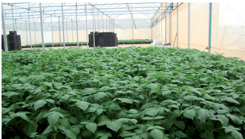
Sistema de mini tubérculos é adotado pelos países exportadores de batata-semente para suprir as necessidades internas

exportar para outros países como o Brasil. Nossos produtores relutam ainda em plantar este tipo de material, pois temem que não vão obter boas produtividades por plantar batatas tão pequenas. Sempre digo que mini tubérculo não é batata miúda ou "pirulito" como muitos insistem em chamar.