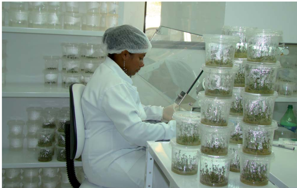
Etapas de produção: do laboratório até o campo de primeira multiplicação

O sistema de mini tubérculos é adotado pelos países exportadores de batata-semente para suprir as necessidades internas, bem como