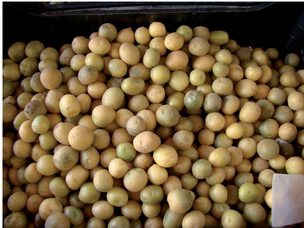
Para obter uma boa produção, produtor deve se atentar aos cuidados

Se tudo correr bem nesta etapa, temos a certeza de que teremos uma excelente fonte de sementes de alto desempenho que garantirão altas produções nas multiplicações futuras. A produtividade deste primeiro plantio gira em torno de 25 a 32 toneladas por hectare para as variedades que se plantam no Brasil. Nas produtividades mais elevadas te-