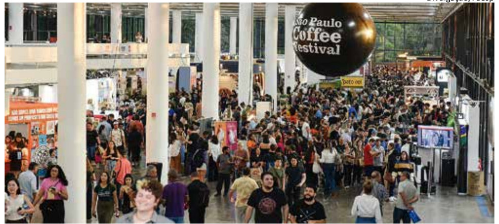
São Paulo Coffee Festival: evento atraiu grande público na Fundação Bial