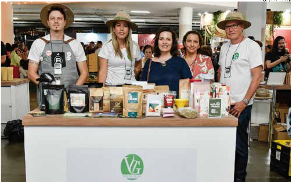
Vale da Grama: marcas apresentaram cafés especiais durante a exposição na capital paulista