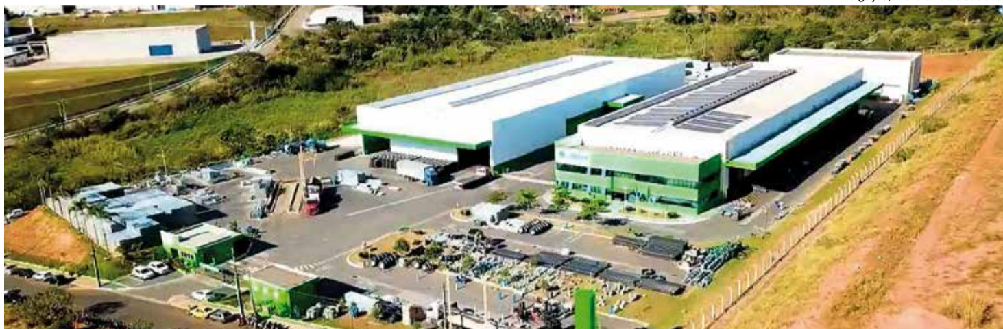
Bauer do Brasil: unidade sanjoanense emprega quase 400 pessoas atualmente; obras de ampliação terão início entre o final do ano e o começo de 2025

Em nota nas redes sociais, a Prefeitura de São João da Boa Vista destacou os reflexos positivos da expansão da empresa no município. “A ampliação da Bauer do Brasil trará ainda mais benefícios para a cidade, como o aumento da arrecadação de impostos, a diversificação da economia local e a geração de emprego e renda para a população”,