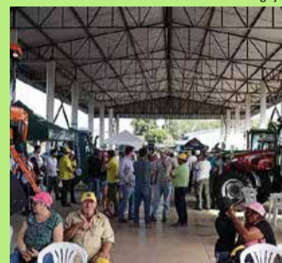
Agenda: evento será no dia 18 no Cessinha