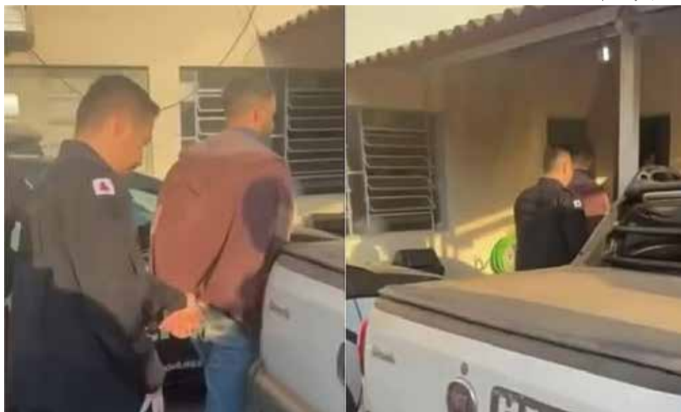
Prisão: homem é suspeito de furto de 70 cabeças de gado em Andradadas; investigações prosseguem