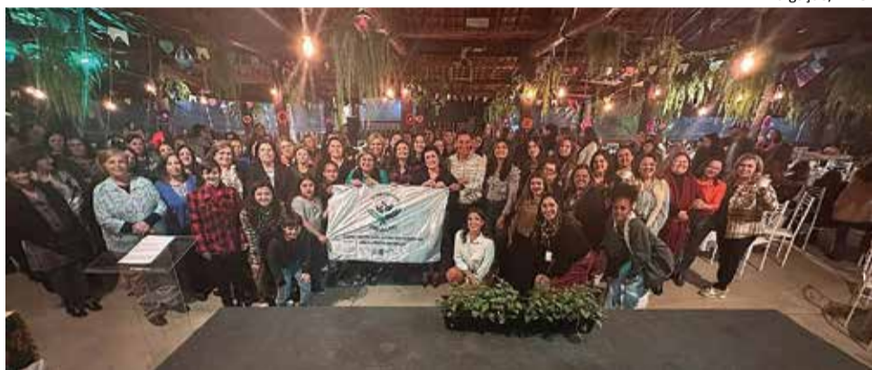
Semeadoras do Agro: terceiro módulo contou com a participação de grande público em Caconde