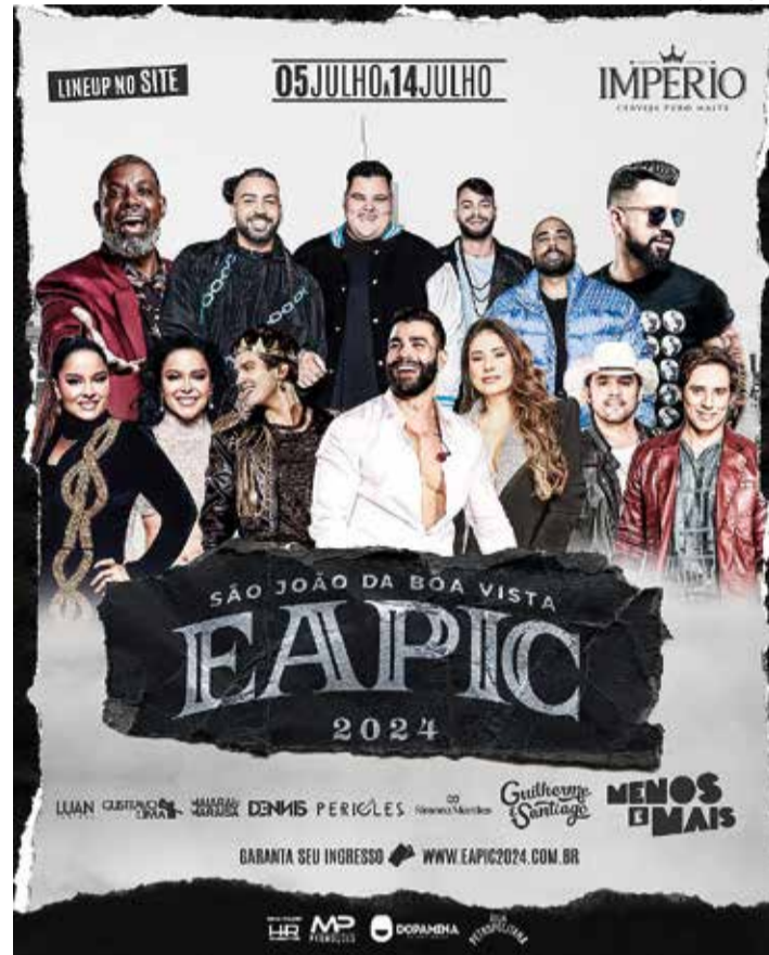
49ª Epic: programação reunirá shows com cantores consagrados no Recinto de Exposições 'José Ruy de Lima Azevedo'