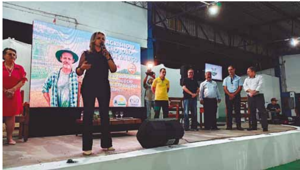
Solenidade: abertura da programação reuniu autoridades e lideranças de São João da Boa Vista

Organizado pelo Sindicato Rural de São João da Boa Vista juntamente com o Serviço Nacional de Aprendizagem Rural (Senar) e a Federação da Agricultura e Pecuária do Estado de São Paulo (Faespa), o evento teve o apoio da Prefeitura de São João, da Coordenadoria de Defesa Agro-