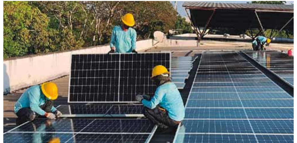
Energia solar: expectativa é que a medida estimule o investimento em infraestrutura verde

Atualmente, a indústria de semicondutores no Brasil tem faturado mais de R$ 3 bilhões por ano, correspondendo a cerca de 0,2% da oferta mundial desses componentes essenciais para a chamada Indústria 4.0. No entanto, o