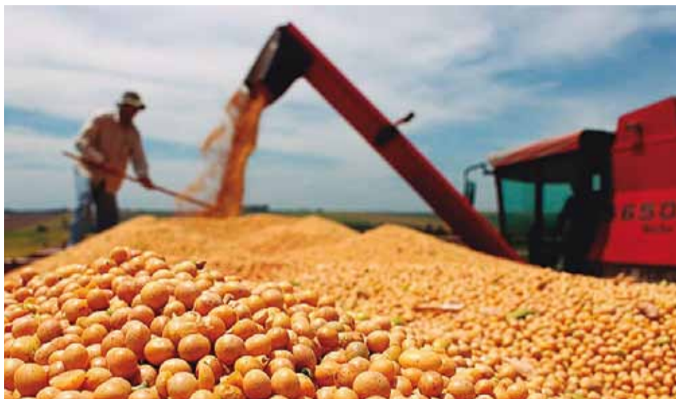
Serviço: soja está entre as principais culturas atendidas pela instituição financeira

o registro do Cadastro Ambiental Rural (CAR). Todas as 111 agências da cooperativa contam com especialistas agro.