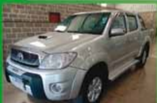
Hilux SRV Automática Ano 2011

DIA 28/7 DIA DO AGRICULTOR NOSSA SINCERA HOMENAGEM