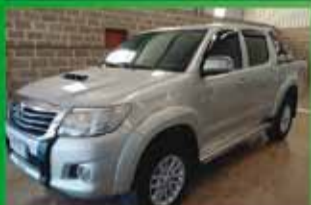
Hilux SRV Automática Ano 2012