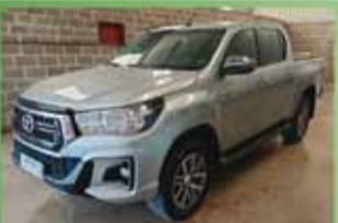
Hilux SRV Automática Ano 2020