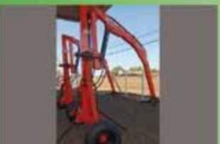
Guincho Giratória 2 Ton Civemasa Ano 2021