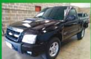
S10 Flex cabine simples Ano 2011