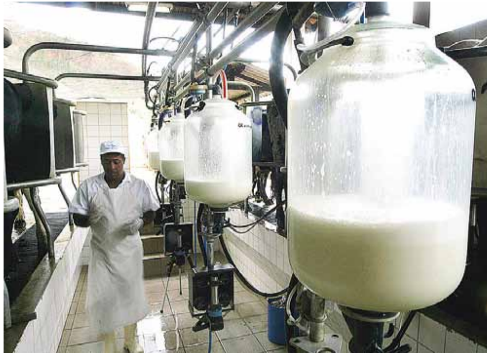
Leite: principal causa do aumento nos preços é a menor oferta do produto nos laticínios

Segundo Carvalho, o preço, mesmo em alta, não está sendo suficiente para cobrir os custos, o que piorou a rentabilidade nas fazendas e levou o produtor a diminuir a oferta, reduzindo a alimentação das vacas. Em pesquisa referente à compra de leite pelos laticínios no primeiro trimestre do ano, os dados do Instituto Brasileiro de Geografia e Estatística (IBGE) revelaram