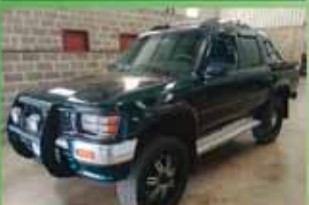
Hilux SRV Mecânica Ano 1995