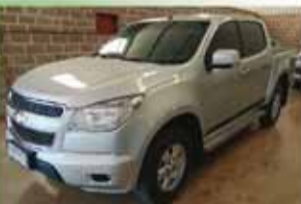
S10 LT Flex Mecânica Ano 2015