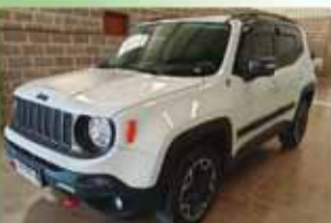
Jeep Renegade Trail Hawk Automático Ano 2016

www.gomesdotta.com.br comercialgomesdotta@gmail.com