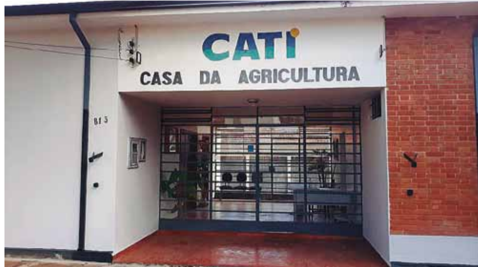
Retomada: Casa da Agricultura está situada à rua José Bonifácio, nº 813, região central de Vargem Grande do Sul

Conforme noticiado pelo jornal Gazeta de Vargem Grande, o órgão atendia apenas em horários limitados, o que levou os agricultores a reivindicar o retorno do atendimento diário, como vinha