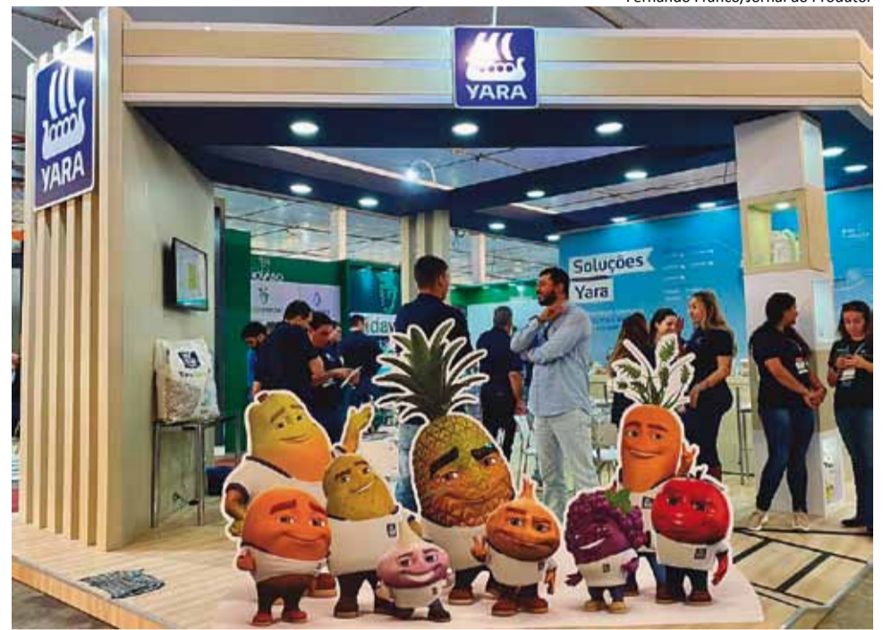
Novidades: Yara apresentou suas linhas de produtos durante a Hortitec

“A sustentabilidade é parte integrante da nossa estratégia de negócios e,