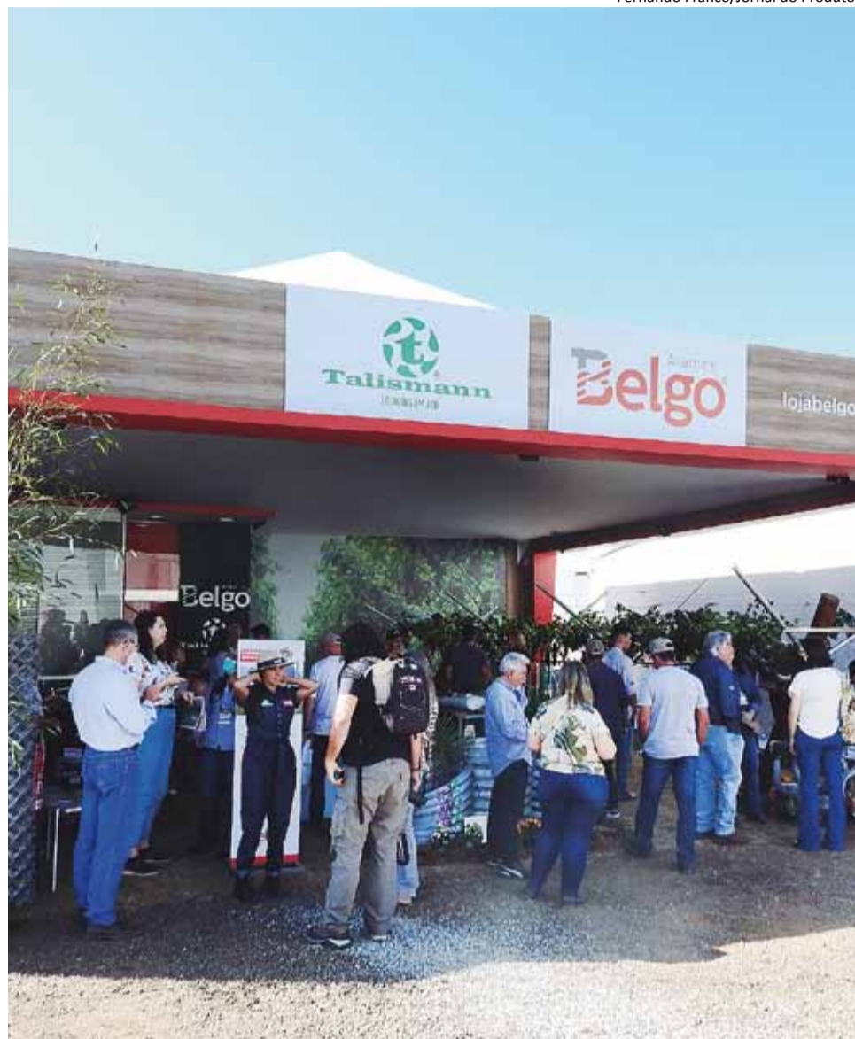
Destaque: Belgo Bekaert é líder brasileira no mercado de arames

A Belgo Bekaert é líder brasileira na transformação de arames de aço desde sua criação, fruto da parceria estratégica no Brasil entre a ArcelorMittal e a Bekaert. A empresa atua nos segmentos de agronegócios, cercamentos, construção civil, automotivo, solda, aplicações especiais e indústria petrolífera, oferecendo um mix de produtos e serviços que atendem com tecnologia de ponta, confiabilidade e qualidade aos mais diversos perfis de clientes.