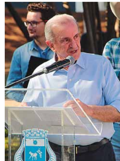
Maturro: "Eu louvo muito esta iniciativa de fazer as feiras regionais, porque marca um momento para os produtores da região."

A programação da Eapic prosseguiu na sexta-feira (8), com os shows de Dennis DJ, Barões da Pisadinha e a dupla Theo e Luan. No sábado (9) o público vibrou com os clássicos de Bruno e Marrone, além da performance do cantor Pedro Sampaio. O encerramento da feira ocorreu no domingo (10) e foi marcado pela apresentação do cantor Gustavo Mioto.