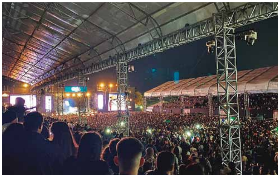
Eapic: exposição atraiu grande público no Recinto de Exposições "José Ruy de Lima Azevedo"

tor rural, a Eapic lançou o 1º Simpósio de Agronegócios, onde foram abordados diversos temas relacionados ao meio agropecuário, reunindo palestrantes, produtores rurais e diversas pessoas ligadas ao mundo agro.