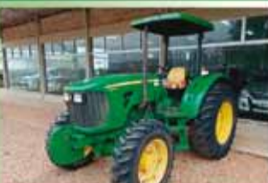
Trator John Deere 5078E Ano 2013