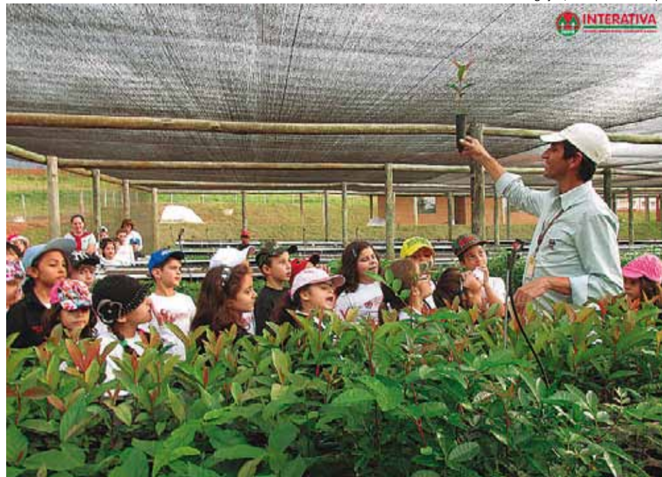
Iniciativa: Cooxupé mantém projeto que prevê a conservação da natureza junto a cafeicultores e alunos

Tais mudas colaboram com os cooperados e instituições para recuperação de nascentes e de áreas ambientais, bem como cooperam em programas ambientais desenvolvidos em parceria com ONGs e escolas da região de atuação da Cooxupé. Para se ter uma ideia, só em 2021, o NEA doou 25 mil mudas