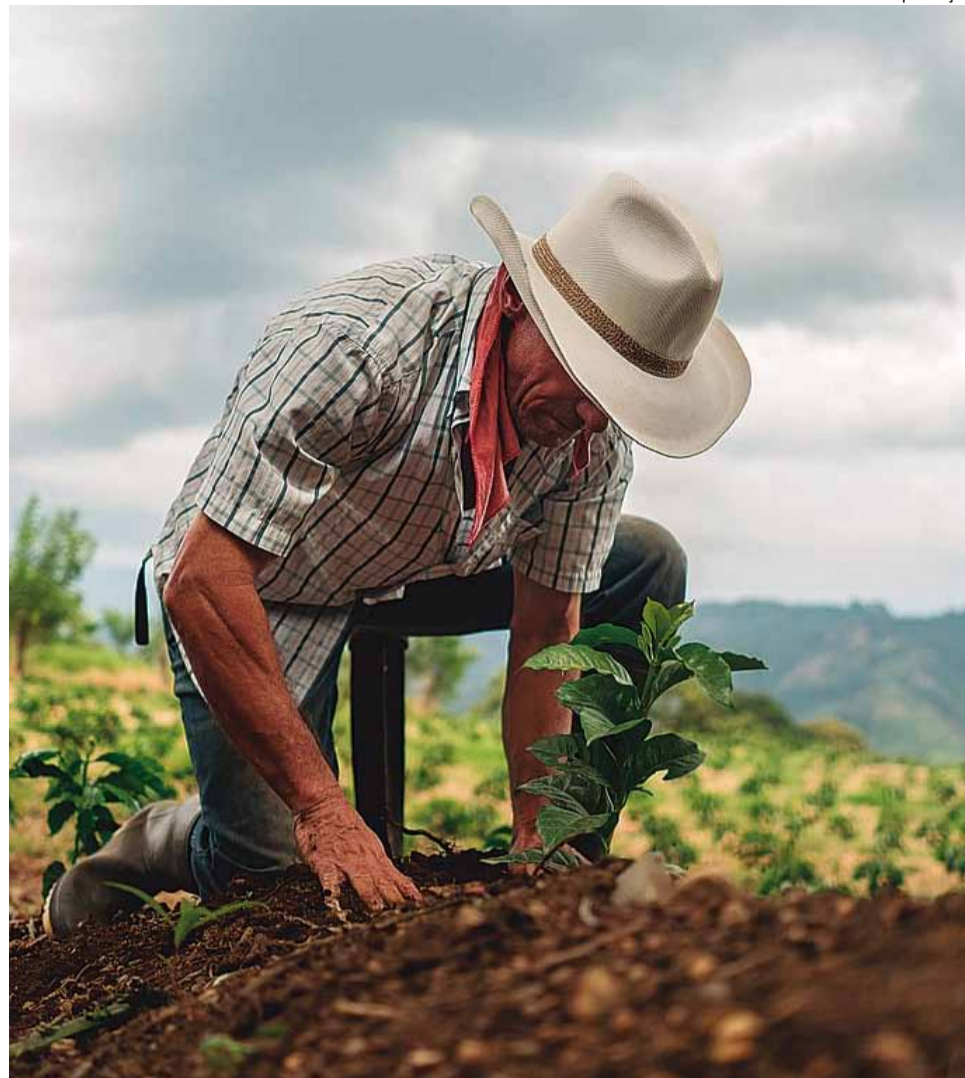
Dia do Agricultor: protagonismo do produtor rural continua sendo importantíssimo para o desenvolvimento do país

A agricultura e pecuária estão presentes na vida de todos os cidadãos, desde o café pela manhã até o chazinho antes de dormir. E o grande responsável por todos os alimentos e muitos outros itens indispensáveis para o dia a dia é o produtor rural, que, mesmo diante de muitas dificuldades e desafios, produz alimentos