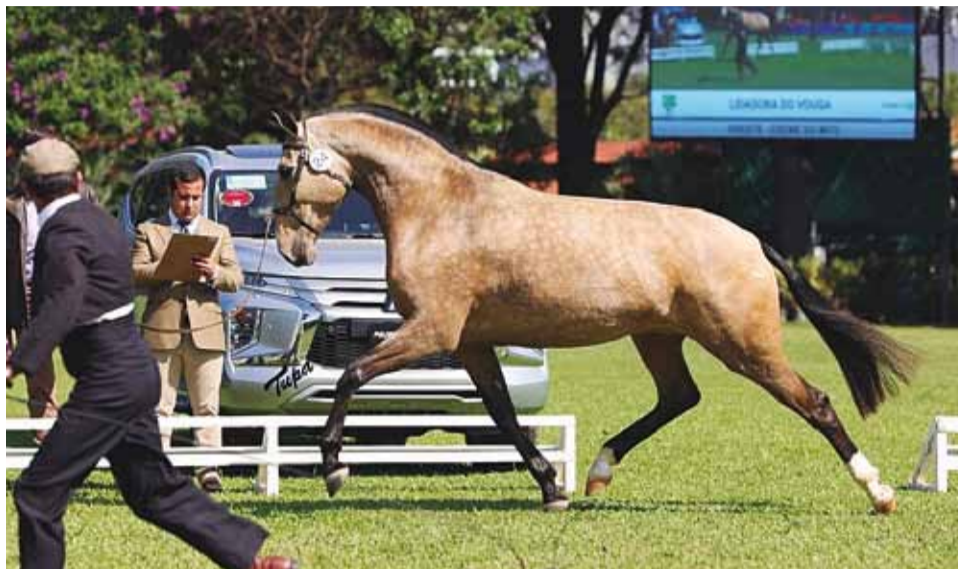
Campeã dos Campeões: égua Lidadora do Vouga recebeu o título mais cobiçado do evento

O Concurso de Modelo e Andamentos consagrou ainda o Grande Cam-