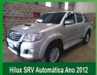
Hilux SRV Automática Ano 2012