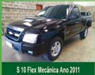
S 10 Flex Mecânica Ano 2011