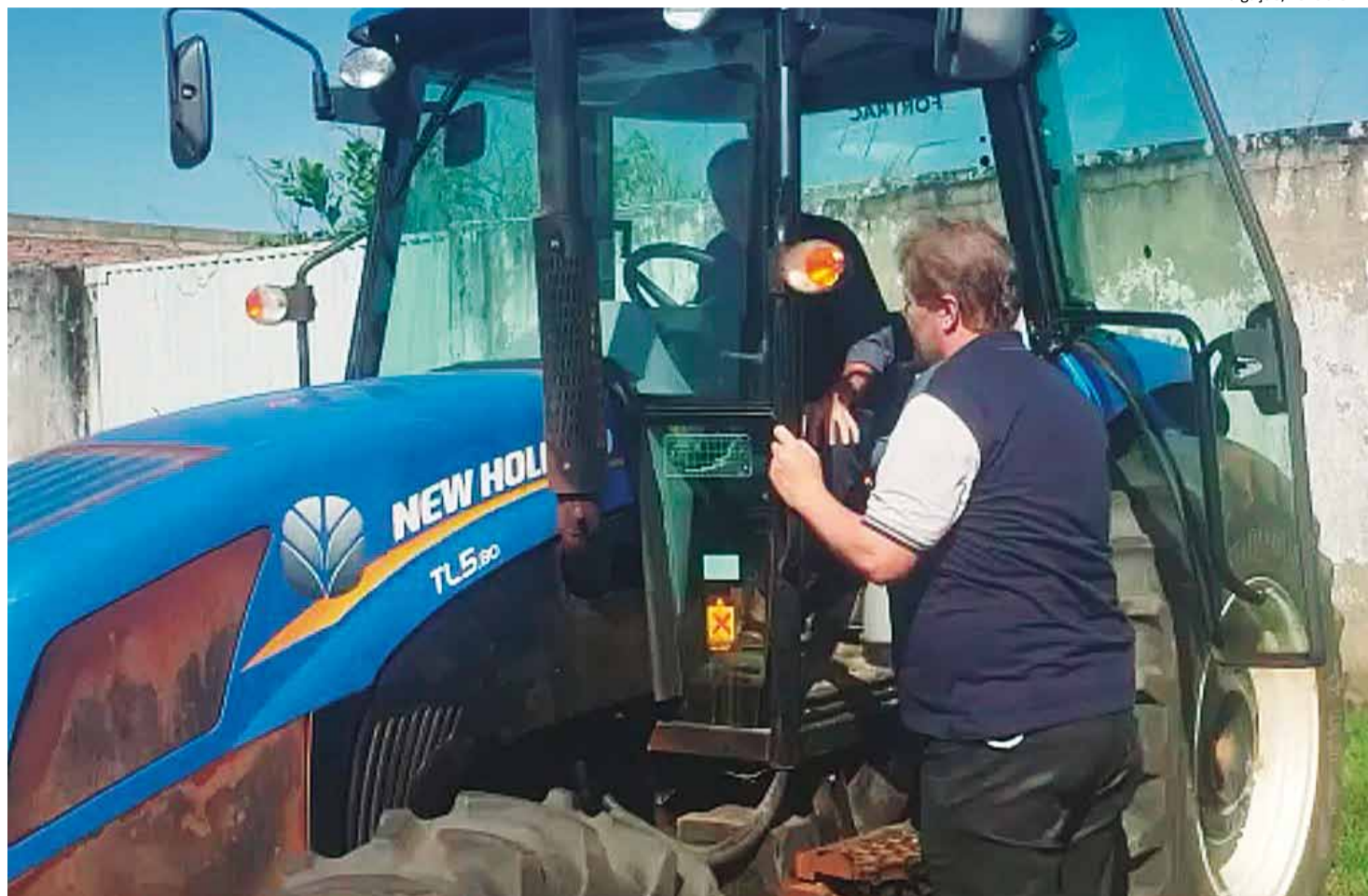
Recuperado: trator subtraído em Casa Branca foi encontrado pela Polícia Civil em Porto Velho