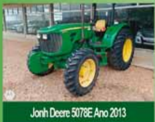
Jonh Deere 5078E Ano 2013