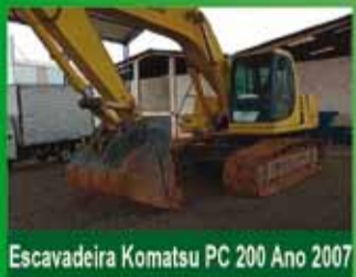
Escavadeira Komatsu PC 200 Ano 2007

VEÍCULOS E MÁQUINAS AGRÍCOLAS VENDAS - COMPRAS - CONSIGNAÇÃO