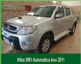
Hilux SRV Automática Ano 2011