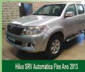
Hilux SRV Automática Flex Ano 2013