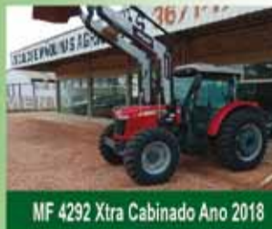
MF 4292 Xtra Cabinado Ano 2018