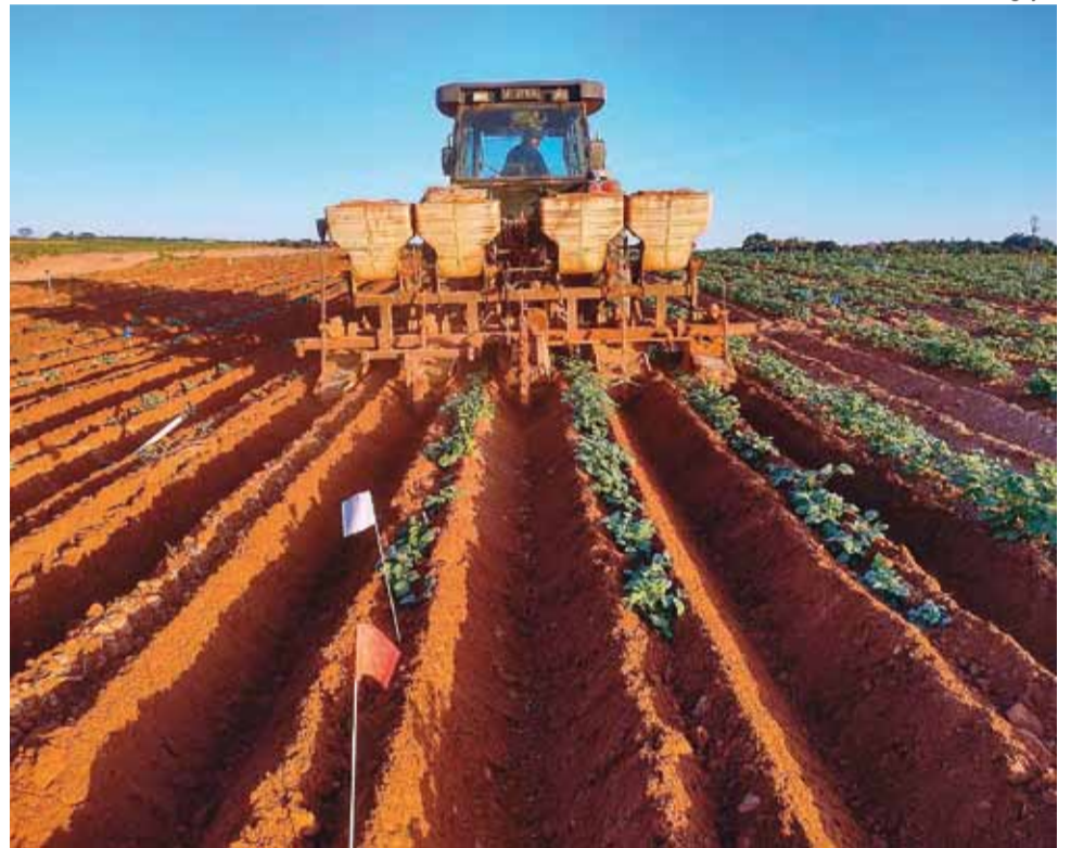
Campo de testes: pesquisas são valiosas para a indústria ou mesmo para empresas que comercializam sementes e/ou batatas de mesa