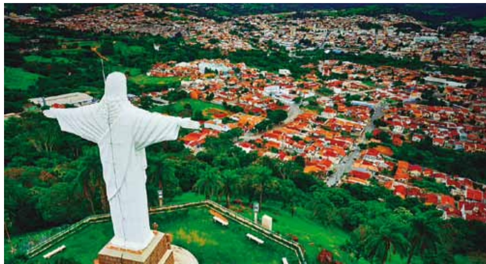
Turismo: São José do Rio Pardo é conhecida pelas belezas naturais e pela forte tradição agrícola

Em informe divulgado pela administração municipal, agora, os pontos turís-