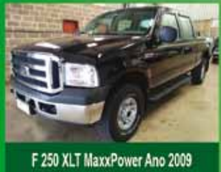
F 250 XLT MaxxPower Ano 2009