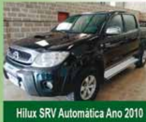
Hilux SRV Automática Ano 2010

www.gomesdotta.com.br comercialgomesdotta@gmail.com