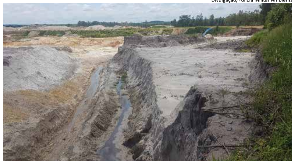
Mineradora: atividade da empresa será apurada pela Polícia Federal