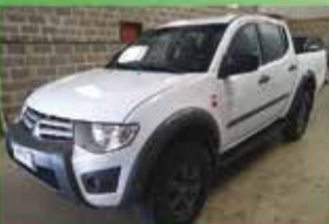
Triton Mecânica Ano 2017