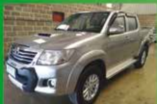
Hilux SRV Automática Ano 2015

VEÍCULOS E MÁQUINAS AGRÍCOLAS VENDAS - COMPRAS - CONSIGNAÇÃO