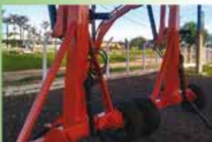
Guincho Giratória 2 Ton Ano 2022

www.gomesdotta.com.br comercialgomesdotta@gmail.com