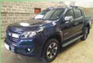
S 10 Yares Ano 2018