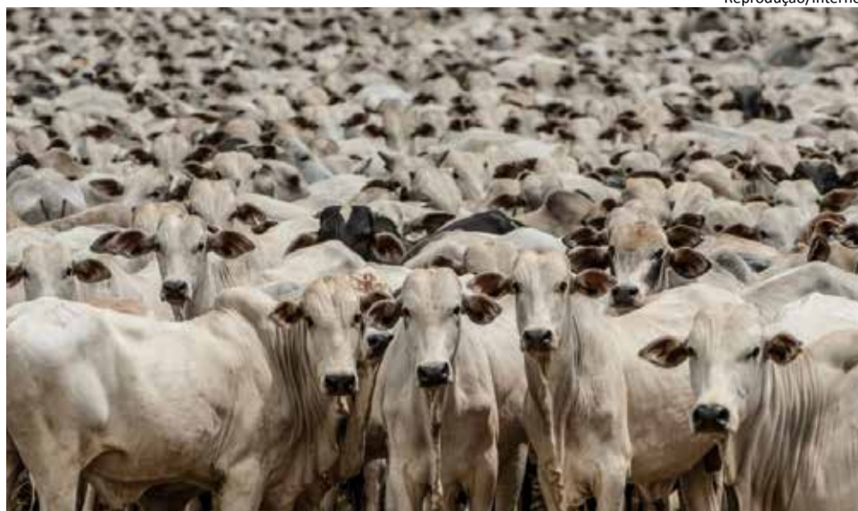
Campanhas: região sanjoanense é destaque na imunização do rebanho bovídeo contra febre aftosa e brucelose