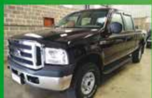
F 250 XLT MaxxPower Ano 2009