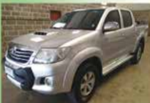
Hilux SRV Automática Ano 2012