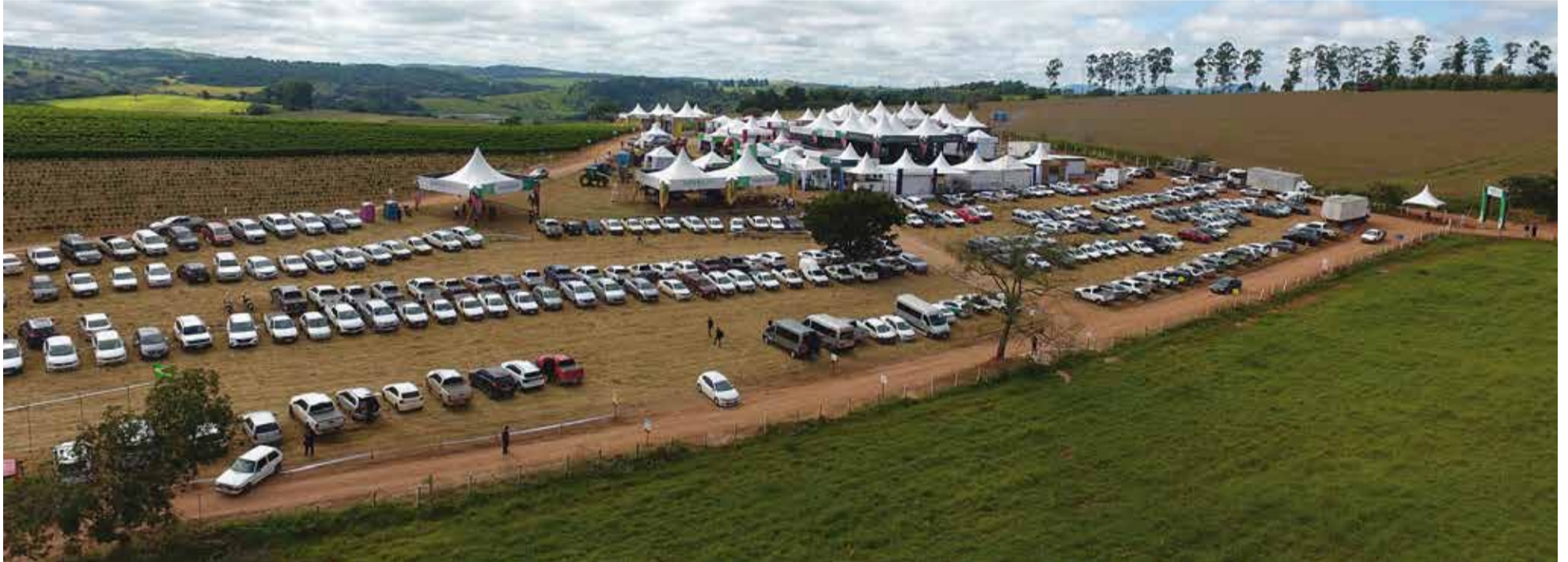
SuperAgro: exposição foi realizada nos dias 22 e 23 de fevereiro, em um campo experimental da Fazenda Primavera, em Alfenas (MG)