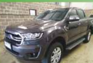
Ranger XLS Automática Ano 2020