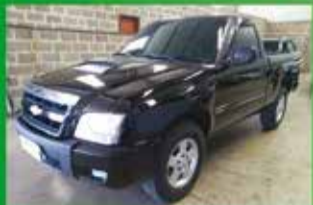
S10 Flex Ano 2010