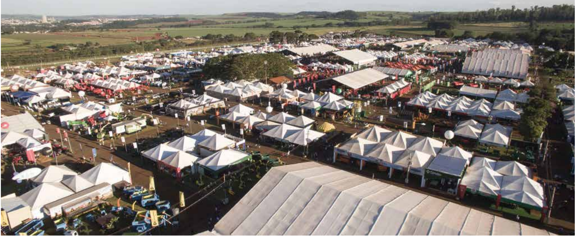
Agrishow: edição apresentará novidades tecnológicas para desenvolvimento do agronegócio nacional