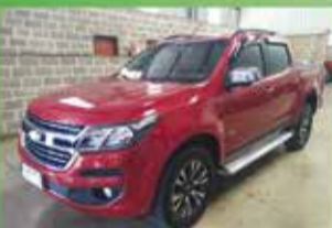
S10 LTZ Flex Automática Ano 2018