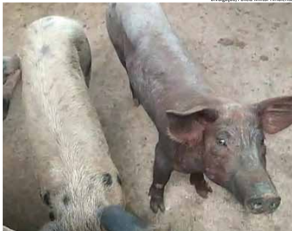
Precariedade: suínos encontravam-se magros e sem alimentação

Diante dos fatos, a equipe policial elaborou um Auto de Infração Ambiental (AIA) no valor de R$ 189 mil. A ocorrência foi apresentada à Polícia Civil e foi elaborado um termo