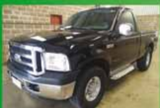
F 250 XLT Ano 2005

VEÍCULOS E MÁQUINAS AGRÍCOLAS VENDAS - COMPRAS - CONSIGNAÇÃO