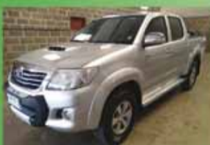
Hilux SRV Automática Ano 2012