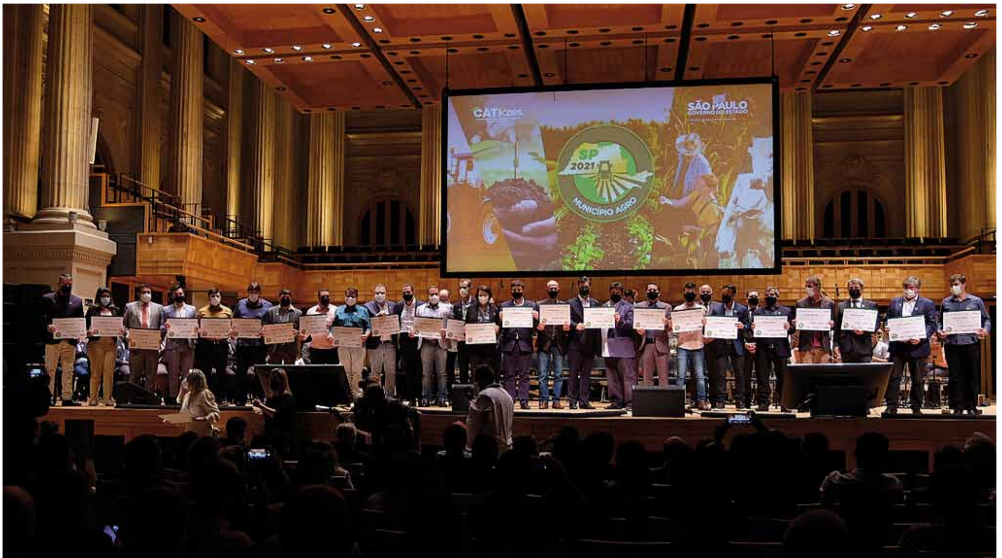
Cerimônia: governo paulista entregou certificados e premiações aos municípios contemplados