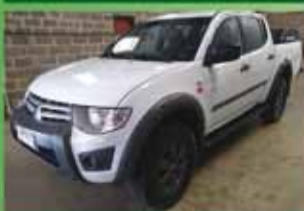
Triton Mecânica Diesel Ano 2017