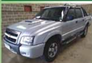
S 10 Executiva Flex Mecânica Ano 2011