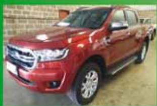
Ranger XLT Automática Ano 2020