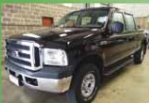
F 250 XLT MaxPower Ano 2009