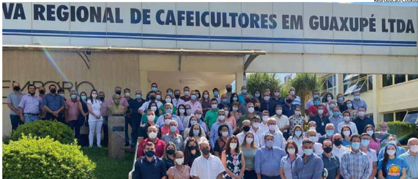
Filantropia: Cooxupé repassou os cheques aos representantes de instituições em evento realizado na sede da cooperativa

“Agora, felizmente, vivemos um momento melhor em relação aos anúncios das doações passadas, quando havia muita preocupação e insegurança. Mas, a população vai reconhecer, na fi-