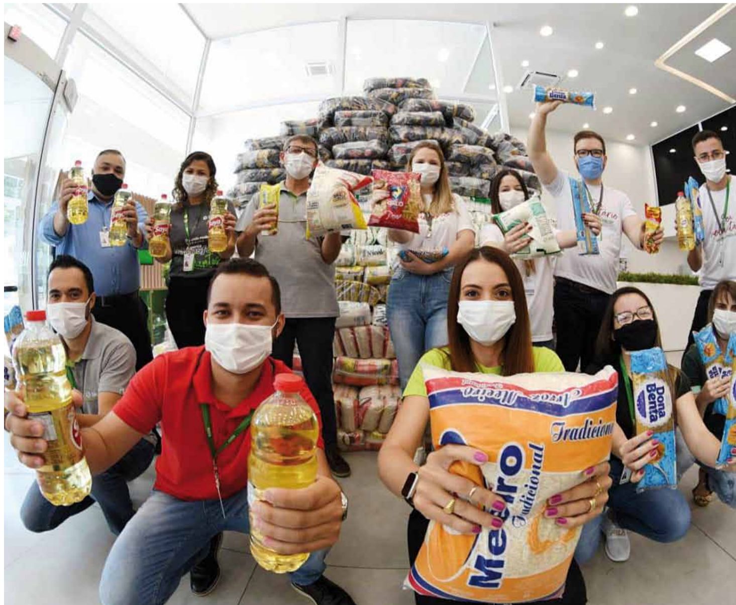
Destaque: Mogi Guaçu foi a cidade paulista que mais arrecadou alimentos durante a ação

Ainda na mesma região, mas em São João da Boa Vista, pelas três agências na cidade – Centro/Mantiqueira e Unimed –, foram arrecadados mais de 2,5 toneladas de alimentos não perecíveis