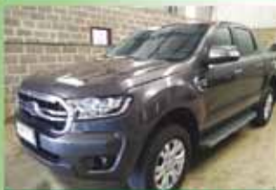
Ranger XLT Automática Ano 2020

www.gomesdotta.com.br comercialgomesdotta@gmail.com