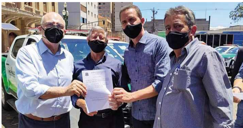
Programa: Espírito Santo do Pinhal esteve entre as cidades contempladas na região

Viaturas: veículos têm identidade visual do programa e são adaptados com giroflex e tecnologias como GPS e rádio comunicador