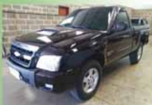
S 10 Flex Mecânica Ano 2010