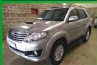
SW 4 SRV Automática Ano 2015