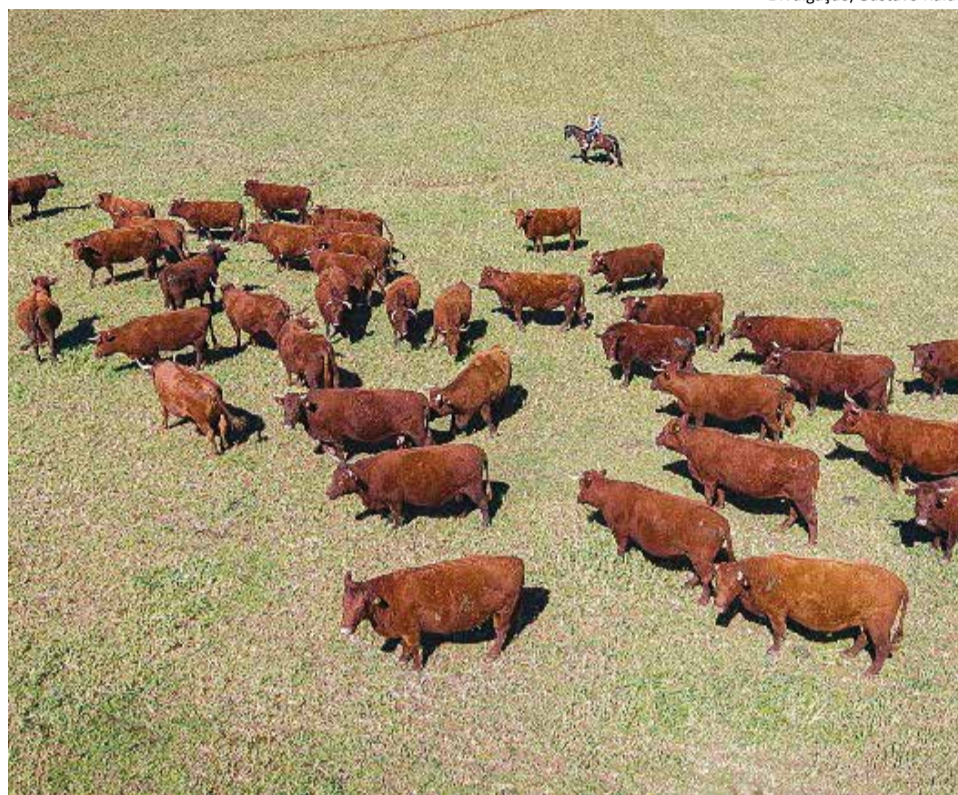
Destaque: Promebo também conquistou marcas positivas durante a pandemia

Os resultados positivos não param no número de registros. O Programa de Melhoramento de Bovinos de Carne (Promebo) também conquistou marcas positivas durante o período da pandemia. Nas avaliações por ultrassonografia