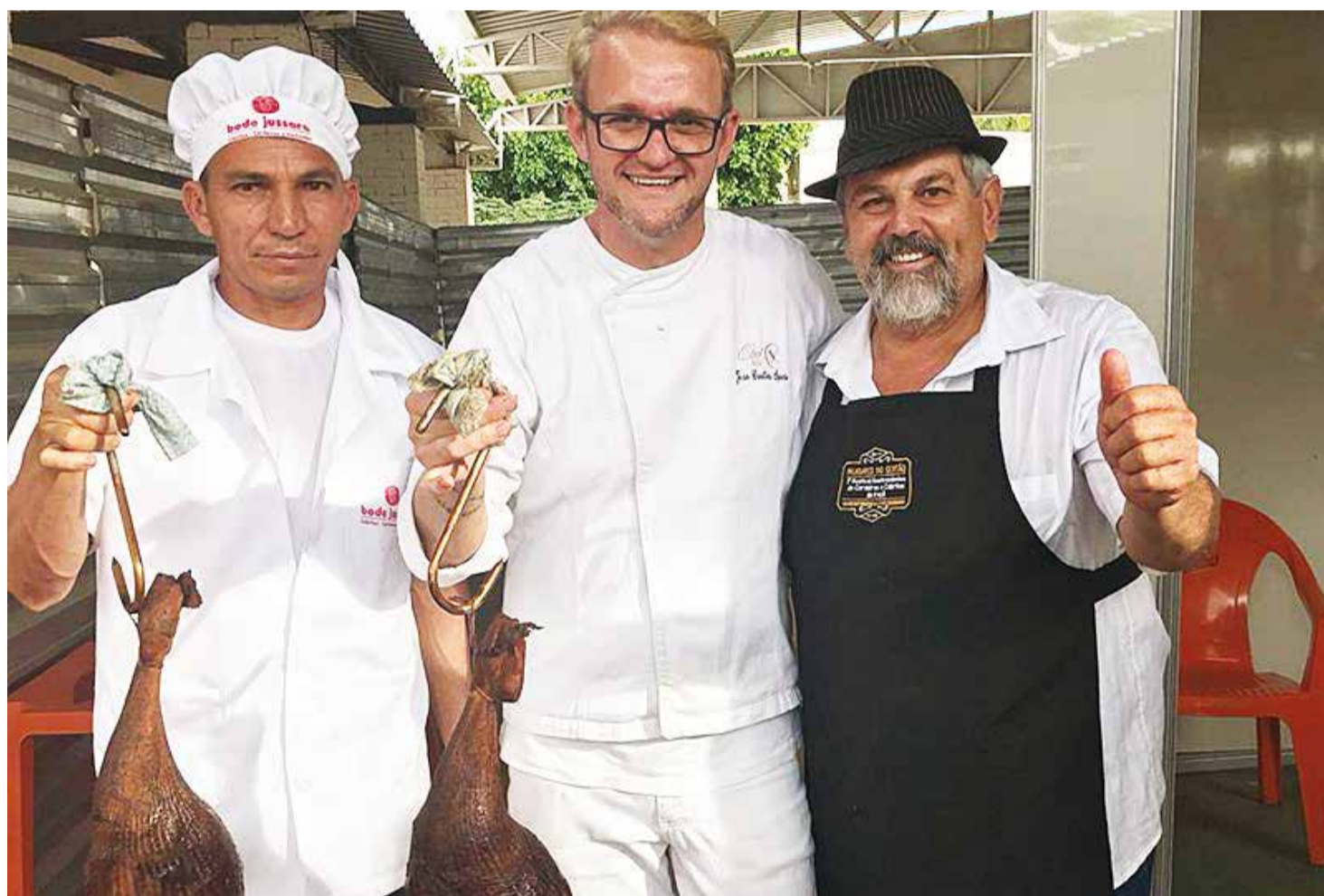
Convidado: criador tem participado de importantes eventos nacionais, como o Festival Gastronômico de Cordeiros e Cabritos Irecê, na Bahia

apenas nos cortes básicos", consta na obra.