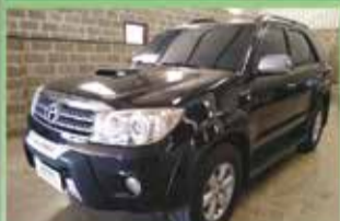
SW 4 SRV Top Automática Ano 2010