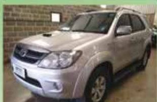
SW 4 SRV Automática Ano 2007