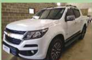
S 10 C Dupla High Country Automática Ano 2018