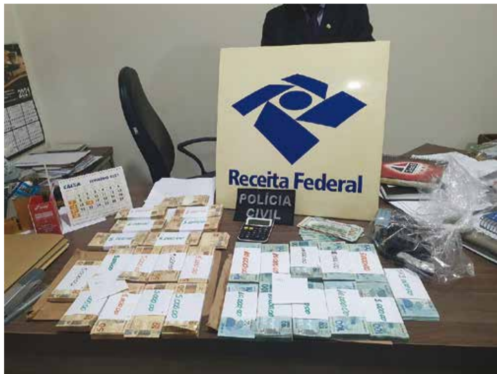
Valores: grande quantidade de dinheiro foi localizada pelas equipes da Receita Federal

Quanto às empresas destinatárias das notas fiscais falsas no Paraná, a estimativa é que elas tenham acumulado créditos tributários fraudulentos de aproximadamente R$ 100 milhões, considerando que receberam cerca de R$ 1 bilhão em notas frias.