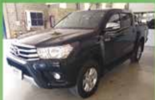
Hilux SRV Automática Ano 2017