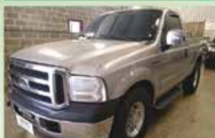
F 250 XLT 4.2 Diesel Ano 2000