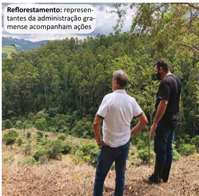
Reflorestamento: representantes da administração gramense acompanham ações