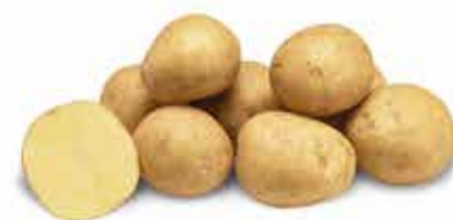
Corsica Cultivar semitardia

Tubérculos redonda oval, com calibre muito uniforme e um alto teor de matéria seca (21,26%). Possui pele e polpa amarela. Possui dormência média e pode ser armazenado por médios períodos