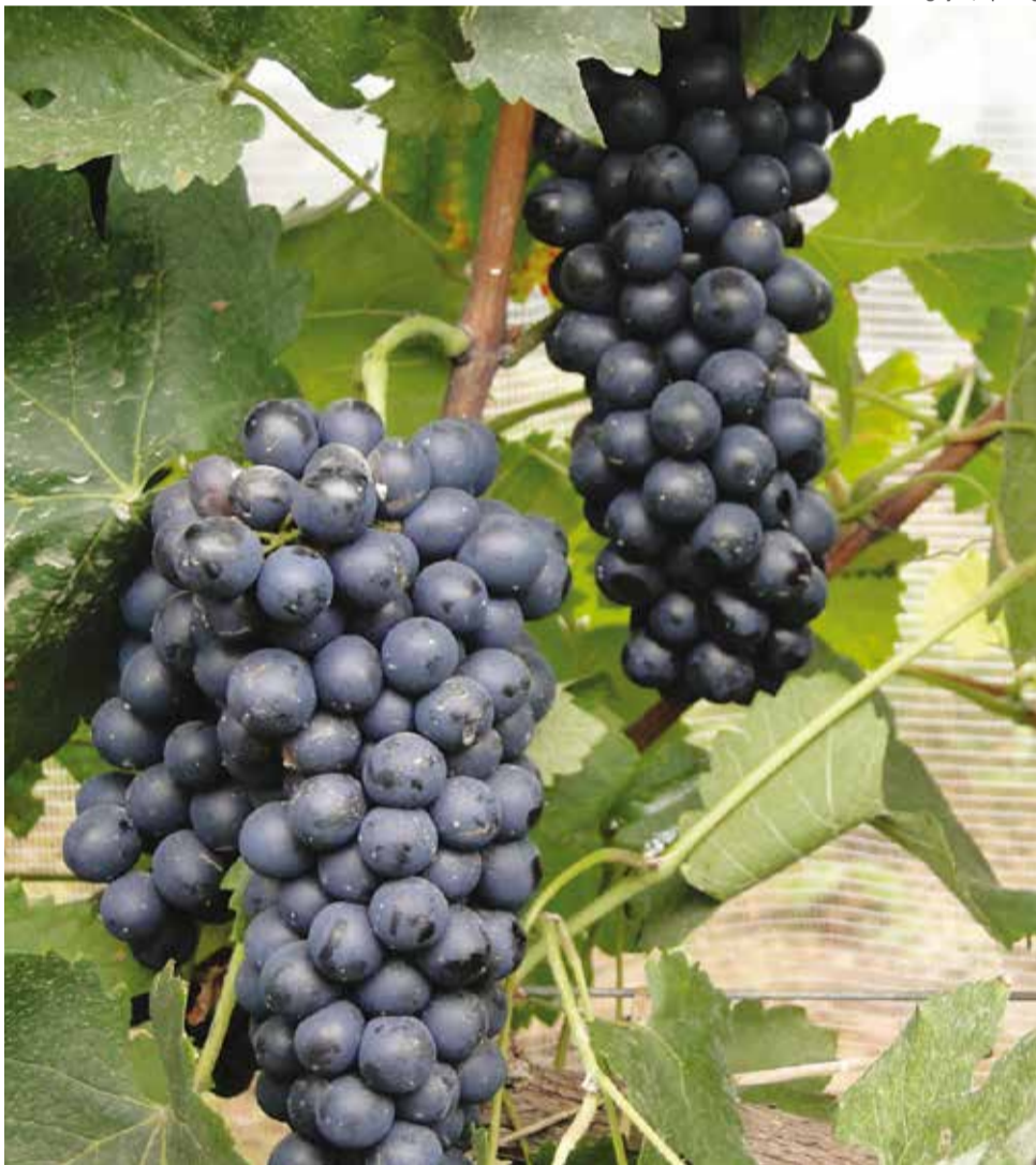
Syrah: estudos acompanharam o desempenho agrônomo e enológico da variedade durante três safras