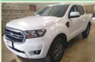
Ranger XLS 2.2 Automática Ano 2020

www.comercialgomes.com comercialgomes.cb@bol.com.br