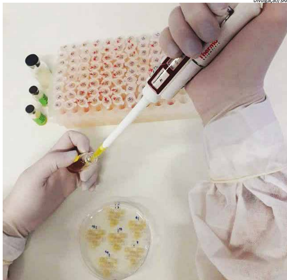
Exames: análises atestam que as aves estão livres de influenza aviária e laringotraqueite