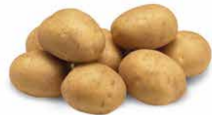
Alicante Cultivar semitardia

Confira nossas novas Cultivares destinadas ao mercado de fritura