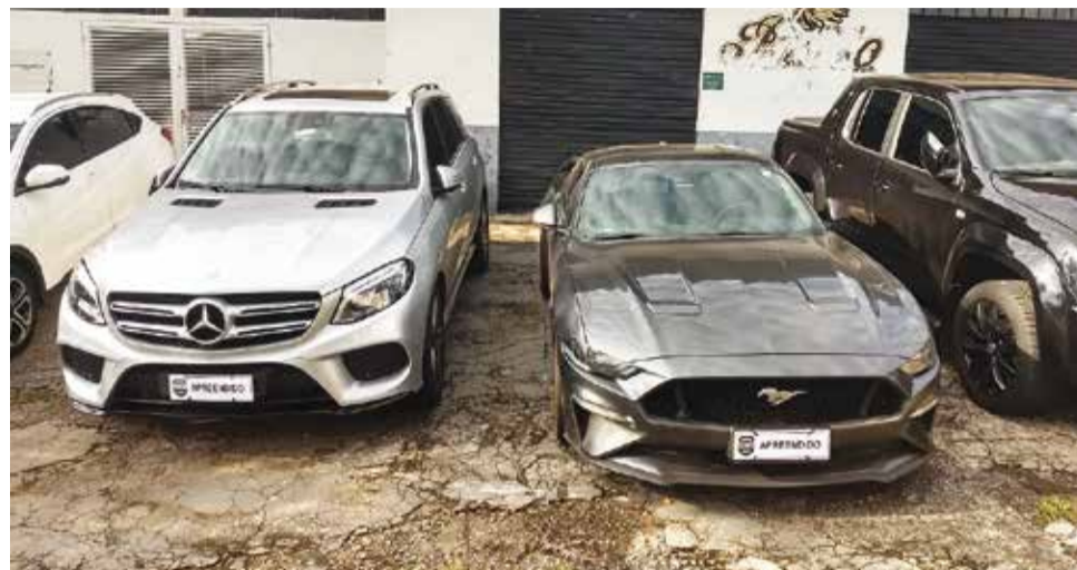
Frota: vários veículos foram apreendidos durante a operação deflagrada em março

Sobre o valor fraudado, ainda devem ser acrescentados 60% de multa, correção monetária e juros, fazendo com que o valor devido aos cofres paranaenses chegue a cerca de R$ 200 milhões.