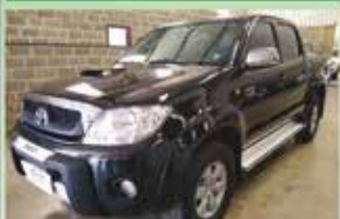
Hilux SRV Automática Ano 2010