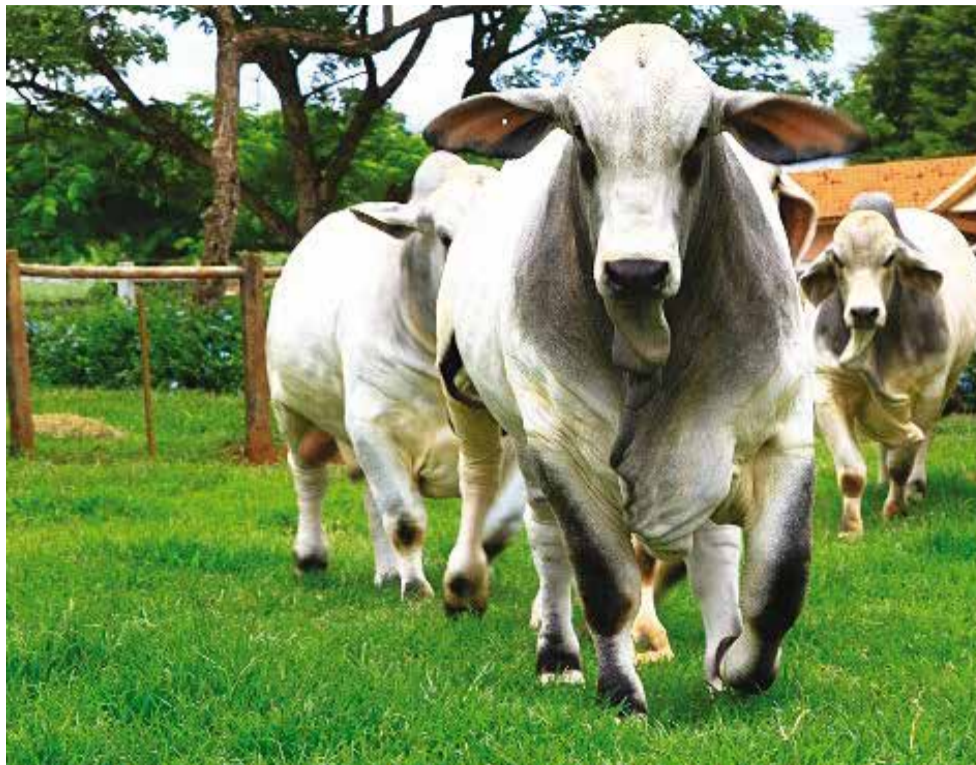
Mercado: Brahman é a segunda raça de corte brasileira que mais exporta sêmen

Seja no exterior ou no Brasil, o pecuarista tem procurado cada vez mais encurtar o ciclo de produção para tornar a pecuária um negócio rentável. Quem pretende trabalhar nessa linha precisa