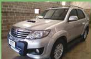
SW 4 SRV Top Automática Ano 2012