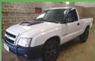
S 10 Colina 4x2 Ano 2011

COMERCIAL GOMES DOTA VEÍCULOS E MÁQUINAS AGRÍCOLAS VENDAS - COMPRAS - CONSIGNAÇÃO