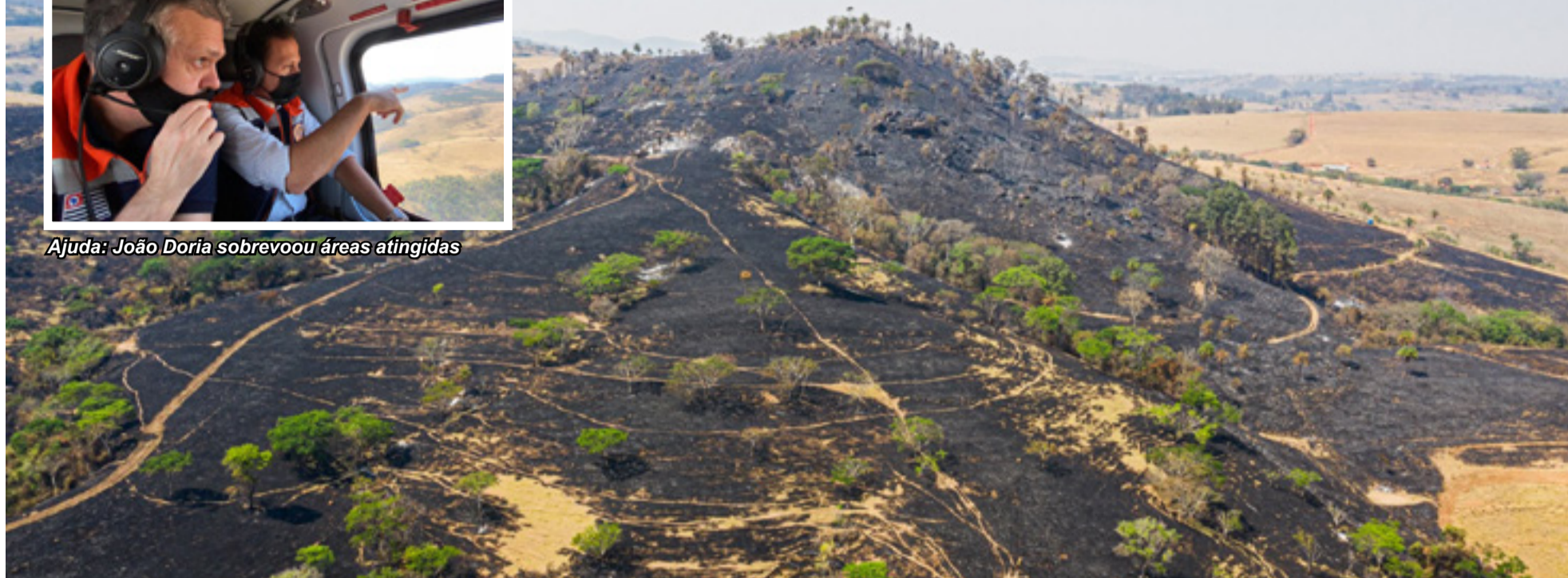
Rastro de destruição: foto aérea da Fazenda Rio Claro, que fica aos pés da Serra da Paulista

Diante de tamanha destruição, o governador João Doria (PSDB) esteve na quinta-feira (10) em visita à região e sobrevoou os pontos em chamas em Águas da Prata e na Serra da Paulista. Logo em seguida, ele foi para o Aeroporto Regional Joaquim Simião, em São João da Boa Vista, onde foi recebido por autoridades locais e da região. Em coletiva à imprensa, o governador anunciou a vinda de reforços