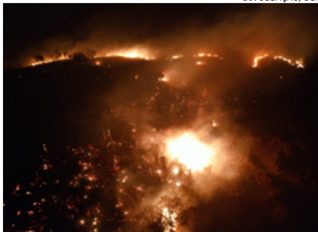
Vargem: fogo consumiu área próxima ao Barro Preto