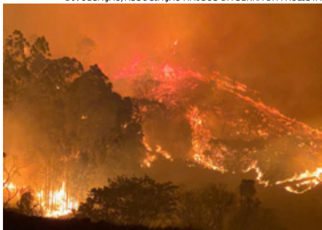
São João: incêndio atingiu Serra da Paulista