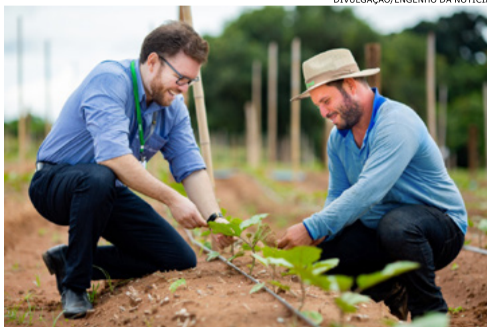
Plano Safra: linha de financiamento permite custear atividades com subsídio do Governo Federal

Segunda maior instituição financeira liberadora do Plano Safra, o Sicredi deve liberar R$ 22,9 bilhões nesta safra, número 10% superior à anterior, totalizando 227 mil operações. As agências já estão recebendo as propostas de financiamento para o plano,