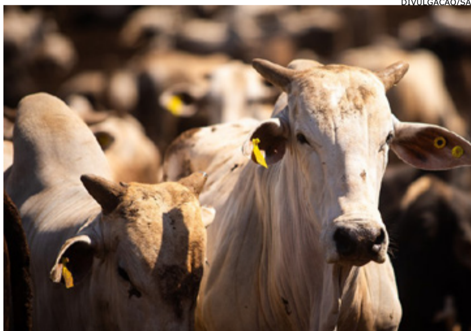
Imunização: programa alcançou os maiores índices de cobertura vacinal