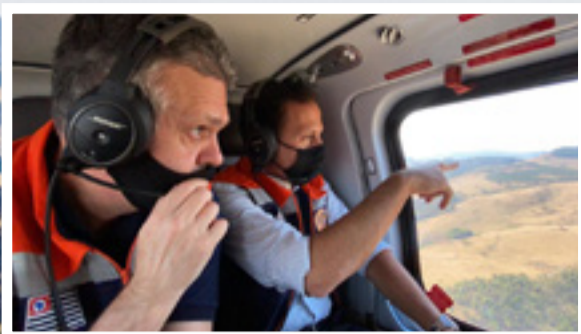
Ajuda: João Doria sobrevoou áreas atingidas