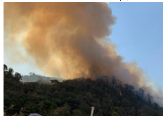
Prata: área verde voltou a queimar no domingo (13)

Uma verdadeira força-tarefa tem sido feita para conter os incêndios que atingem às serras de Águas da Prata, São João da Boa Vista e Vargem Grande do Sul. Os focos ocorreram no início do mês e ganharam grandes proporções, destruindo áreas verdes, atingindo propriedades rurais e causando um grande temor de quem mora próximo das regiões atingidas na zona rural.