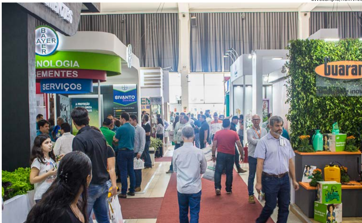
Em 2019, Hortitec reuniu cerca de 400 expositores, atraindo mais de 29 mil visitantes

"Lamentamos muito ter que tomar esta decisão, causada por motivos de força maior, mas neste cenário atual com relação à evolução desta pandemia, preferimos adiar a 27ª edição, evitando desta forma mais indefinições para expositores, visitantes, prestadores de serviços e demais parceiros e fornecedores, facilitando desta forma o planejamento de suas empresas e o foco em suas prioridades", informou a Comissão Organizadora da Hortitec, em nota divulgada à imprensa. "Salientamos que é de suma importância seguirmos todas as orientações