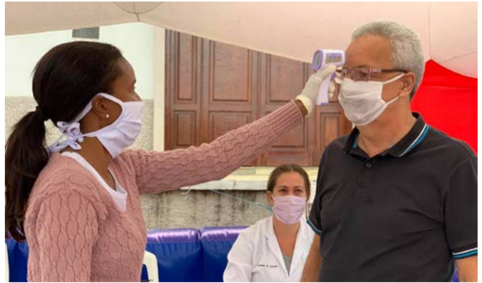
Cuidados: consumidores têm temperatura aferida nas feiras

res Familiares de Pinhal (Cafesp) e da Associação dos Hortifrutigranjeiros da Mogiana e Sul de Minas (Ahgracalem). De acordo com o decreto, os feirantes têm que disponibilizar álcool em gel ou álcool 70% para os consumidores e trabalhadores, além de organizar as filas de clientes de forma que mantenham sempre a distância mínima de dois metros e adotar condições de higiene e asseio, bem como realizar a limpeza e higienização das bancas, utensílios e produtos comercializados. O decreto ainda proíbe a realização de