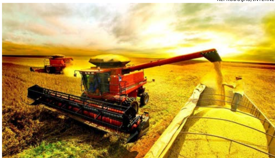
Plano Safra: Sicredi já está recebendo as propostas de financiamento

"A atuação do Sicredi na cadeia do agronegócio tem suas raízes na sua fundação, em 1902. Investimos incessantemente na oferta de crédito e serviços para as empresas e produtores rurais, contribuindo com a sustentabilidade e o desenvolvimento das economias locais. O associado que obtém financiamentos para o seu empreendimento