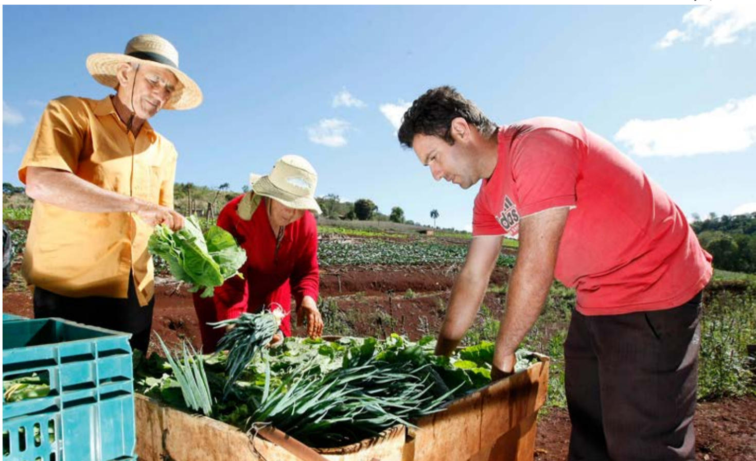
Entre os pontos positivos da medida provisória, está a possibilidade da abertura de crédito com taxas de juros menores

Entre os pontos positivos da medida provisória, está a possibilidade da abertura de crédito com taxas de juros menores (de até 3,75% ao ano). "Nosso maior objetivo é apoiar a estabilidade de funcionários durante a pandemia, manter os empregos e a renda dos trabalhadores, pois a empre-