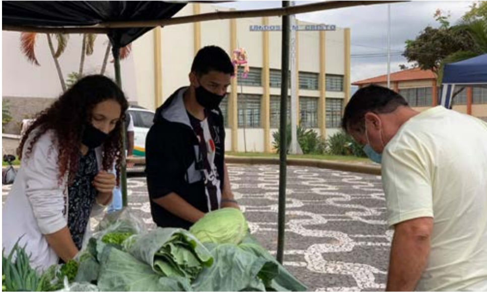
Agronegócio: feiras reúnem agricultores familiares de Pinhal