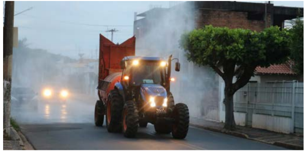
Atendimentos serão realizados por equipe reduzida com agendamento prévio

Diante desta parceria, a Prefeitura de Aguai agradece a todos os agricultores, proprietários, servidores municipais, colaboradores que se dedicaram em prol do município, assim como a equipe da Sabesp (Companhia de Saneamento Básico do Estado de São Paulo), além das Polícias Militar e Rodoviária e a Guarda Civil Municipal. "Aos produtores que estão iniciando suas colheitas o nosso desejo de uma excelente safra. Essa ação com certeza entrou para a história da cidade. A todos envolvidos,