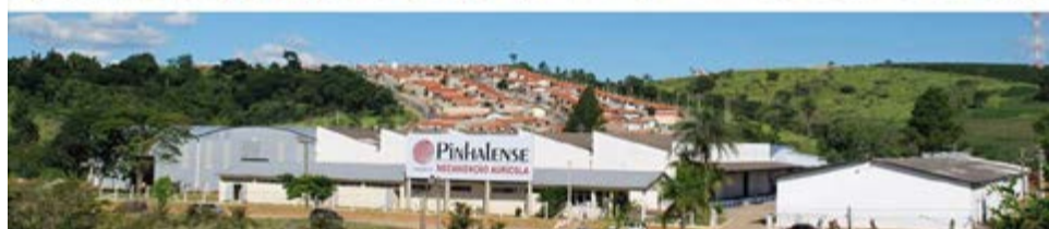
Pinhalense: suas três unidades fabris somam mais de 60 mil m 2 de planta industrial

ele seja vendido por um preço maior. A pré-limpeza e o secador da Pinhalense permitem inclusive que se adicione uma safra à propriedade por ano, aumentando o lucro anual do produtor, pelo fato de diminuir o tempo da cultura. Além do fato de conseguir colher em épocas de chuva, sem perder o produto.