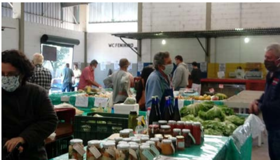
Proteção: uso de máscaras e álcool em gel foi adotado na feira

Para que a Feira do Produtor pudesse retornar – foram cinco semanas paradas logo após o anúncio da quarentena –, houve um intenso treinamento com os