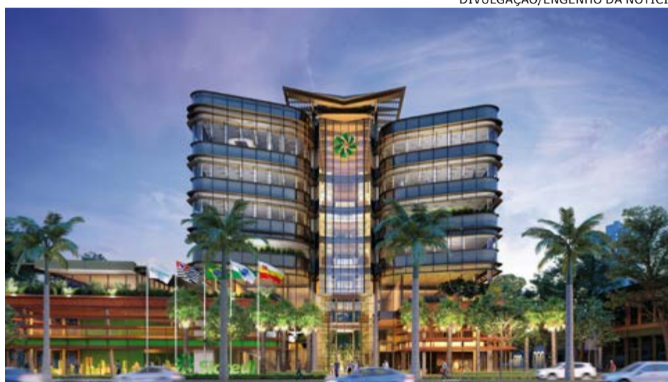
Sede: tecnologias implantadas buscam obter a certificação Leed Platinum

Como em 5 de junho celebra-se o Dia Mundial do Meio Ambiente, a Sicredi União listou as práticas sustentáveis que adota, entre elas a construção da nova sede, em Maringá (PR), que será concluída no final de 2021. Com duas torres e sete andares, a obra privilegia a incidência solar, ventilação cruzada e terá áreas destinadas ao uso da comunidade, creche para filhos dos colaboradores, bicicletário, entre outros. O projeto, que tem uma rígida gestão de resíduos, inova ao implantar tecnologias sustentáveis que viabilizarão a busca pela certificação Leed Platinum, chancela máxima de sustentabilidade no mundo. Já as agências contam com tecnologias que contribuem com a redução de consumo de água em torneiras e vasos sanitários, e diversas têm sistema de captação de energia solar. Na Superintendência Regional (Sureg) o uso de plásticos descartáveis foi suspenso e há sistema de automação