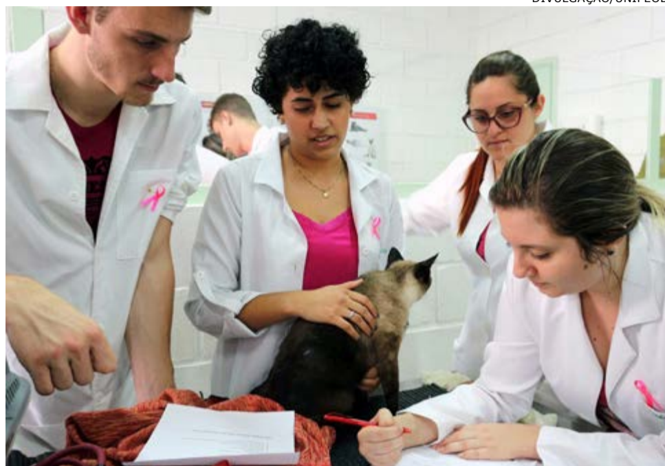
Atendimentos serão realizados por equipe reduzida com agendamento prévio

Casos de urgência e emergência serão atendidos conforme a disponibilidade da equipe. Os agendamentos devem ser realizados pelos telefones (19) 3634-3205 ou 3634-3206 (pequenos animais) e (19) 99987-4606 (grandes animais).