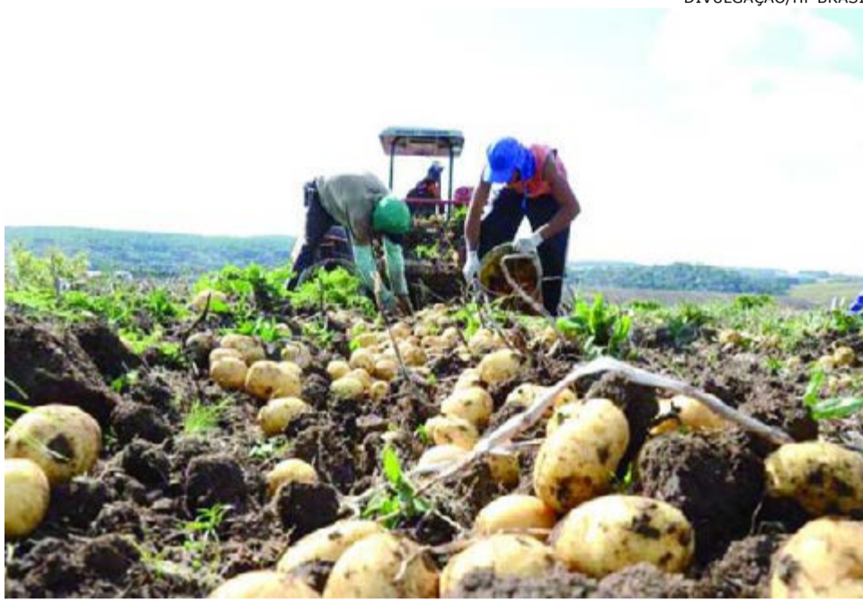
Safra: bataticultura atrai grande número de trabalhadores rurais de outras regiões do país

De acordo com o decreto, os empregadores ou até mesmo os agenciadores de mão de obra, antes da contratação dos trabalhadores rurais – que irão atuar tanto na colheita como no bene-