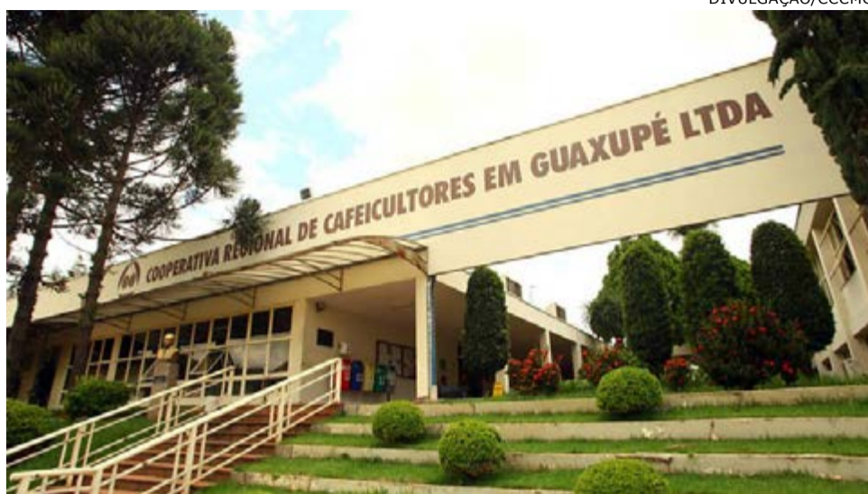
Cooxupé: instituição vem atuando direta e positivamente nas comunidades onde está presente

A Cooxupé explica que a metade da doação – R$ 1 milhão – contemplará hospitais locais de cidades onde a cooperativa atua e registra volume de recebimento de café, beneficiando mais de 70 municípios das regiões do Sul de Minas, Cerrado Mineiro e na região do Rio Pardo no Estado de São Paulo. Já a outra metade seguirá para hospitais regionais elencados, levando em consi-