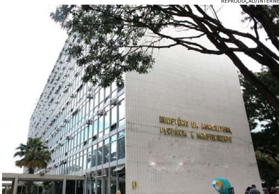
Ministério analisou questões de abastecimento interno e de mercado em vários países com o que Brasil mantém relação comercial

Entre as tendências apontadas pelos adidos para o pós-pandemia está a administração do comércio agrícola com aumento das tarifas e barreiras não tarifárias reduzidas quando há temor de desabastecimento, inclusive com a facilitação dos procedimentos para habilitação de exportadores, e retorno a graus elevados de proteção e subsídios quando conveniente, como forma de estimular as