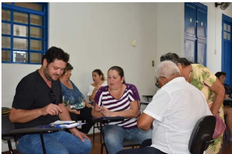
Alunos serão capacitados para trabalharem potencial turístico das propriedades rurais