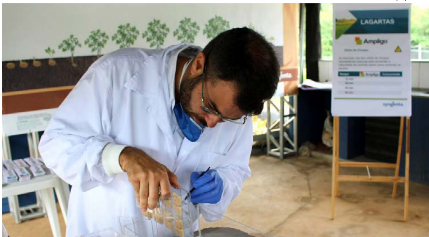
Estação Conhecimento: capacitação foi focada nas culturas de batata e tomate

Outros benefícios são as pesquisas e projetos que ligam os futuros engenheiros à parte operacional da agricultura. "Mais do que isso, há o net-