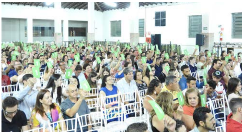
Encontro reuniu mais de 400 cooperados na SBB

A Sicredi União PR/SP promoveu no dia 5 de fevereiro a sua assembleia de prestação de contas em Vargem Grande do Sul. O evento foi realizado na Sociedade Beneficente Brasileira (SBB) e contou com a participação de aproximadamente 400 cooperados.