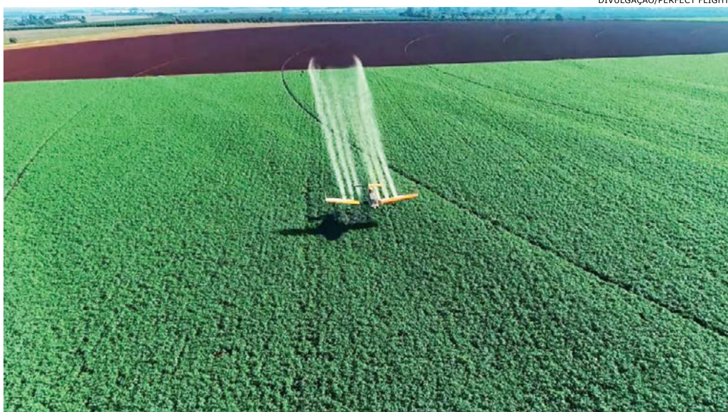
Perfect Flight: projeto de monitoramento e gestão de pulverização aérea é o maior até então implantado no mundo

Perfect Flight, é possível estabelecer melhores índices de assertividade na aplicação de defensivos agrícolas, por meio de dados que ajudam a preservar recursos naturais e a evitar desperdícios de produtos e o excesso no uso de defensivos.