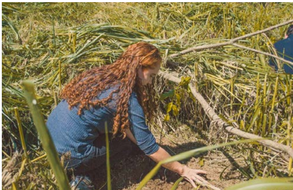
Preservação das nascentes: Iniciativa contará com o plantio de mudas

Ação é desenvolvida pela ong internacional The Nature Conservancy em parceria com a administração municipal