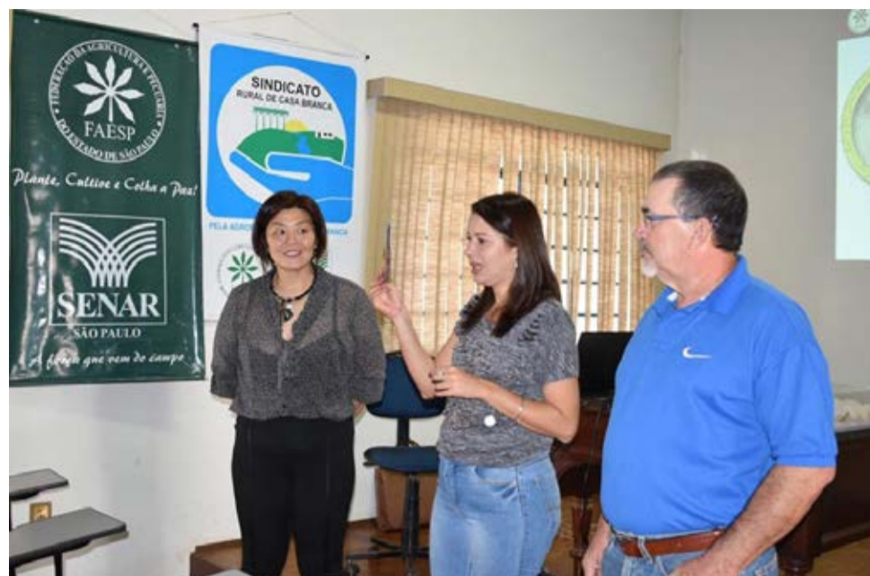
Curso é uma iniciativa da prefeitura em parceria com o SENAR e o Sindicato Rural

Por meio de uma parceria com o Serviço Nacional de Aprendizagem Rural (SENAR) e o Sindicato Rural, a Prefeitura de Casa Branca iniciou a nova turma do curso de Turismo Rural. A atividade teve início no dia 9 de março e conta com a participação de aproximadamente 15 participantes, dentre produtores rurais e interessados.