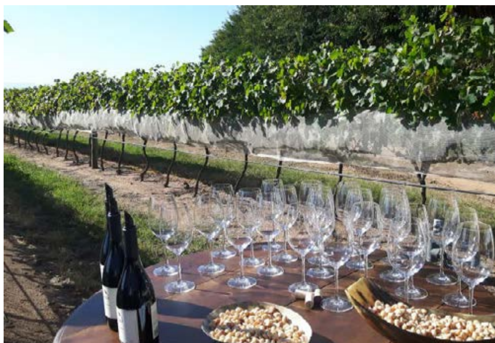
Espírito Santo do Pinhal tem atraído os amantes do vinho de qualidade