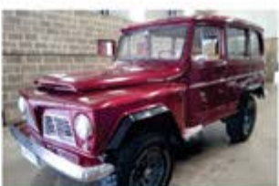
RURAL WILLYS IMPECÁVEL ANO 1975