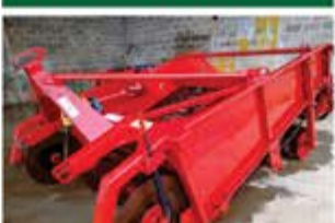
ARRANCAR BATATA 2 LINHAS ANO 2016