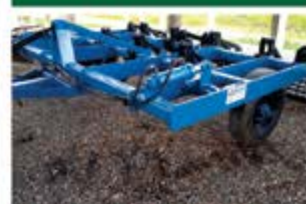
SUBSIDIADOR AST MATC 7 HASTES COM BOLD DISTORRIDOR MARCA TATU