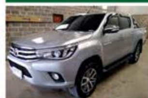
HILUX SRX AUTOMÁTICA ANO 2016