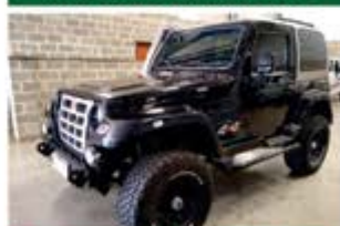
TROLLER T4 COMPLETO ANO 2010