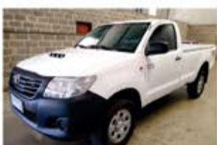
HILUX SRV MECÂNICA ANO 2013