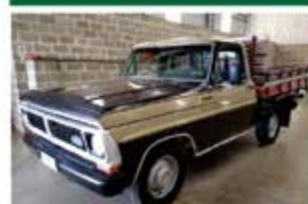
F1000 CARROCERIA 1984