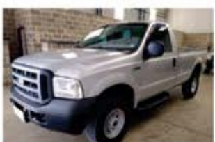
F 250 XL MAXX POWER ANO 2008