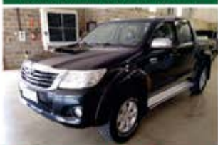
HILUX SRV AUTOMÁTICA ANO 2013