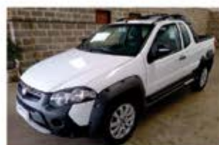
STRADA ADVENTURE ANO 2014

ROD. SP 340 S/N KM 237 - BAIRRO INDUSTRIAL - CASA BRANCA - SP