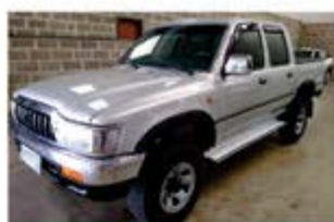
HILUX SRV MECÂNICA ANO 2002