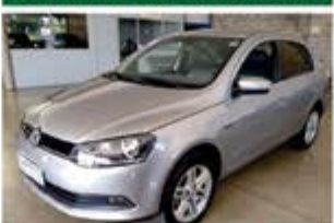
VOIAGE AUTOMÁTICO ANO 2016