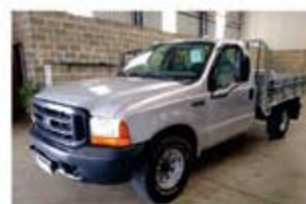
F 350 CARROCERIA ANO 2005