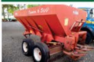
CARRETA CALCÁRIO 6500JAN