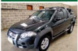
STRADA ADVENTURE ANO 2012