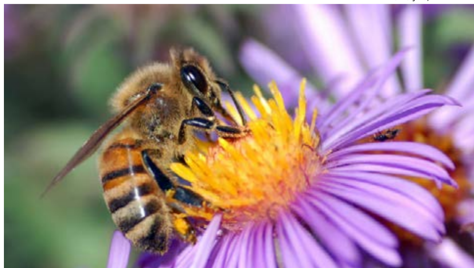
Perfect Flight: tecnologia permite identificar em momento real se o defensivo foi aplicado em local inadequado ou próximo das abelhas

Para conseguir acompanhar todas as atividades no campo, as agtechs são grandes aliadas, uma vez que, em muitos casos, apenas a tecnologia consegue dimensionar o trabalho do homem nas propriedades rurais. No caso da Perfect Flight, um sistema computacional capaz