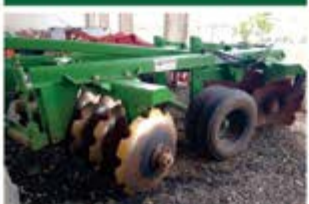
GRADE ARADORA 14 X 32 TATU ANO 2016