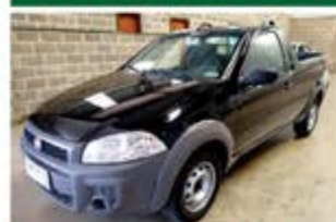
STRADA WORK ANO 2016