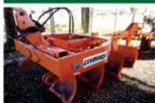
ARADO AIVECA REVERSÍVEL ANO 2018