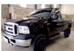
F 250 XLT MAXX POWER 4X4 ANO 2010