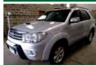
SW 4 SRV TOP 7LUG AUTO ANO 2010