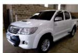
HILUX SRV TOP AUTO ANO 2013