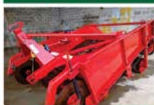
ARRANCADEIRA BATATA 2 LINHAS ANO 2014