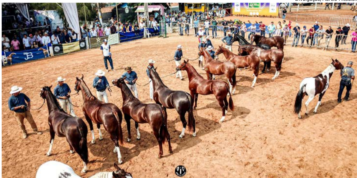
Vista geral do julgamento do Grande Campeonato Nacional Potro