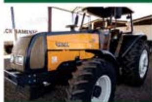
TRATOR BM 110 ANO 2003