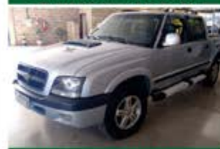
TRATOR BM 110 ANO 2003