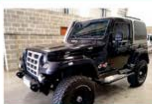
TROLLER T4 4X4 COMP ANO 2010