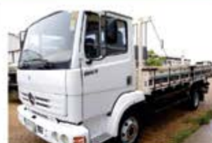
CAMINHÃO 914C ANO 2002

ROD. SP 340 S/N KM 237 - BAIRRO INDUSTRIAL - CASA BRANCA - SP