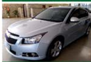
HILUX SRV TOP AUTO ANO 2015