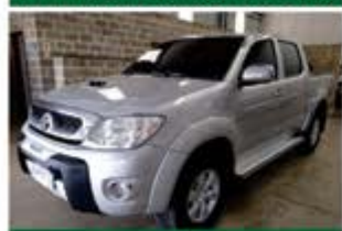
HILUX SRV 3.0 AUTO ANO 2010