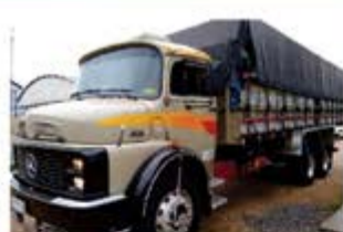
CAMINHÃO 1518 TRUCK ANO 1987