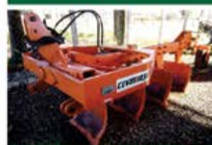
AACR 4 AIVECAS ANO 2018