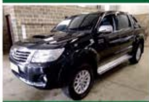
HILUX SRV TOP AUTO ANO 2015