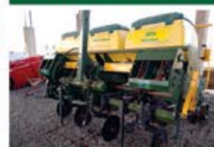
PLANTADEIRA PST PLUS 7/4 ANO 2005