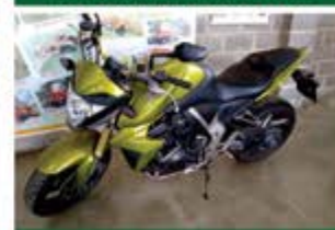
MOTO CB 1000R ANO 2012