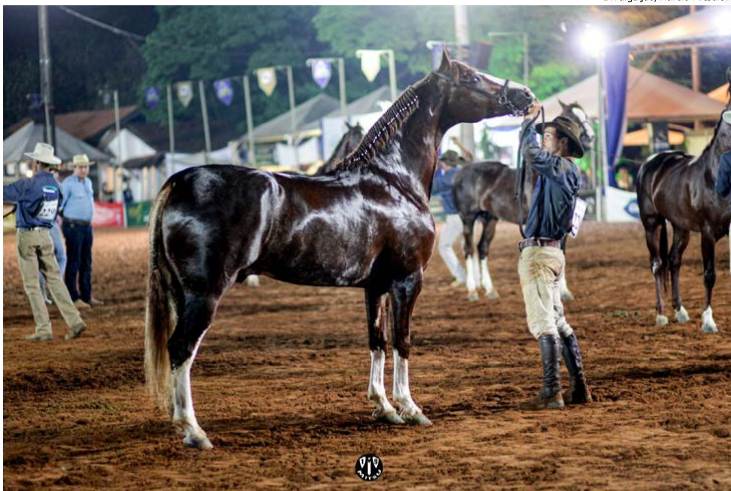
Diamante do Gadu foi eleito Grande Campeão Nacional Cavalo