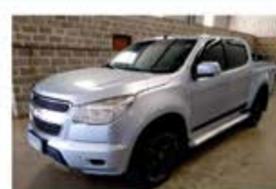
S 10 LT MECÂNICA ANO 2013