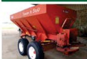
CARRETA CALCÁRIO 6500JAN