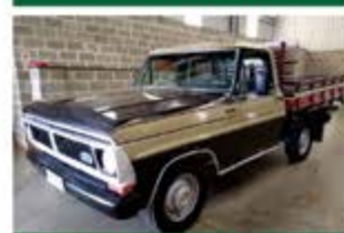
F 1000 CARROCERIA ANO 1984