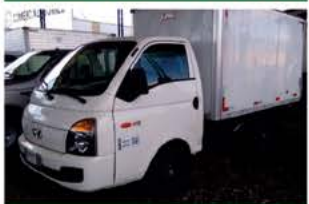
HR COM BAÚ ANO 2013