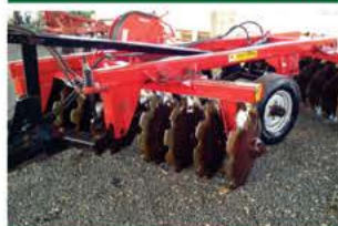
GRADE ARADORA INTERMEDIÁRIA 20 X 28 X 270MM