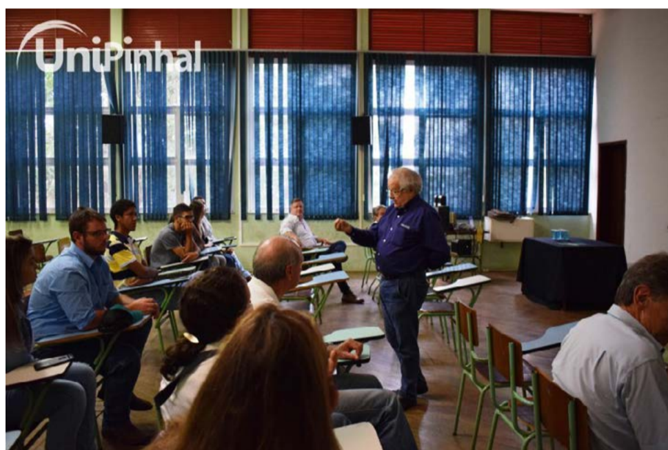
Alunos de Engenharia Agrônômica da UNIPINHAL ficaram por dentro do panorama atual do mercado

No final das palestras, alunos com melhor desempenho acadêmico foram premiados com um convite para participarem do próximo VIII Fórum Internacional de Tecnologia em Nutrição de Plantas, realizado em Campinas. Na ocasião, os estudantes foram acompanhados