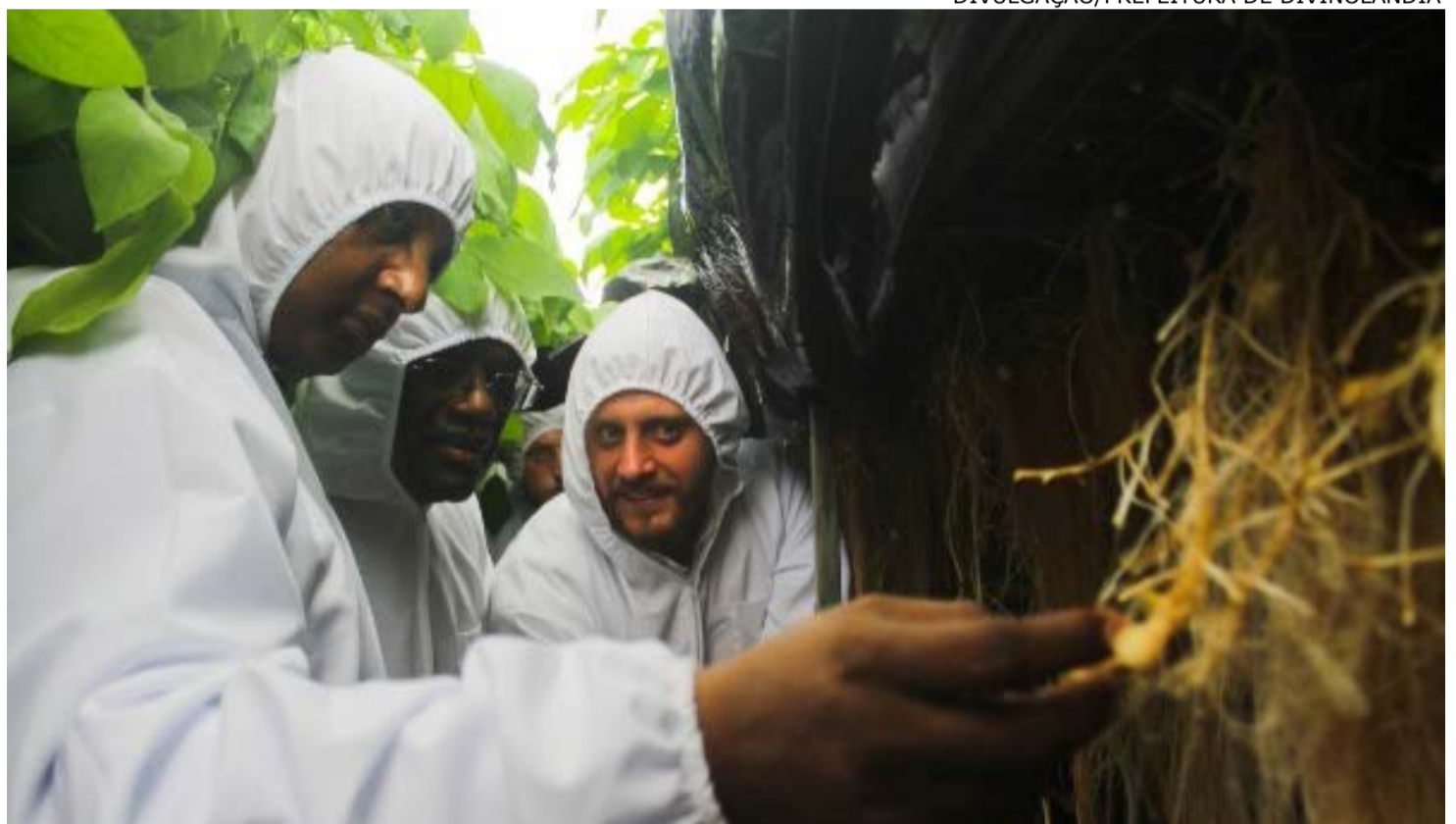
Autoridades da Etiópia ficaram surpresas com tecnologia utilizada pela CBA Sementes

A CBA Sementes empodera os produtores de batata para aumentar sua rentabilidade e a segurança do seu cultivo, através de benefícios fitossanitários e aumento na