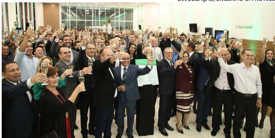
Colaboradores, convidados e autoridades brindam durante inauguração da nova agência

“Isso tudo é merecimento, resultado do trabalho que foi feito nesta agência, tanto pelos nossos colaboradores quanto pelos nossos associados. Quando abrimos a primeira agência é uma aposta, um sonho, mas quando nós reinauguramos ou criamos uma estrutura melhor, é a confiança e a