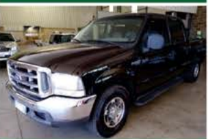
F 250 XLT C. DUPLA COMP ANO 2004