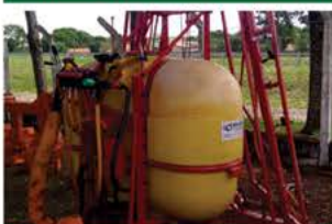
PULVERIZADOR NO 300 AUTO BARRA 14 MTS