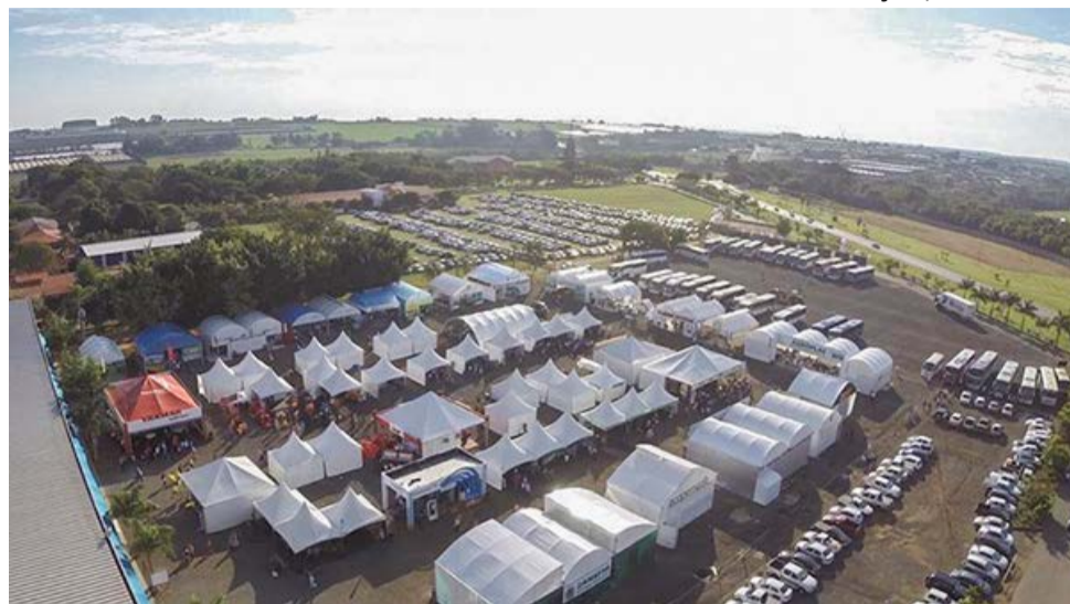
Edição 2019 reunirá 430 empresas expositoras do Brasil e do exterior

de 30 mil m 2 da exposição, produtores de hortaliças, flores, frutas, florestais, mudas, empresas e prestadores de serviços encontrarão os mais importantes fornecedores de estufas, máquinas, equipamentos e insumos diversos, as tecnologias mais inovadoras em produtos e serviços e muita possibilidade de atualizar contatos, analisar o mercado, trocar informações, se capacitar, realizar e programar negócios em curto médio e longo prazo.