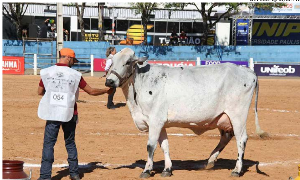
Girolando: cerca de 120 animais estarão presentes nesta edição

Já no segundo final de semana a Epic recebe a Exposição do Gado Girolando, que acontece nos dias 12 e 13 de julho, sendo que os animais começam a entrar no Recinto no dia 11.