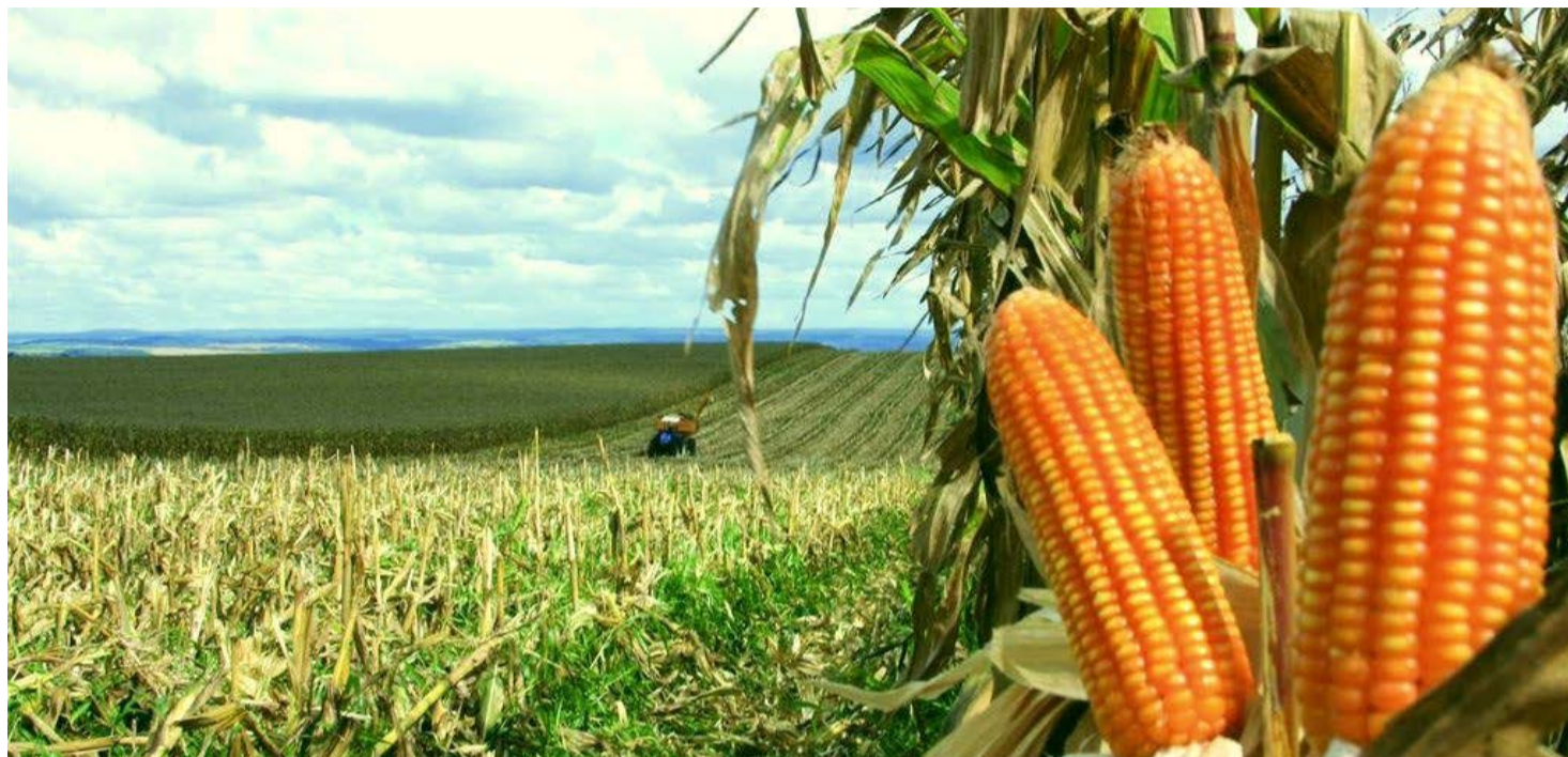
Aumento da projeção ocorre em meio a boas condições climáticas para a segunda safra

"O bom nível de investimento nas lavouras e o prolongamento da temporada de chuva faz com que