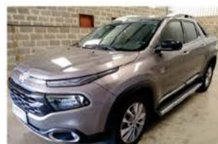
FIAT TORO VOLCANO DIESEL AUTO ANO 2019

ROD. SP 340 S/N KM 237 - BAIRRO INDUSTRIAL - CASA BRANCA - SP