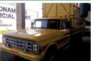
F 2000 CARROCERIA ANO 1983