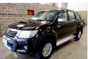
HILUX SRV 3.0 TOP AUTO ANO 2013