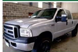
F 250 XLT SUPER DUTY 4X4 COMP ANO 2008