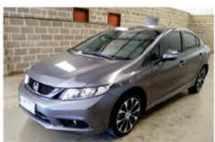
HONDA CIVIC SEDAN LXR AUTO ANO 2015