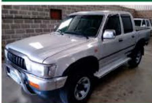
HILUX SRV 3.0 MEC ANO 2002