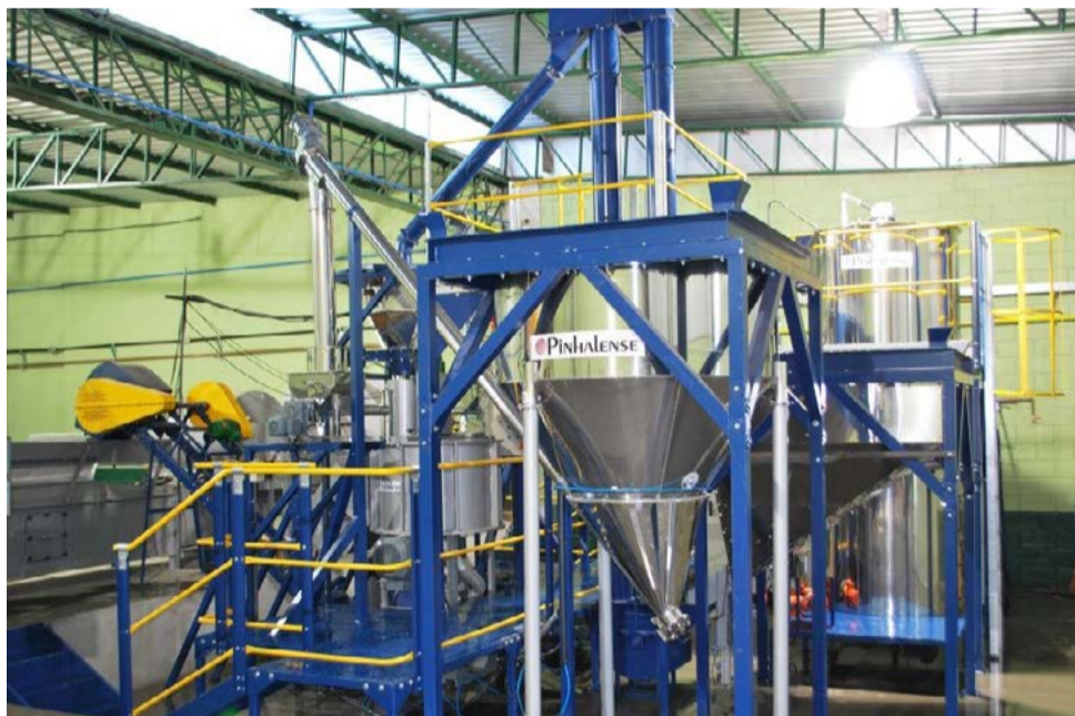
Revestidora de Sementes Pinhalense é de fácil operação

Pinhalense passou a fornecer maquinário à indústria que produz sementes incrustadas para pecuaristas, setor ainda pouco explorado no Brasil