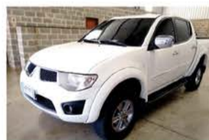
L 200 TRITON V 6 FLEX AUTO ANO 2011