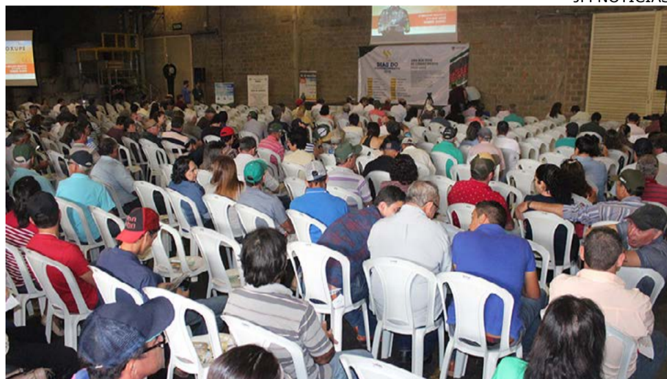
Ciclo de palestras foi realizado em todos os núcleos da Cooxupé

Além deste tema definido pela Cooxupé, cada unidade recebeu um especialista para a discussão de diferentes assuntos, levando em conta as características de cada região. De acordo com o vice-presidente da cooperativa, Osval-