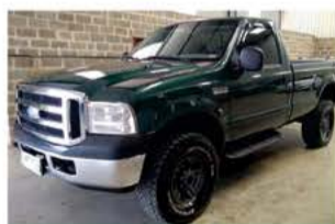
F 250 XLT SUPER DUTY 4X4 COMP ANO 2008