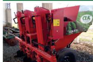
PLANTADEIRA BATATA 3 LINHAS CLK