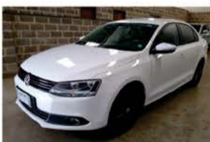
JETTA TSI AUTOMÁTICA ANO 2013