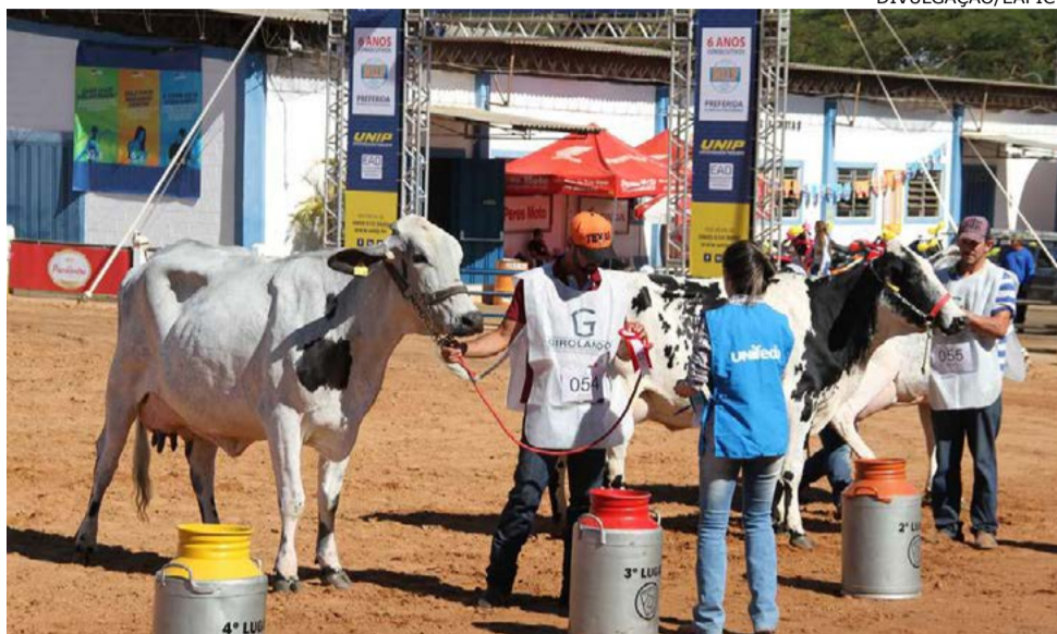
Exposição do Gado Girolando acontece em 12 e 13 de julho