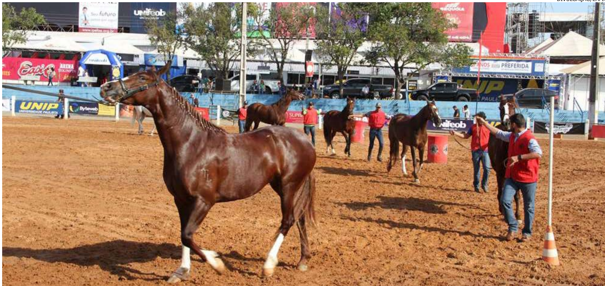
Cavalo Mangalarga é uma das atrações principais da exposição

Um dos diferenciais da Eapic (Exposição Agropecuária, Industrial e Comercial de São João da Boa Vista) é a vasta programação que oferece ao público, não permanecendo apenas aberta à noite para a realização de shows. Considerada uma das principais feiras da região, a festa sanjoanense funciona o dia todo e traz as tradicionais exposições de animais, todas ranqueadas por associações. E nesta edição de 2019 não seria diferente: três exposições irão movimentar o Recinto José Ruy de Lima Azevedo entre os dias 5 a 14 de julho.