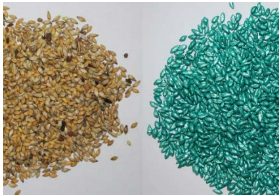
Encrustamento: sementes naturais (à esquerda) e revestidas (à direita)

A incrustação é um processo que reveste a semente, o que deixa sua superfície mais lisa e uniforme, aumentando seu tamanho