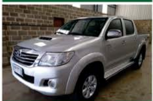
HILUX SRV 3.0 AUTO ANO 2013