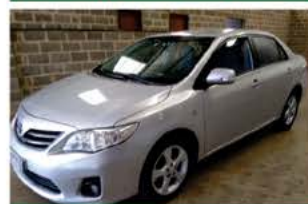
COROLLA XEI 2.0 AUTO ANO 2014