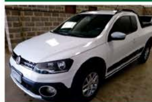
SAVEIRO CROSS FLEX COMP ANO 2015