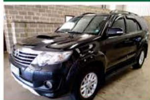
HILUX SW 4 AUTO 7G ANO 2013