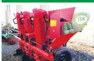
PLANTADEIRA BATATA 3 LINHAS CLK