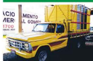
F 2000 C/ GAIOLA BOIADEIRO 1983