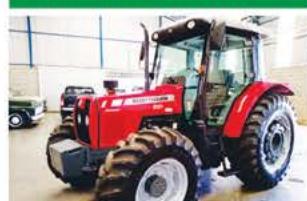
MF 291 CABINADO ANO 2010