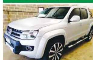
AMAROK H. AUTO ANO 2012