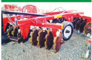
GRADE ARADORA INTERMEDIÁRIA 20X28 SANTA IZABEL