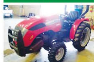
TRATOR AGRALE 4X4 ANO 2012