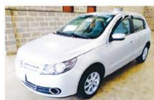
GOL SELEÇÃO 1.0 COMP 2011

ROD. SP 340 S/N KM 237 - BAIRRO INDUSTRIAL - CASA BRANCA - SP