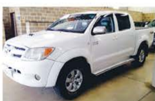
HILUX SRV MEC ANO 2008