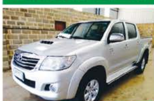
HILUX SRV 3.0 AUTO ANO 2013