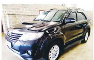
SW 4 AUTO 7 LUGARES ANO 2013