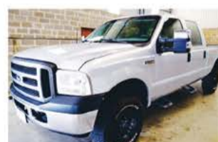
F 250 XLT C. DUPLA ANO 2008