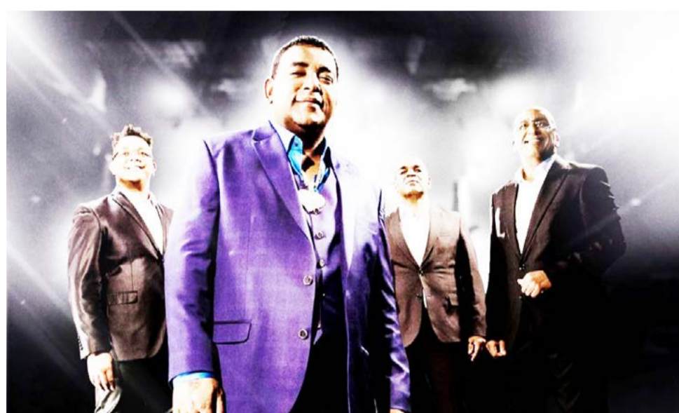
Grupo Raça Negra está confirmado entre as atrações

"Tentamos escolher a grade mais próxima do que o público pediu, com grandes nomes do sertanejo, mas também um