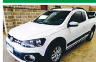
SAVEIRO CROSS FLEX COMP 2015