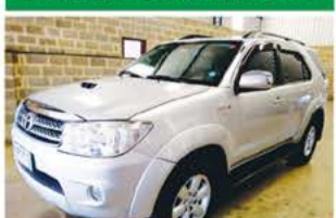
SW 4 AUTO 7 LUGARES ANO 2011