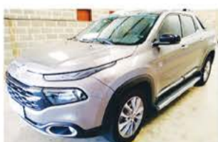
FIAT TORO VOLCANO DIESEL AUTO 2019