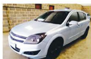
VECTRA GT MEC ANO 2011