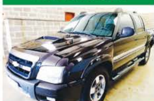
S 10 EXECUTIVA DIESEL MEC 2010