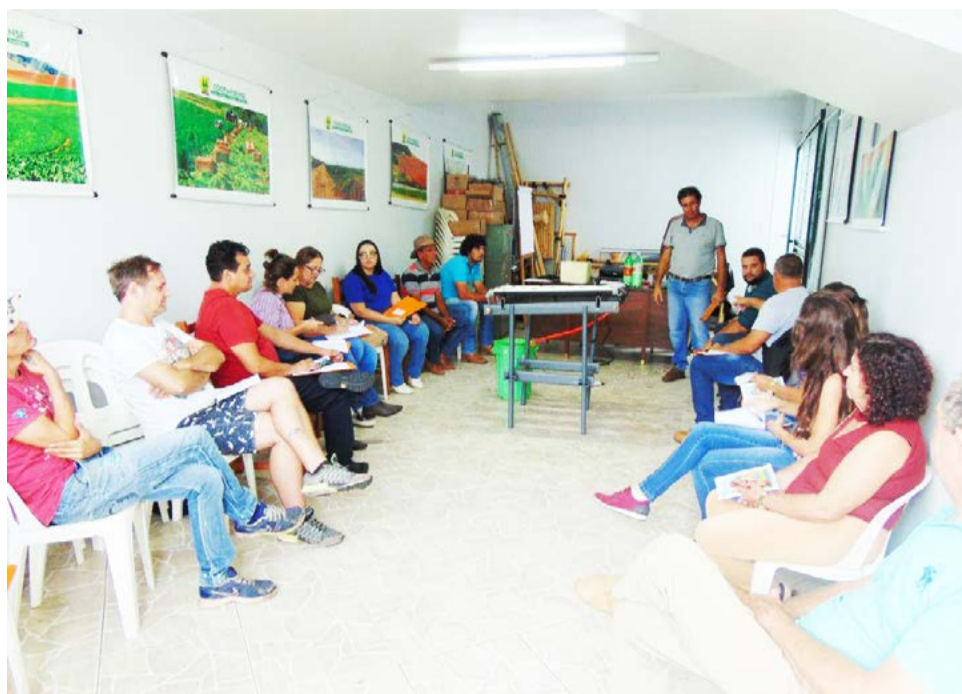
Hidroponia esteve entre os cursos promovido no próprio Sindicato Rural e aberto à produtores e à população