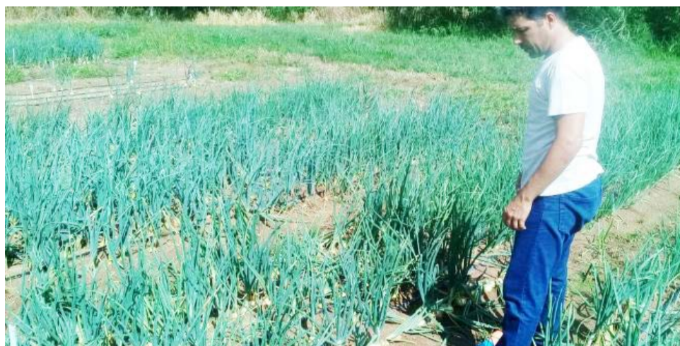
Na Fundação de Pesquisa há três variedades de cebola que, quando plantadas por muda, já demonstraram ser resistentes ao clima adverso

Ele lembrou que este ano de 2019 vem sendo considerado atípico no to-