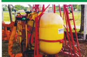
PULVERIZADOR KO 800 BARRAS 14 MTS