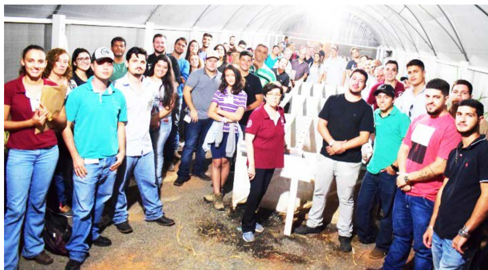
Participantes conheceram a fundo a hidroponia e suas vantagens