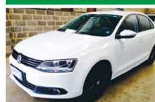
JETTA TSI AUTO ANO 2013