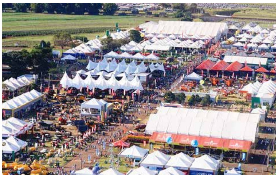
Considerada uma das maiores do mundo no segmento do agronegócio, a Agrishow atrai cada vez mais público e empresas participantes

Este lote é especial e foi criado devido ao sucesso da última edição, por isso traz uma série de benefícios, como comodidade, segurança, uma entrada mais rápida ao evento e o valor do ticket, que permanece em R$ 40,00 (mesmo valor do ano passado). A forma de pagamento também é diferenciada, podendo ser feita via boleto bancário ou via cartão de crédito – na bilheteria local são aceitos apenas dinheiro e cartão de débito. As vendas do primeiro lote estão previstas para terminar no dia 28 de fevereiro. Após essa data, haverá um novo lote, com um valor maior e mais próximo ao da bilheteria local, que será de R$ 55,00.