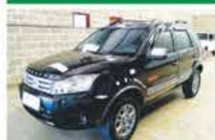
ECOSPORT XLT FREESTYLE COMP 2011