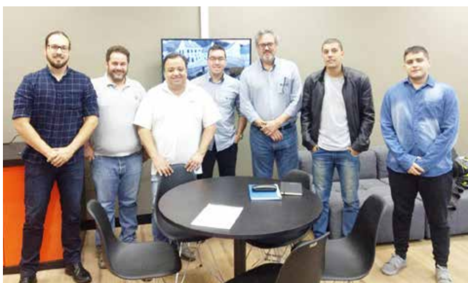
Equipe responsável pelo desenvolvimento do software

O estudo também tem como objetivo a secção de um pivô central com área de 10 ha que será instalado na Fazenda Escola da UNIFEOB, tudo isso contando com