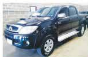
HILUX SRV AUTO COMP 2009

ROD. SP 340 S/N KM 237 - BAIRRO INDUSTRIAL - CASA BRANCA - SP