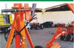
GUINCHO GIRATÓRIA 2 TONELADAS 2018