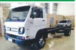
CAMINHÃO 9.150 CHASSI 2011