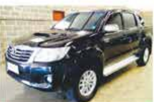
HILUX SRV TOP AUTO COMP 2015