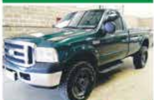
F 250 XLT C.S. 4X4 COMP 2008