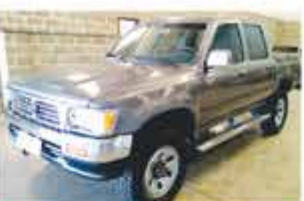
HILUX SR 5 MECÂNICA COMP 1998