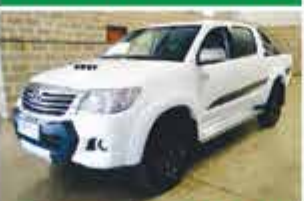
HILUX SRV TOP LIMITED AUTO 2015