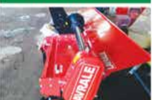
ROTATIVA 3.00 MTS LAVRALE 2019