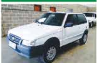
UNO WAY COMP 2013