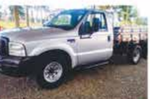
F 350 CARROCERIA MADEIRA 2009