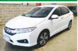
HONDA CITY FLEX AUTO COMP 2015