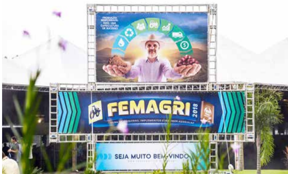
Cerca de 120 expositores participam do evento, considerado um dos principais no segmento da cafeicultura

Antes da Cooxupé idealizar a Femagri, em 1997, não havia um evento no país que proporcionasse ao produtor a oportunidade de comparar ofertas, analisar soluções, conhecer novas tecnolo-