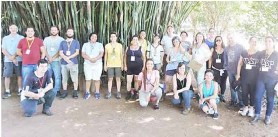
Alunos do Mestrado Profissional em Ensino das Ciências Ambientais

Visita foi realizada em parceria com a Diretoria de Cultura e Turismo, que está preparando um Roteiro Rural, com cinco rotas diferentes e será lançado nos próximos meses