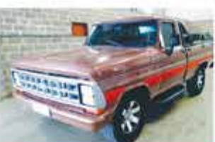
F 1000 TURBO INTERCOOLER ANO 1982