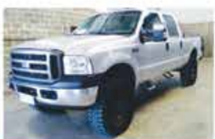
F 250 XLT MAX POWER 4X4 ANO 2008