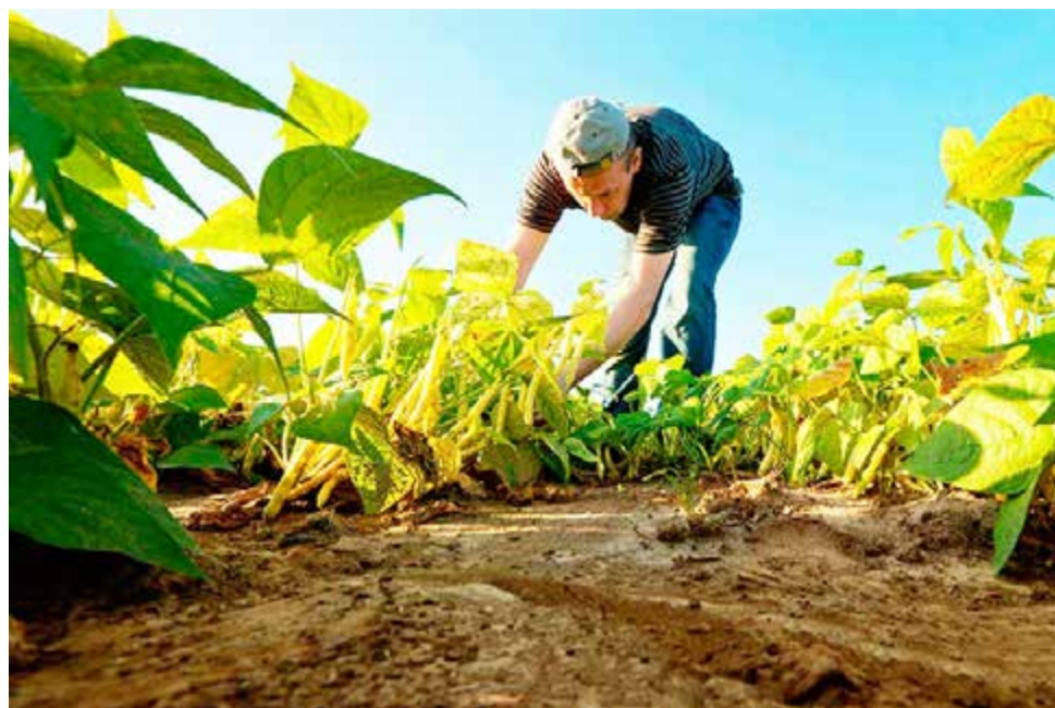
Produtor rural deve entregar a declaração até 29 de março

Os índices de participação dos municípios no produto de arrecadação são fatores utilizados no repasse do ICMS (Imposto Sobre a Circulação de Mercadorias e Serviços) do Estado. Sendo assim, quanto mais elevado o índice de participação, maior é o montante repassado pelo Estado ao município. Por meio da entrega da DIPAM,