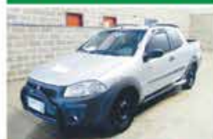
STRADA WORK C.D. FLEX COMP 2015