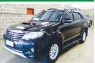
SW 4 SRV TOP AUTO COMP 2013