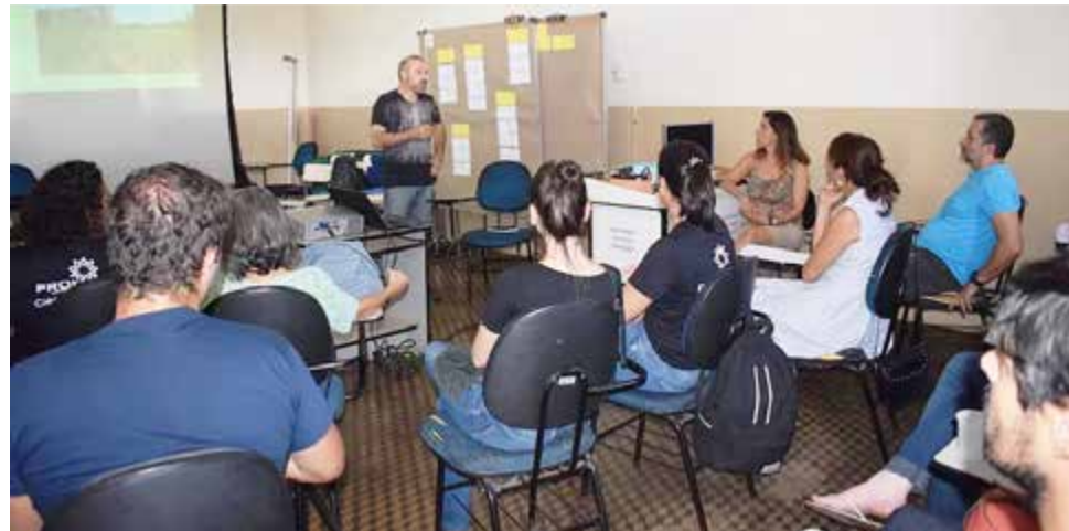
Apresentação da análise técnica ajudará com os próximos passos do Roteiro Rural

A visita dos alunos levou três dias e foi feita em sete propriedades rurais. Eles ob-