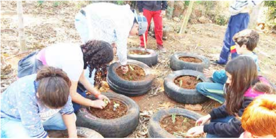
Alunos em aula prática da Escola no Campo. Projeto que é realizado em 12 cidades mineiras

Programa atendeu 270 alunos do Ensino Fundamental de 12 cidades da região de Guaxupé