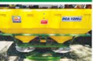
ADUBADEIRA DCA 1200 ACIONAMENTO CABO 2017