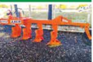
AACR 4 AIVECAS REVERSÍVEL 2018