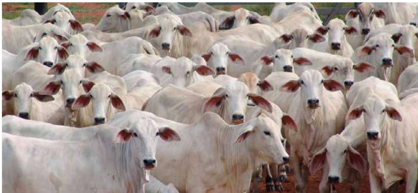
Até o dia 30 de novembro deverão ser vacinados 4,6 milhões de bovinos e bubalinos com idade de zero a 24 meses

Aproximadamente 4,6 milhões de bovídeos devem ser vacinados contra a febre aftosa em novembro