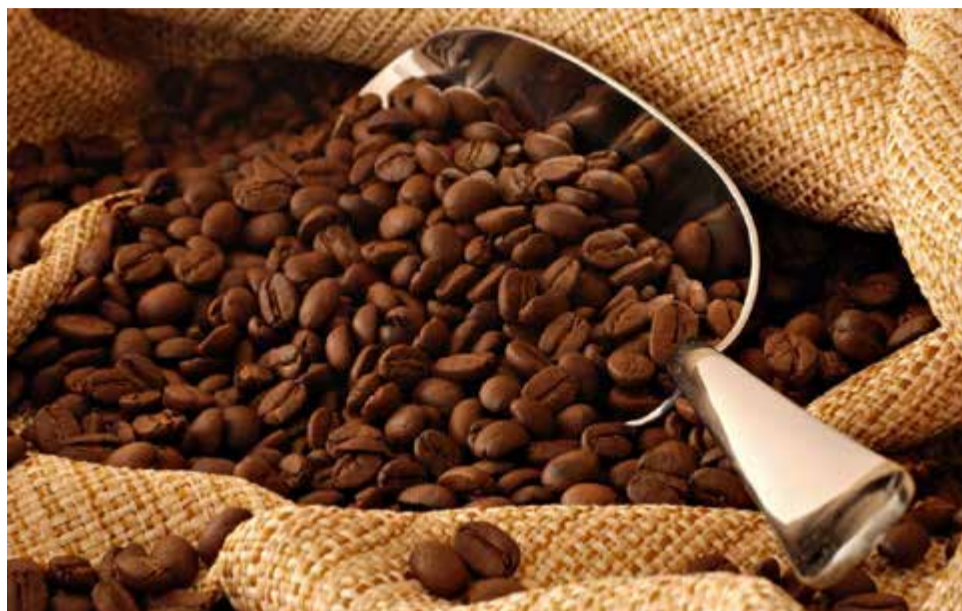
Café: produção nacional atinge 59,9 milhões de sacas, sendo 45,9 mi de arábica e 14 mi de conilon

A premiação foi entregue ao superintendente comercial da Cooxupé, Lúcio Dias, durante cerimônia realizada no Palácio do Itamaraty, em Brasília, pelo Ministério das Relações Exteriores (MRE) e pela Agência Brasileira de Promoção de Exportações e Investimentos (Apex-Brasil), em parceria com as entidades do setor privado. Estiveram presentes no evento – que celebrou o Dia In-