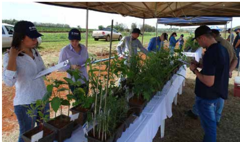
Proposta da competição é treinar os estudantes para identificar plantas daninhas

O campeonato reúne participantes de todo o Brasil e a proposta é treinar os estudantes para identificar plantas dani-