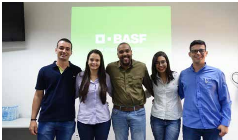
Equipe da Unifeob marcou presença em evento promovido pela BASF

Evento foi promovido pela BASF em Santo Antônio da Posse e contou com participantes de todo país