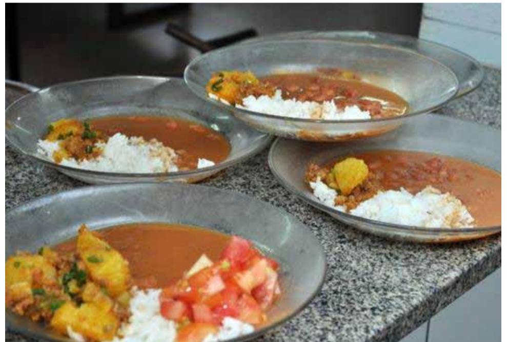
Prefeitura tem adquirido alimentos dos produtores rurais locais e da região

MATRIZ: Av. Brasil, 589 - Bairro Bela Vista - São José do Rio Pardo - SP Fone: (19) 3608-1577 www.agrovecal.com.br agrovecal@agrovecal.com.br