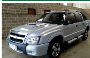
S 10 FLEX EXECUTIVA ANO 2011