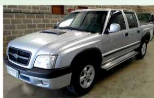
S 10 COLINA MECANICA ANO 2008