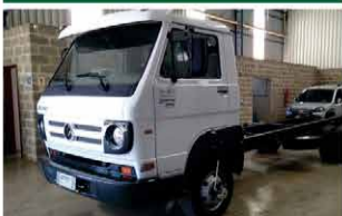
CAMINHÃO 9.150 CHASSI ANO 2011