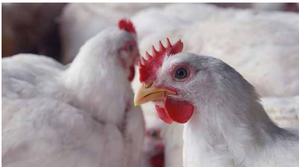
Frango vivo negociado no interior paulista tivera seu preço básico reajustado para R$ 3,10/kg

Na prática, o reajuste obtido não representou alta, apenas re-