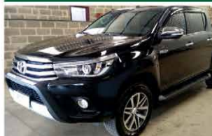
HILUX SRX TOP AUTOMÁTICA ANO 2017

www.comercialgomes.com comercialgomes.cb@bol.com.br