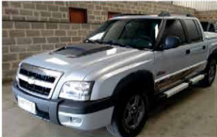
S 10 RODEIO DIESEL ANO 2011