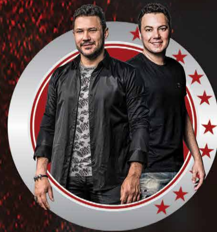
JOÃO BOSCO & VINÍCIUS