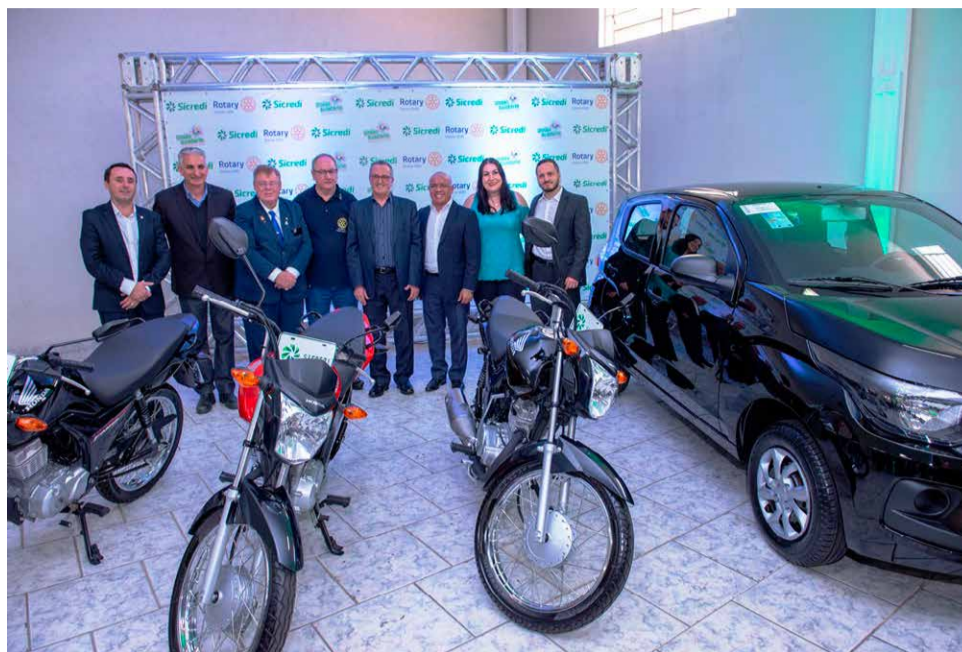
Premiação: um automóvel e três motocicletas serão sorteados no final da Campanha União Solidária

A campanha é válida em todo o Centro Leste Paulista, região que compreende a área de atuação da Sicredi União PR/SP, pelos municípios de Aguai, Água da Prata, Americanas, Araras, Caconde, Casa Branca, Charqueada, Conchal, Cordeirópolis, Divinolândia, Engenheiro Coelho, Espírito Santo