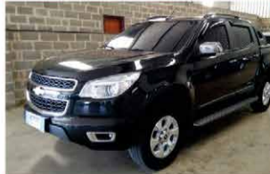
S 10 LTZ FLEX MECANICA ANO 2015