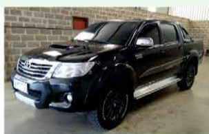
HILUX SRV TOP AUTOMÁTICA ANO 2015