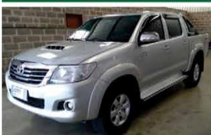
HILUX SRV AUTOMÁTICA ANO 2014