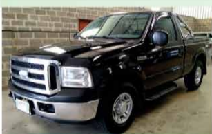
F 250 XLT C. SIMPLES 4X2 ANO 2010

COMERCIAL GOMES DOTA VEÍCULOS E MÁQUINAS AGRÍCOLAS VENDAS - COMPRAS - CONSIGNAÇÃO