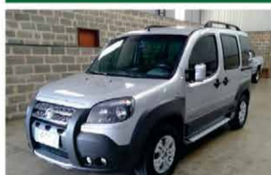
FIAT DOBLO ADVENTURE ANO 2013