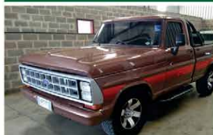
F 1000 DIESEL ANO 1982