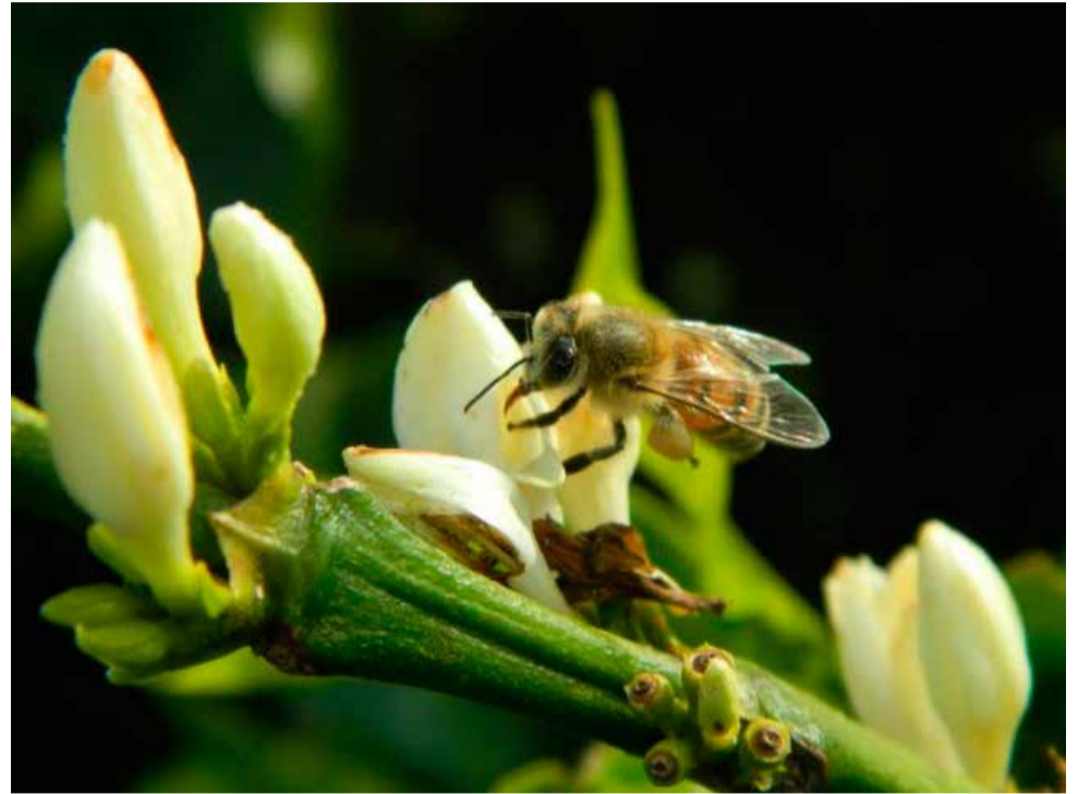
Quanto mais abelhas na produção de café, mais frutos polinizados e bem produzidos

A startup Agro Bee, em parceria com a Embrapa, esta desenvolvendo uma plataforma digital para integrar o apicultor que tem abelhas disponíveis para serem usadas na polinização com os