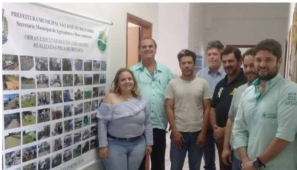
Representantes da Secretaria de Agricultura e Meio Ambiente de São José do Rio Pardo e da UNIFEOB discutiram o plano de ações para os produtores locais

“Os principais problemas apurados, como ambiental, financeiro, comercial, entre outros, estão sendo analisados pelos