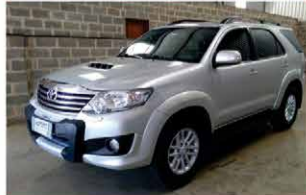
HILUX SRV AUTOMÁTICA ANO 2013