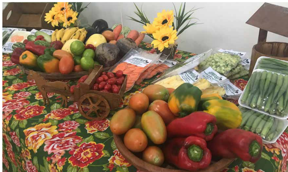
Galpão equipado com câmaras frias melhorará distribuição dos produtos