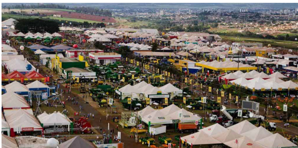
Principais marcas da cadeia produtiva do agronegócio nacional e internacional estarão presentes na Agrishow 2018

Como a economia em 2017 foi salva pelo agronegócio - que registrou safra recorde de 237,7 milhões de toneladas -, a Agrishow deste ano promete surpreender. Para se ter ideia, o espaço destinado ao evento de 440 mil metros quadrados terá parte ocupado por mais de 800 marcas do Brasil e do exterior de vários segmentos ligados à agricultura e à pecuária, como máquinas, equipamentos e implementos