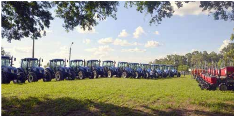
Cada conjunto é formado por um trator, uma semeadeira, um pulverizador e um distribuidor de calcário

Vargem Grande do Sul e São Sebastião da Gramma estiveram entre as cidades contempladas