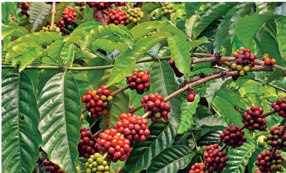
O resultado das exportações diretas manteve a Cooxupé líder entre as empresas brasileiras em operação que exportam café

Em 2017, foram recebidas 4,73 milhões de sacas de café arábica e embarcadas 5,5 mi. A cooperativa exportou diretamente 4,055 milhões de sacas para 48 países e destinou ao mercado interno 1,1 milhão de sacas. Já a SMC Specialty Coffees, empresa controlada pela