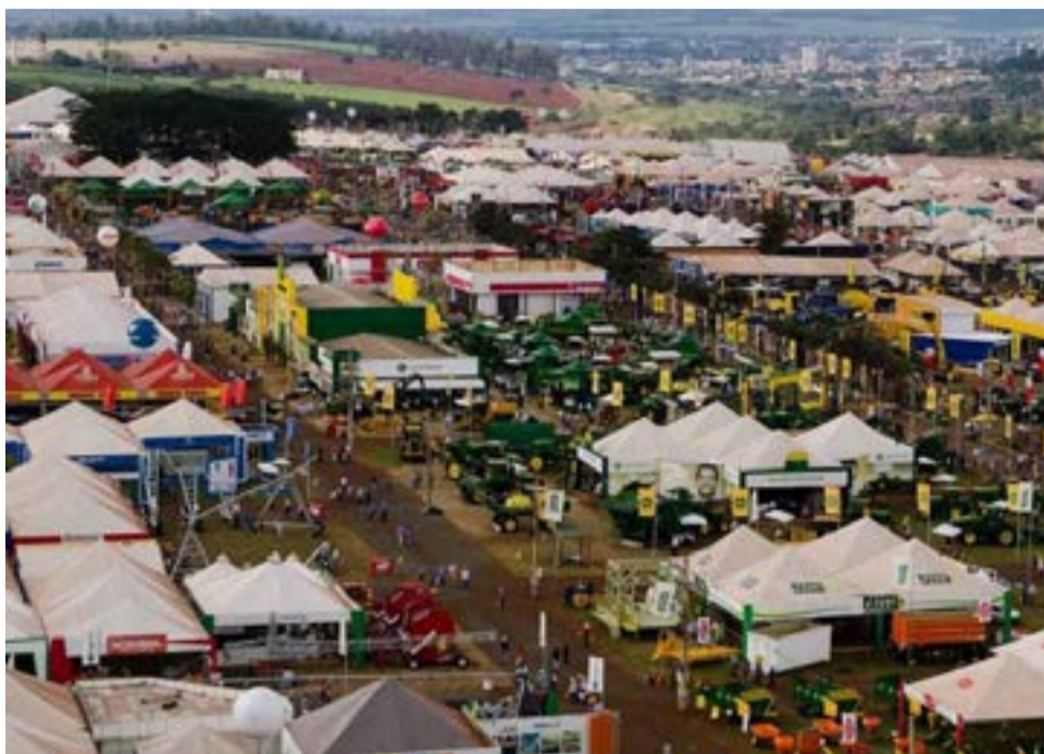
Com 440 mil m², Agrishow é realizada no Polo Regional de Desenvolvimento Tecnológico dos Agronegócios do Centro-Leste

entidades ligadas, direta e indiretamente, ao agronegócio brasileiro, como ABAG – Associação Brasileira do Agronegócio, Abimaq – Associa-