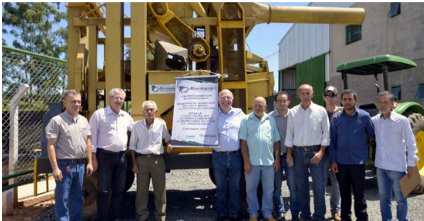
Descascadora de café foi entregue à Associação de Desenvolvimento Comunitário do Vale do Jaboticabal