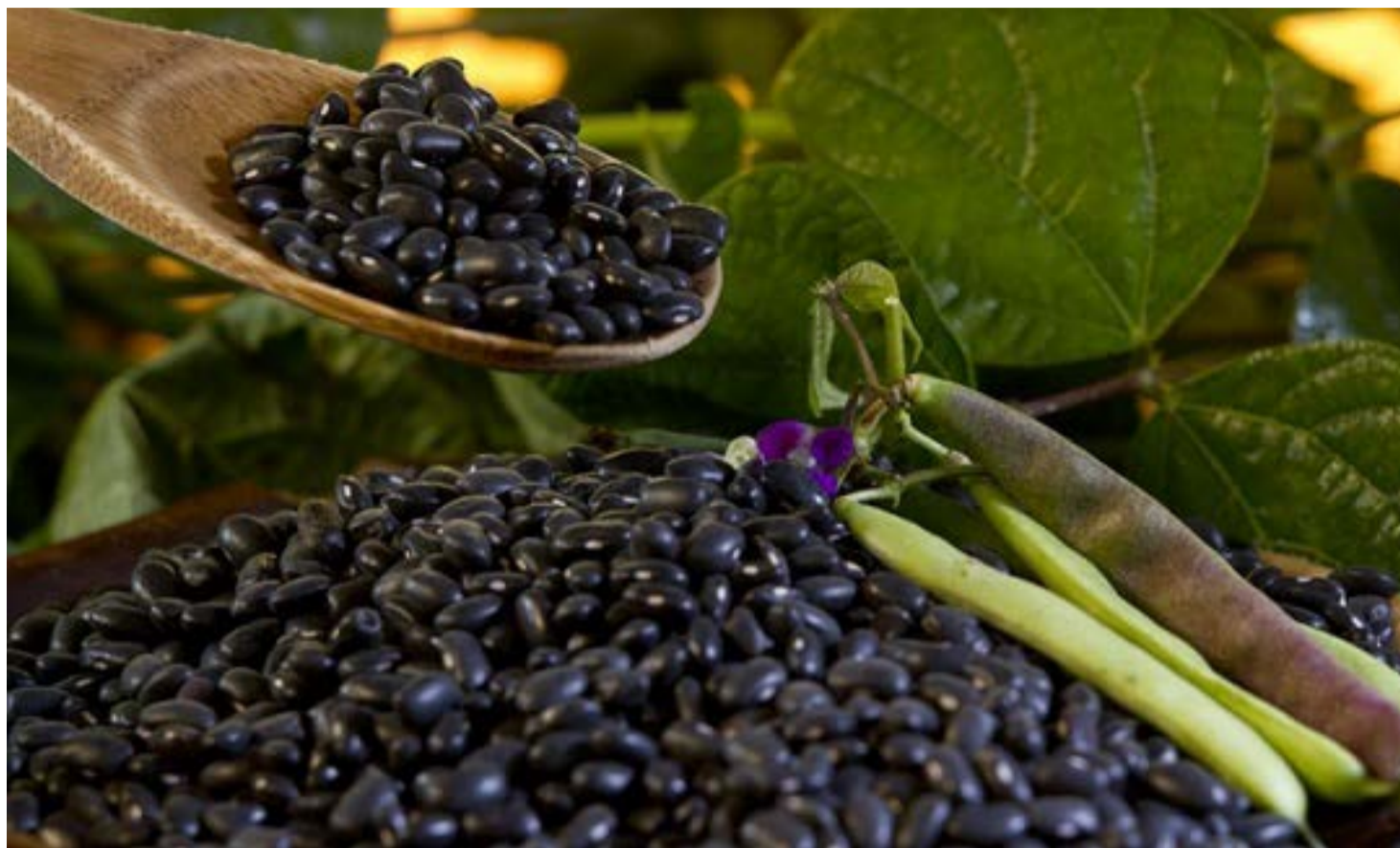
Feijão transgênico é resistente ao vírus do mosaico-dourado

A primeira variedade de feijão transgênico no mundo resistente ao vírus do mosaico-dourado – principal praga da cultura que chega a causar até 40% de perdas nas lavouras – se tornou exemplo das divergências internas entre pesquisadores e a diretoria da Embrapa.