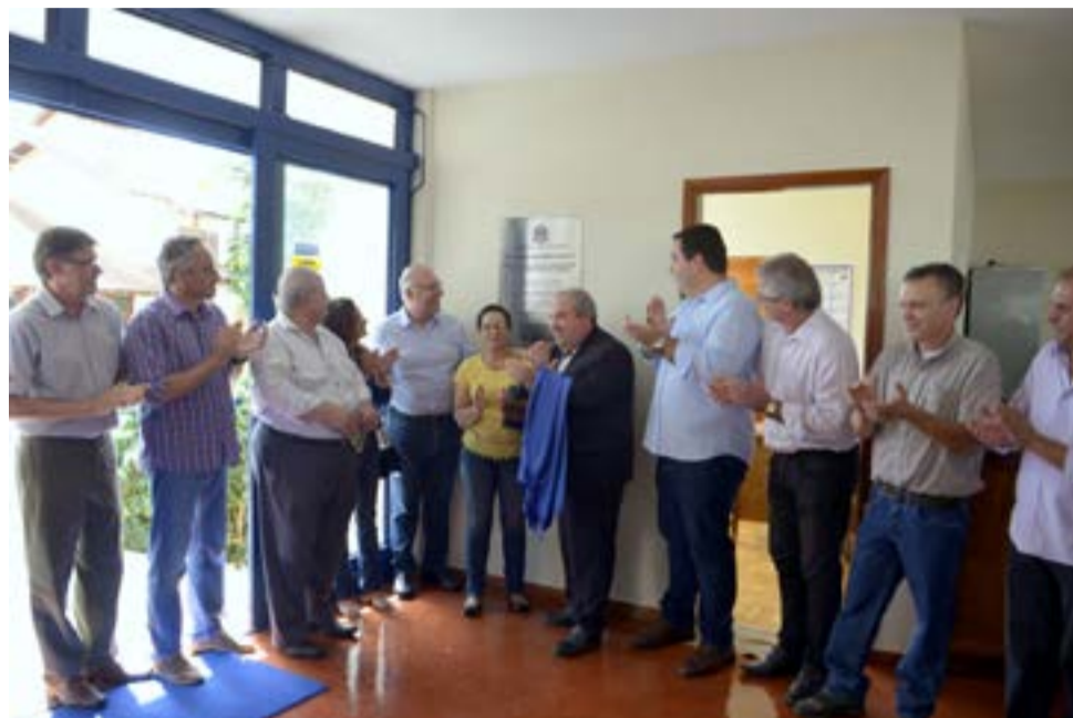
Autoridades durante o descerramento da placa da Casa da Agricultura

A melhoria faz parte de uma série que vem sendo realizada com recursos do Projeto Microbacias II. Em 2017, foi de 36 o número de unidades reformadas, sendo que a previsão da Coordenadoria para este ano