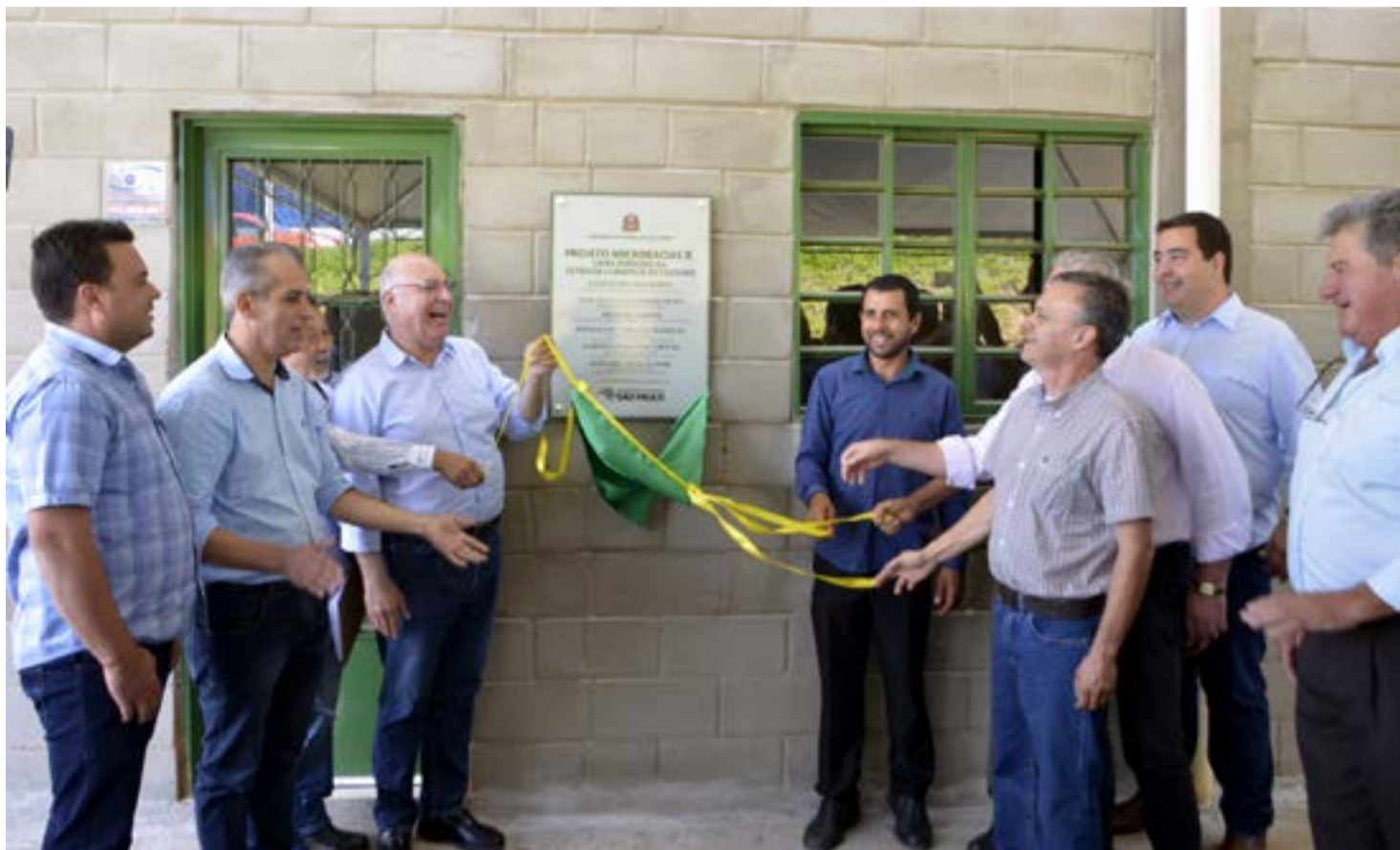
Packing house para rebenefício de cafés especiais aumentará o lucro dos associados

A Associação foi beneficiada na quarta Chamada Pública do Projeto, execu-