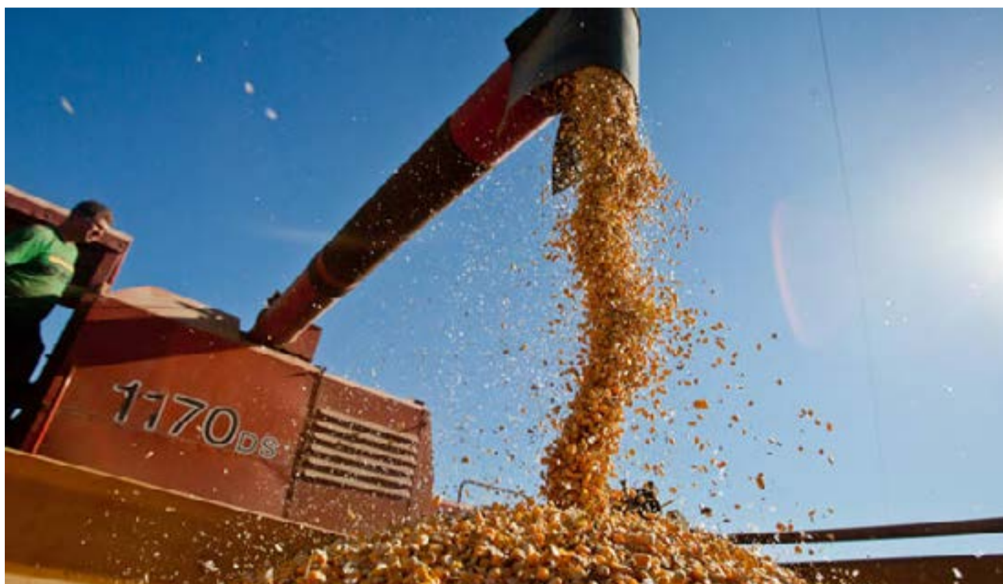
Excesso de chuvas dificultou o avanço da colheita da safra de verão

atenção seguirá voltada para o clima e andamento dos trabalhos no campo. Em um cenário mais