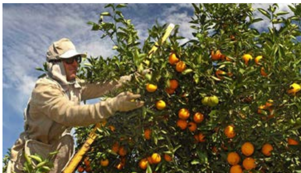
Crescimento na demanda por mão de obra no setor citrícola se deve ao grande volume de laranjas produzido

O impacto do crescimento da produção de laranjas na alta da demanda por mão de obra fica mais claro quando se observa que 37% das contratações do setor aconteceram nos seis primeiros meses da safra 2017/2018, entre julho a dezembro do ano passado. Das 51.477 admissões registradas em 2017, 19.287 postos de trabalho foram gerados nesse período. "De acordo com o Fundecitrus a estimativa é que nessa safra sejam produzidas 385,20 milhões de caixas de laranjas.