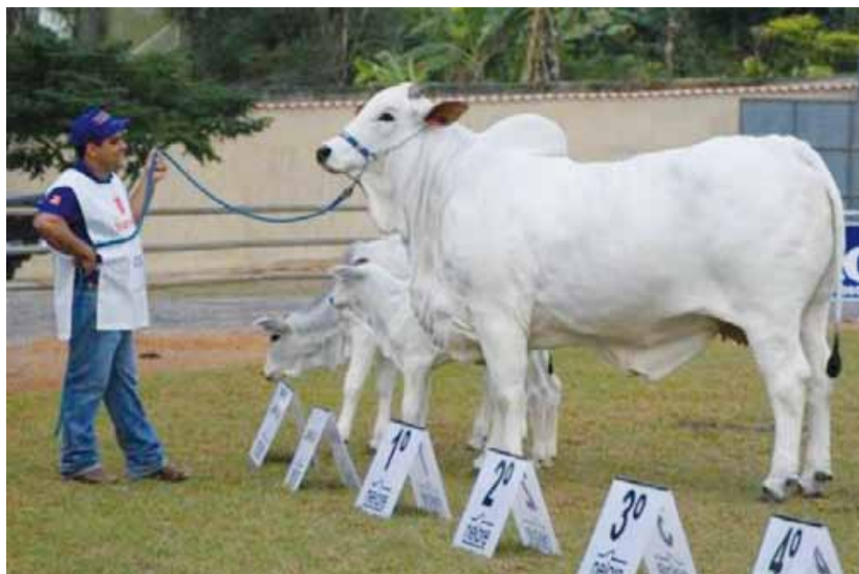
Gado nelore está entre os atrativos da EAPIC

Dentro da programação, o público pode conferir as tradicionais exposições de bovinos e equinos, assim como a de ovinos e caprinos – que tem por finalidade fomentar o desenvolvimento da cadeia produtiva da ovinocultura na região de São João da Boa Vista. Além disso, o evento traz provas de charrete, hipismo clássico e marcha de