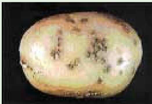
A sarna-pulverulenta afeta principalmente os tubérculos que, depois de lavados, apresentam pústulas marrons

Sarna-pulverulenta (sarna, espongóspora) ( Spongospora subterranea )