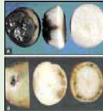
A podridão-seca causa o apodrecimento dos tubérculos iniciando por ferimentos ou pelos estolões (A). Quando o patógeno coloniza o sistema vascular, a doença é chamada de olho-preto (B)

Podridão-seca e olho-preto ( Fusarium spp. )