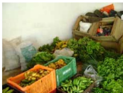
Produção familiar é vendida para a Conab e em seguida doada a várias instituições

A iniciativa faz parte de um Plano Municipal de Desenvolvimento Rural Sustentável (PMDR) a ser seguido pela Secretaria da Agricultura e que tem como finalidade o fortalecimento da agricultura familiar, a geração de trabalho e renda no campo, assim como a promoção do desenvolvimento local por meio do escoamento da produção para consumo, garantindo ainda o acesso de alimentos em quantidade e qualidade para as entidades.