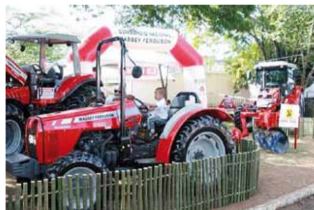
Evento tem a participação de diversos expositores

Devido essa grande estrutura e também por reunir diversos atrativos simultaneamente, a exposição tem se projetado cada vez mais no cenário nacional, ficando conhecida popularmente como a "festa country mais completa do país".