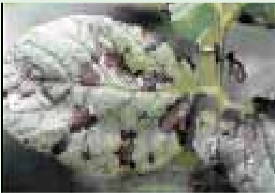
A pinta-preta se caracteriza por lesões pequenas e concêntricas, e o ataque se inicia nas folhas mais velhas.

Pinta-preta (mancha-de-alternária, alternária, crestamento-foliar) ( Alternaria solani )