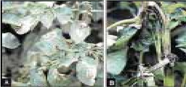
A requeima provoca manchas grandes nas folhas (A) e enegrecimento no caule (B), sendo mais comum na parte superior da planta.

Requeima (meia, míldio, mufa, preteadeira, fitôftora, crestamento-da-fitôftora) ( Phytophthora infestans )