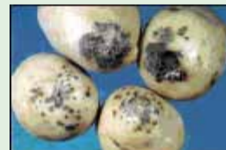
O olho-pardo se caracteriza por lesões superficiais, marrons, que se desenvolvem a partir das lenticelas.

Afeta somente os tubérculos, onde provoca pontos superficiais marrom-escuros ao redor das lenticelas localizadas mais próximas à região do estolão. É muito comum em solos de Cerrado, principalmente se a batata é cultivada após ervilha e soja, que também são hospedeiras do fungo. Pode ser confundida com a podridão-seca.