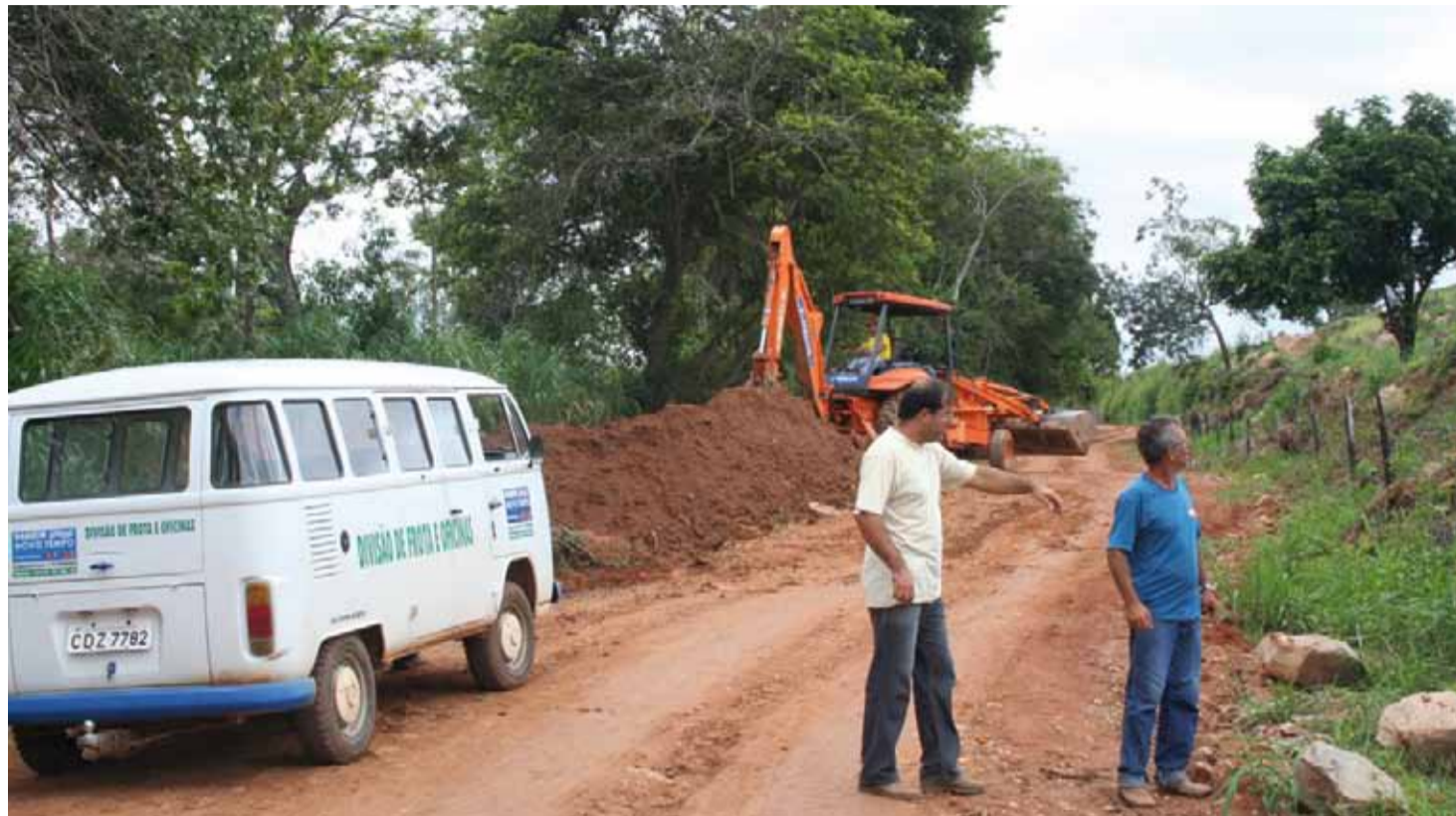
Funcionários da prefeitura estão prestando a manutenção das estradas vicinais

Segundo a assessoria, caso não chova nos próximos dias, as demais estradas rurais que necessitam de reparos serão atendidas