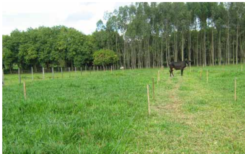
Capim mombaça: primeiro pastajeiro no piquete, 50 dias depois da sementeira