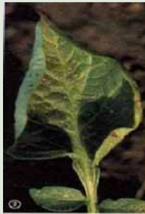
PLRV (Potato Leaf Roll Virus) Enroulement des feuil- les en gouttière ou en cornet