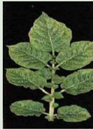
PVA (Potato Virus A) Folioles avec limbe et bordure déformés