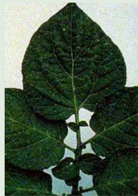
PVS (Potato Virus S) Enfoncement des nervures sur la face supérieure des feuilles