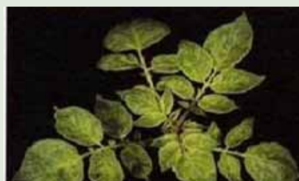
PVX (Potato Virus X) Feuilles déformées avec des taches claires en mosaïques

restringe a algumas cultivares. Ocorre, também, considerável variação na taxa de transmissão de estirpes de determinados vírus, seja em um mesmo hospedeiro, seja em hospedeiros diferentes.