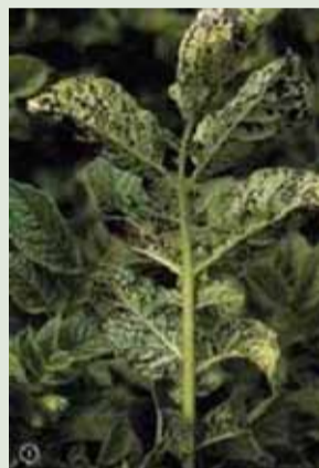
PVY (Potato Virus Y) Stries nécrotiques noirâtres sur la face inférieure des folioles