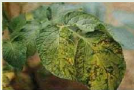
PVYntn (Potato Virus Yntn) Jaunissement avec présence d'anneaux verts sur folioles