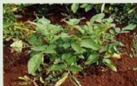
PLRV (Potato Leaf Roll Virus) Enroulement des feuilles en gouttière ou en cornet