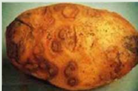
PVYntn (Potato Virus Yntn) Nécroses anulares superficiais

A transmissão através de sementes ocorre em 25 gêneros e em mais de 100 espécies de vírus. A taxa varia de 0 a 100 %, porém raramente excede a 50 % e, na maioria dos casos, é muito menor, pois muitos vírus embora infectem as sementes na fase inicial do desenvolvimento, são eliminados durante o processo de maturação das mesmas. A capacidade de transmissão por sementes é específica para a interação vírus/hospedeiro. Em algumas espécies a transmissão se