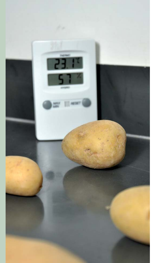
Laboratório da Cooperbatata atende a todas as normas estipuladas pelo Ministério da Agricultura, Pecuária e Abastecimento (MAPA)

vada pelo MAPA. Após estes ajustes, o laboratório foi auditado pelos fiscais agropecuários do MAPA, obtendo a recomendação para o seu Credenciamento no qual culminou com a publicação desta Portaria.