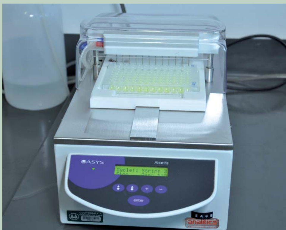
O lavador de microplacas é um dos modernos aparelhos que o laboratório possui