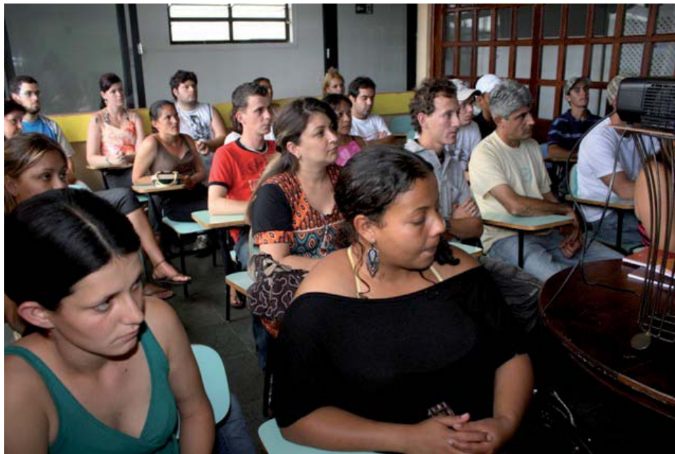
Cerca de 30 jovens iniciaram o curso de Barista na última semana