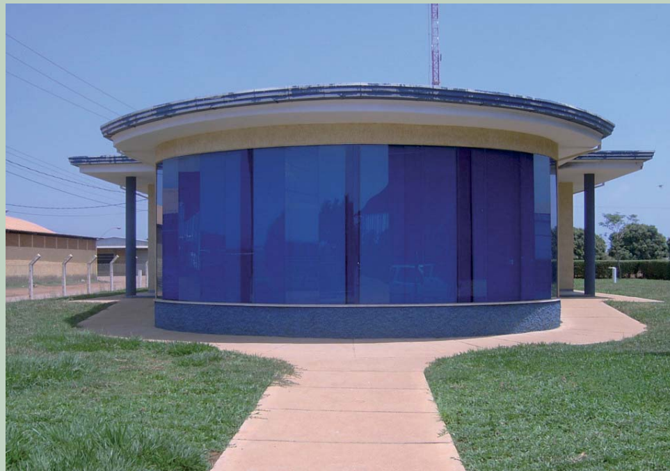
Fundado em 2005, o Laboratório de Análise de Víruses em Batata-Semente é referência na região

O laboratório passou por várias adequações: aquisições e calibrações de equipamentos; uso de metodologia de análises apro-