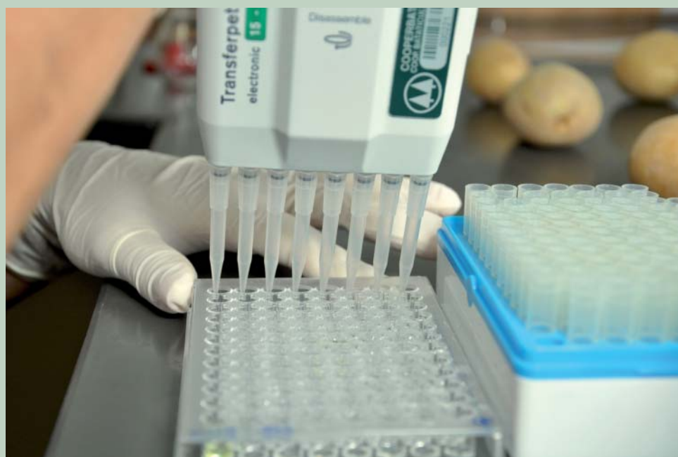
Instituto conta com modernos equipamentos para análise de batata-semente