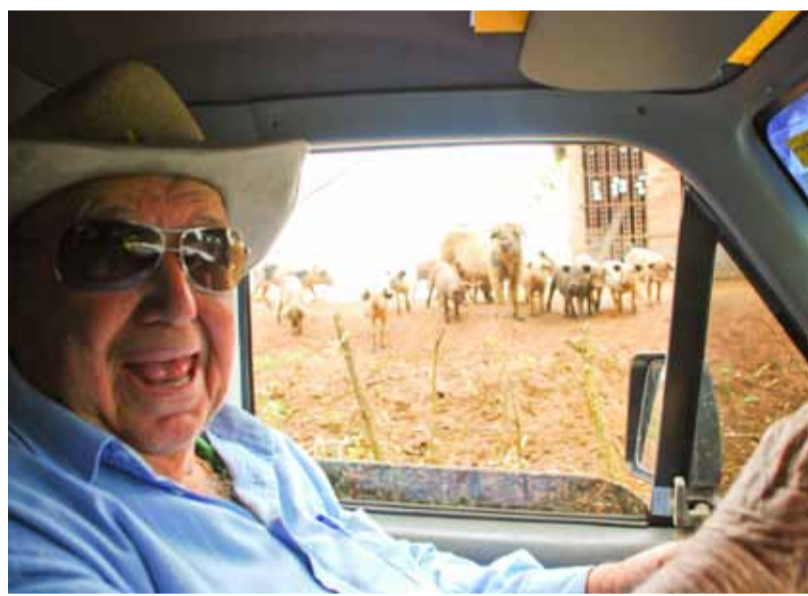
Produtor exhibe sua criação de porcos caipiras, um de seus hobbies