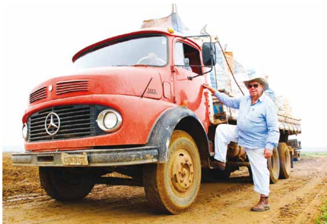
Agricultor exibe com orgulho o terceiro caminhão que adquiriu no início de sua carreira. Veículo é usado até hoje na Fazenda Campo Vitória