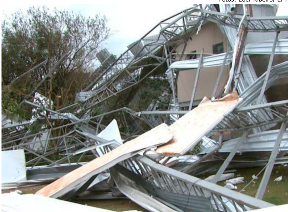
Galpão onde eram lavadas as verduras ficou completamente destruído em um sítio em São José do Rio Pardo

Os 12 funcionários que trabalhavam na hora da chuva se abrigaram no escritório. "Estava todo escuro o quartinho, quanto vi abriu e ficou aquele clarão. Já tinha arrancado tudo. Meu patrão veio para socorrer os carros e quase que [o telhado] caiu em cima dele. Foi bem