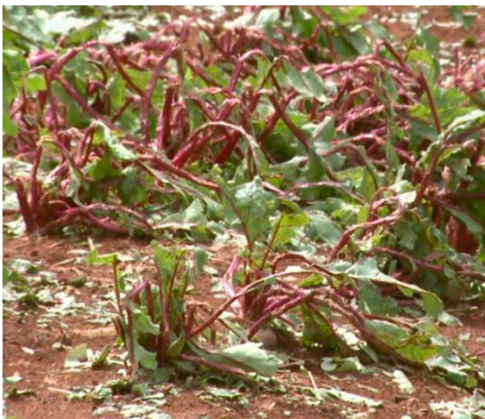
Em Divinolândia, as pedras de gelo destruíram 32 hectares de beterraba em propriedade rural