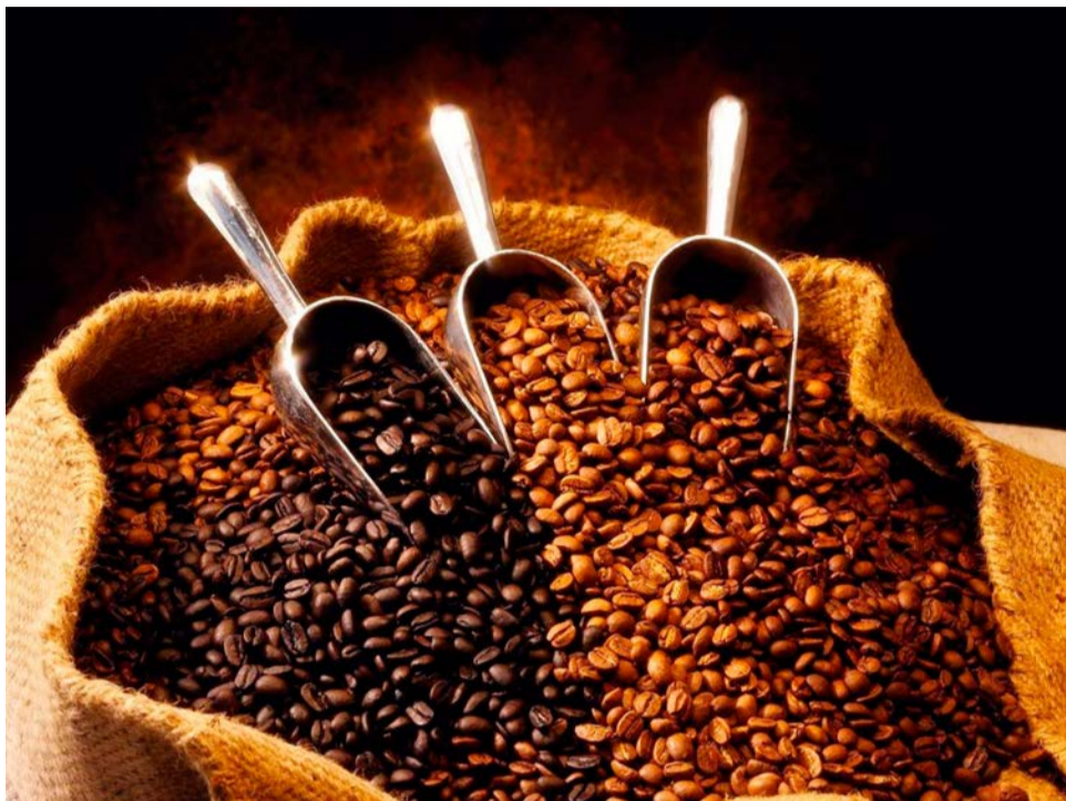
Leilão dos grãos vencedores será feito entre os dias 30 de outubro e 6 de novembro

O leilão dos grãos vencedores será feito entre os dias 30 de outubro e 6 de novembro, já a premiação dos melhores cafés do Estado de São Paulo será realizada no dia 20 de novembro, no Museu do Café em Santos. A cerimônia de lançamento da reunião dos vitoriosos, a 13ª Edição Especial dos Melhores Cafés de São Paulo, está marcada para 17 de dezembro, no