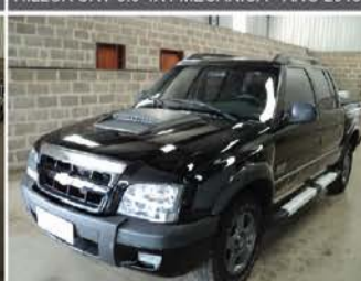
S-10 RODEIRO FLEX ANO 2011