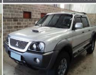
L-200 4X4 OUTDOOR ANO 2010