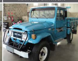
TOYOTA BANDEIRANTE 4X4 - ANO 1980