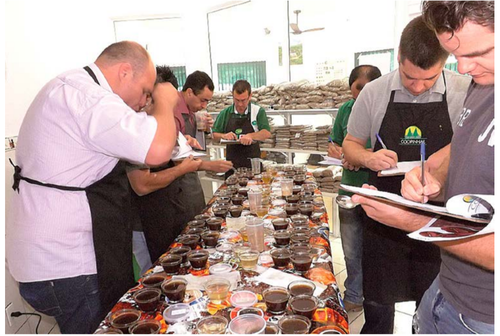
Coopinhal realizará concurso no dia 10 de outubro

Na região, os concursos de qualidade do café já têm suas datas definidas. Em São Sebastião da Gramma, a avaliação será nos dias 18 e 19 de setembro, enquanto que em Divinolân-