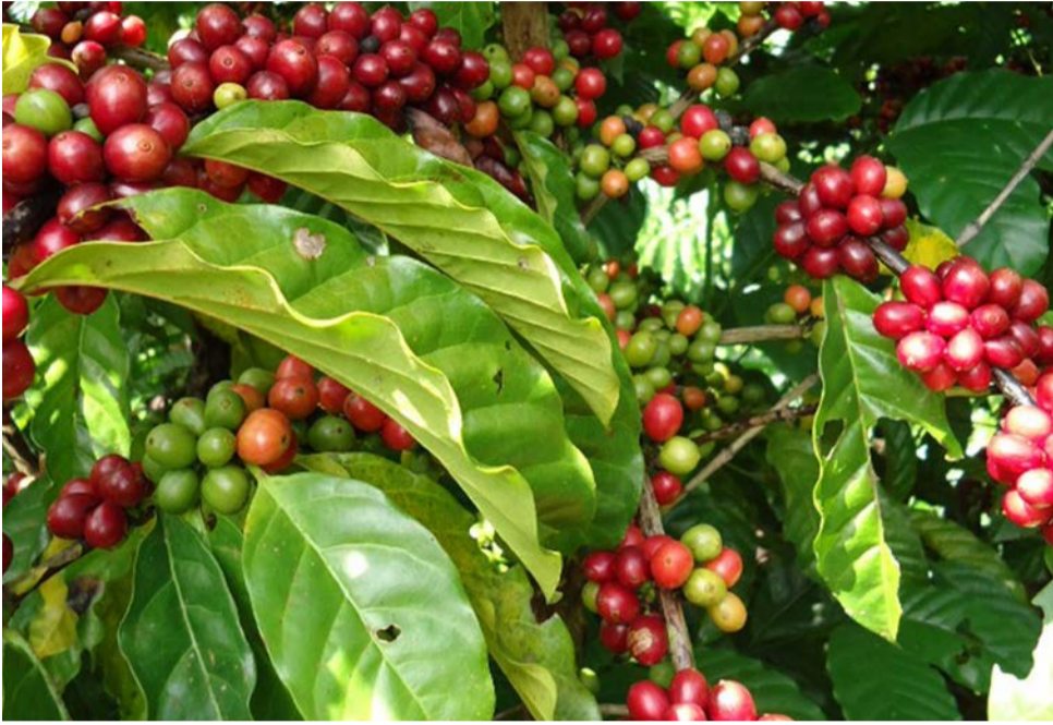
Qualidade dos cafés da região é reconhecida em todo país

Produtores se preparam para participar da fase regional que escolherá os finalistas da etapa paulista