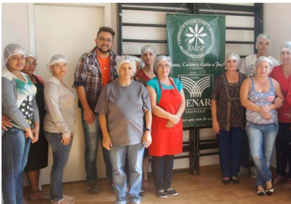
Participantes aprenderam a elaborar e planejar cardápios e receitas com o aproveitamento de alimentos

Durante o curso, os participantes aprenderam a elaborar e planejar cardápios e receitas com o aproveitamento de alimentos e partes dos mantimentos que normalmente acabam na lata de lixo. "O curso foi desenvolvido para, além de estimular hábitos de alimentação mais saudáveis, possibilitar o aproveitamento integral de alimentos, gerando uma maior economia no lar e a redução do desperdício de