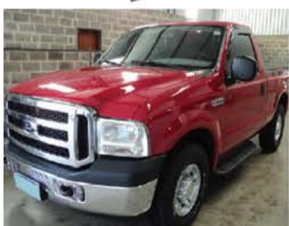
F-250 XLT SUPER DUTY ANO 2010