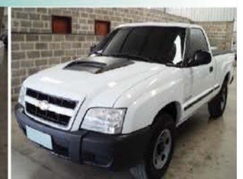
S-10 COLINA 4X4 ANO 2011