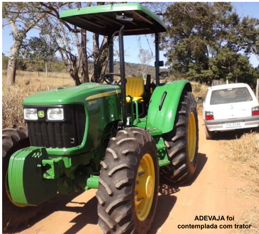
ADEVAJA foi contemplada com trator

Segundo informações da Prefeitura, outros recursos serão liberados para Caconde e região pelo Governo do Estado, através da Secretaria de Agricultura.