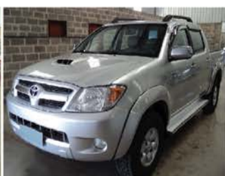
HILLUX SR 3.0 4X4 MECANICA ANO 2008