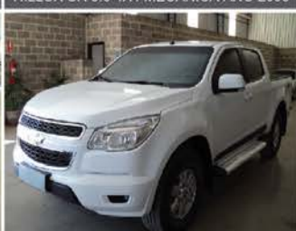
S-10 LT CAB. DUPLA AUTOMATIC ANO 2014