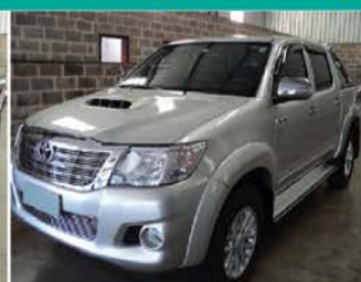
HILLUX SRV 3.0 4X4 AUTOMATIC - ANO 2013