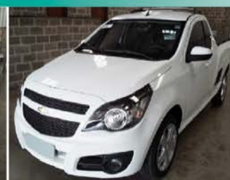
MONTANA SPORT ANO 2015