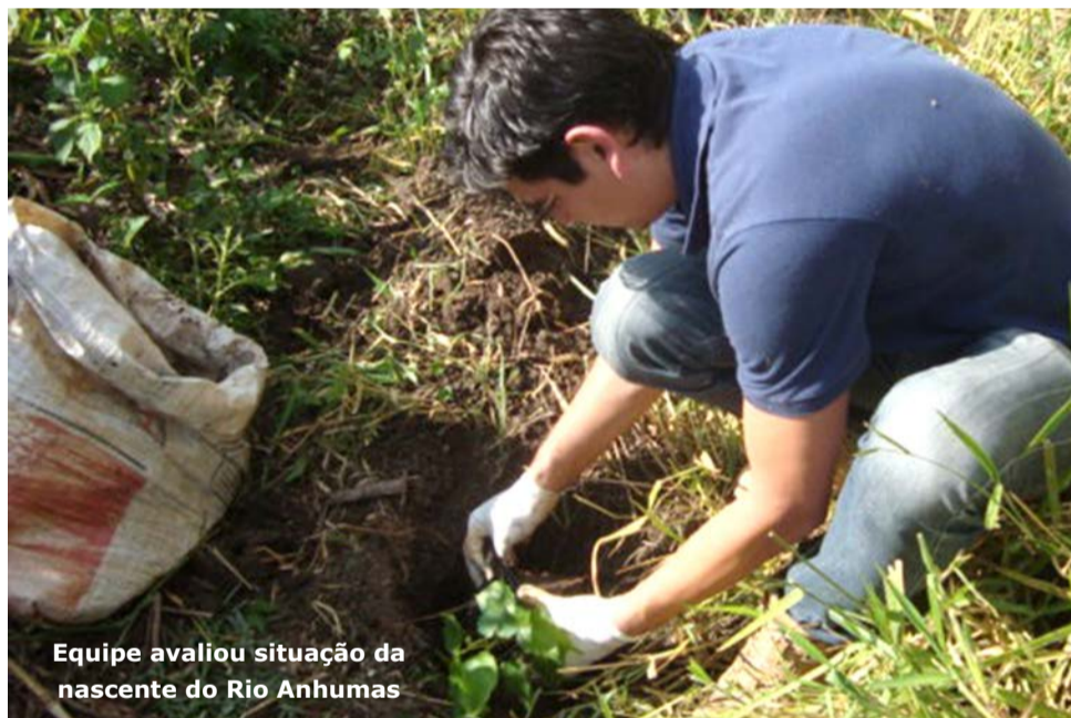
Equipe avaliou situação da nascente do Rio Anhumas

Diante do verificado, a Fazenda Córrego das Pedras doou 120 espécies arbóreas de porte média/alta para ajudar na recomposição da mata ao redor das nascentes, já que a restauração de Áreas de Preservação Perma-