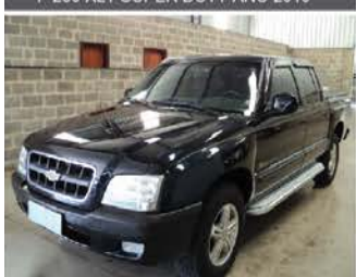
S-10 EXECUTIVA 4X4 ANO 2004