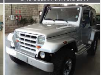
TROLLER 2.8 4X4 - DIESEL - ANO 2002