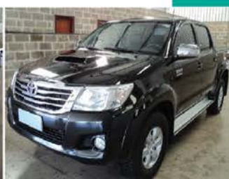
HILLUX SRV 3.0 4X4 MECANICA - ANO 2013